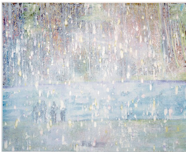
Slika 6. “Cobourg 3+1 više”

U kontekstu ranije spomenutih primjera eskapizma, odnosno bijega od stvarnosti, Doig nasljeđuje iskustvo Gauguina u suvremenom kontekstu. Poput Gauguina, i Doig vlastitim slikarstvom pa i življenjem prakticira eskapizam; Gauguin se od suvremenog života svoga vremena sklanja iz Pariza na Tahiti, a Doig se iz Londona sklanja na Trinidad i Tobago.