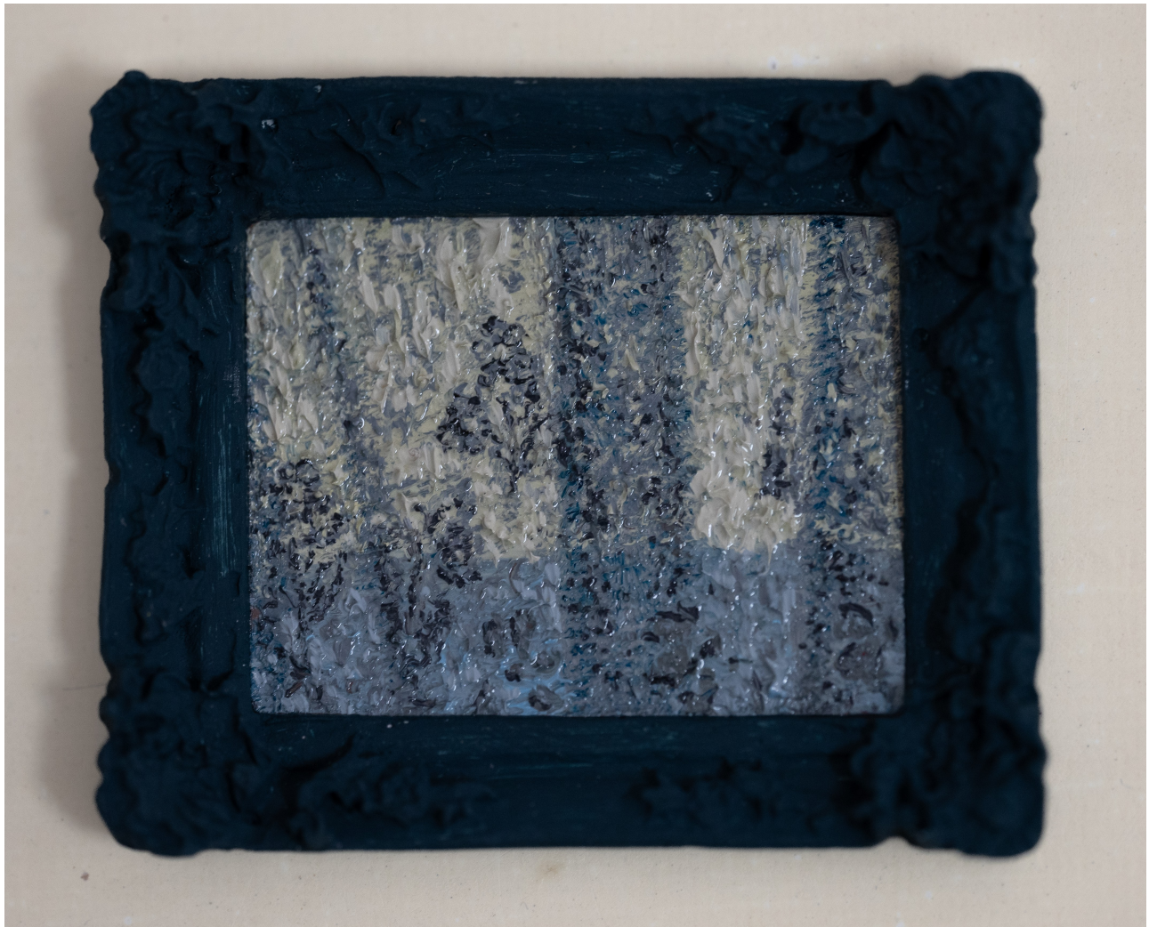
Slika 8. “Zavjesa”