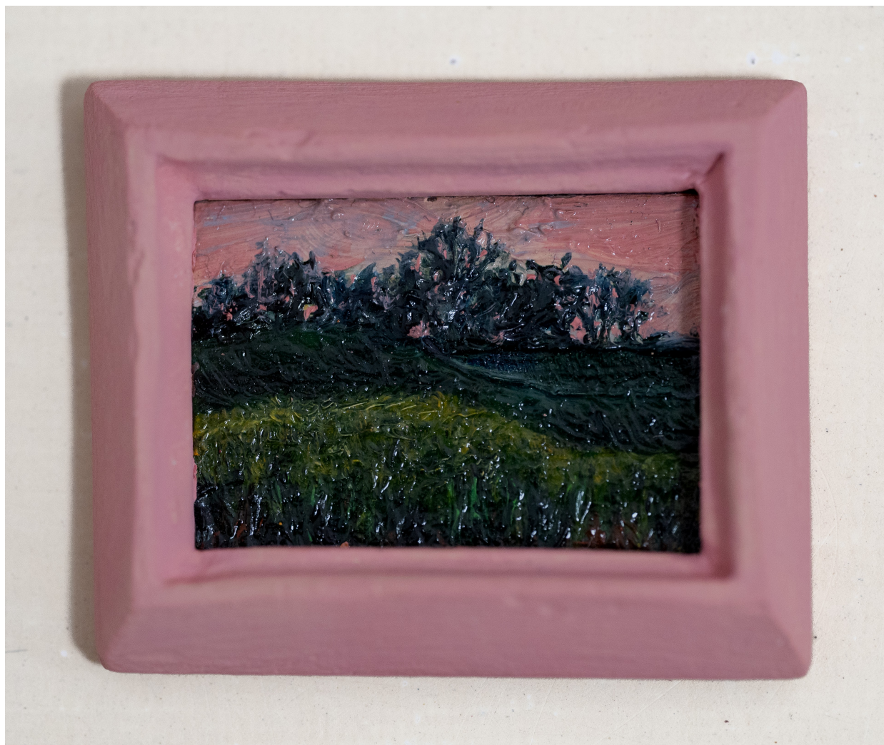
Slika 13. “Iza kuće”