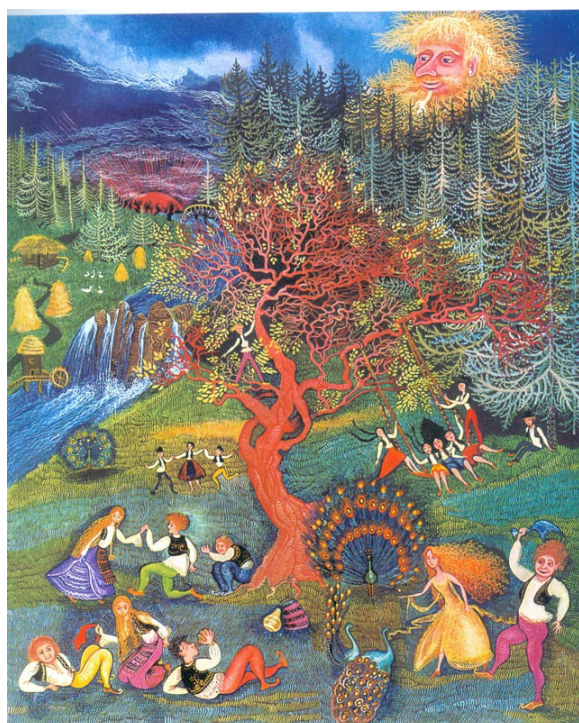
Slika 3. Cvijeta Job, ilustracija za bajku "Regoč"

Prema Hlevnjak i Ivanuš (2022) Cvijeta svojim minijaturama unosi novu dimenziju umjetnosti u Hrvatsku, a jedno od najznačajnijih djela ilustracije su za knjige Ivane Brlić-Mažuranić. Cvijetine, podosta osebujne, ilustracije zbog bogatih detalja, jedinstvenoga pristupa, izbora boja i lišavanja dobnog ograničenja postale su prepoznatljivi simbol priče koju interpretiraju.