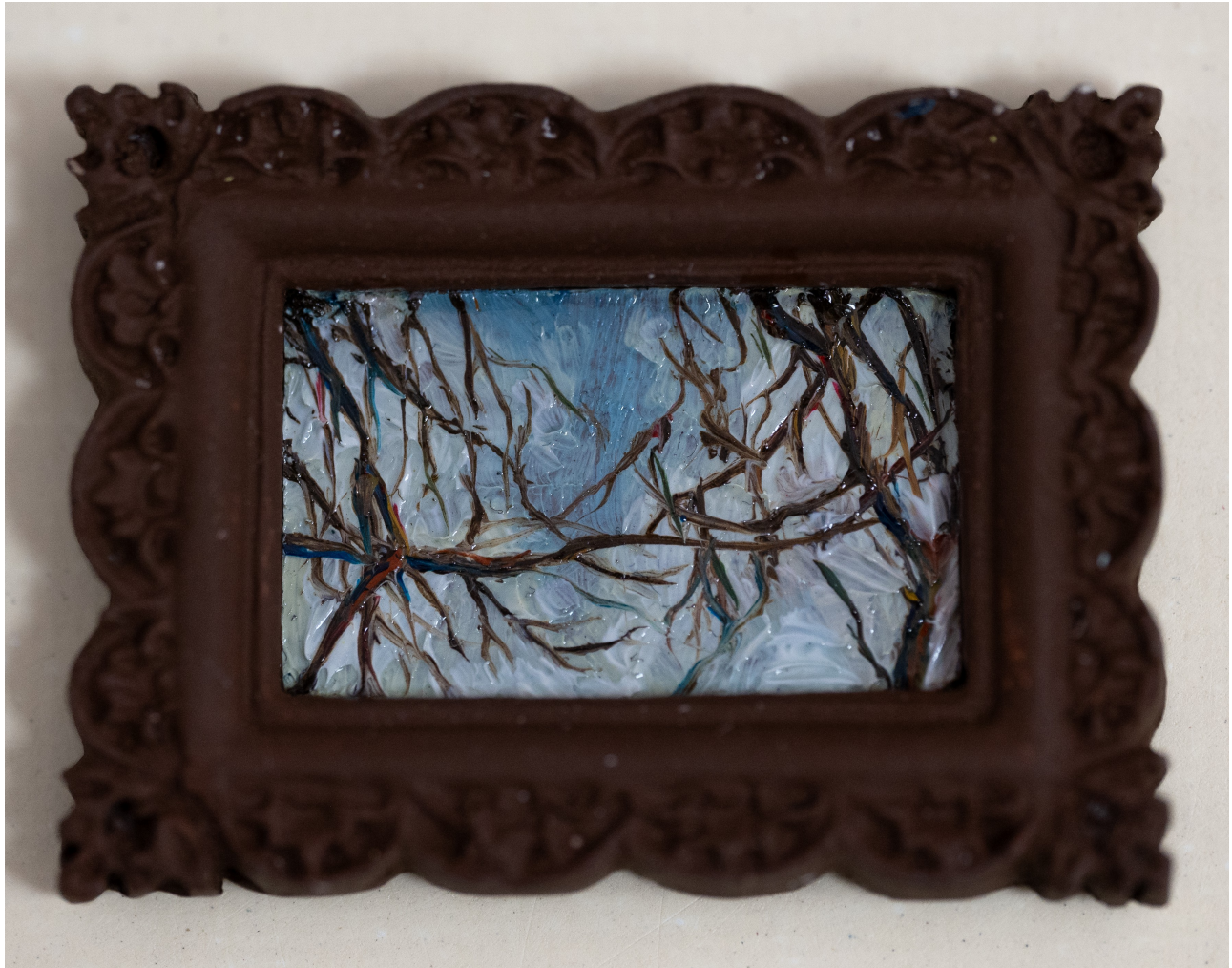
Slika 15. “Iz trave”