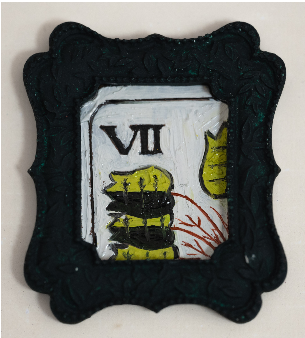
Slika 10. “ Ajmo sedme ”