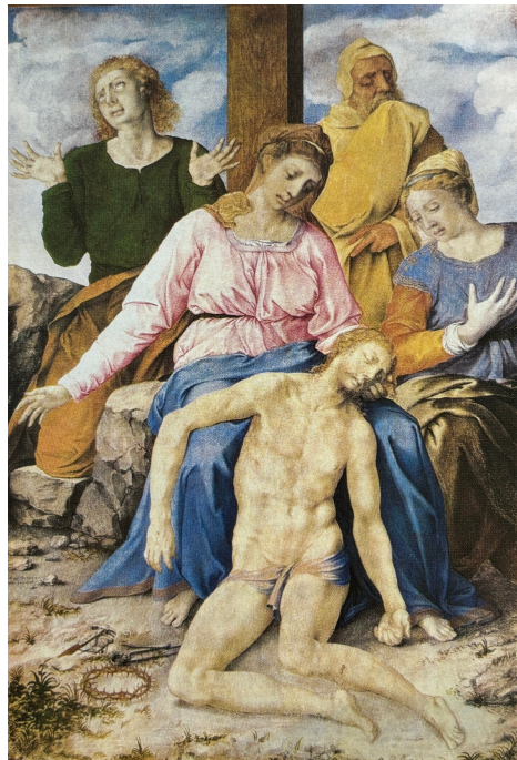
Slika 2. Julije Klović, “ Oplakivanje Krista ”

“Bio je vrlo cijenjen i neobično hvaljen od suvremenika (prozvan je Michelangelo minijature), poslije pak zaboravljen i djelomice osporavan; tek s novim istraživanjima i interpretacijama uočen je njegov doprinos europskoj i hrvatskoj likovnoj umjetnosti” (Hrvatska enciklopedija, mrežno izdanje).