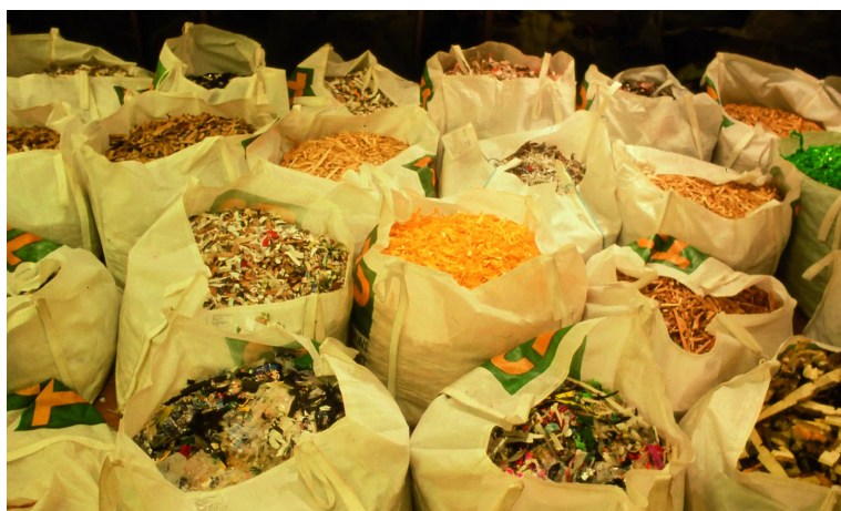
Slika 4. Michael Landy, “Komadići života ...Landyjeva imovina razbijena i spakovana po materijalu”

proizašlo, “Break Down” se povezuje sa sjećanjem i umjetnikovim životom te nas poziva na dublje razmišljanje o našoj vezi s materijalnim svijetom, o prolaznosti vremena, o tome kako sjećanja oblikuju našu percepciju te vizualizira poseban odnos prema vlastitoj imovini i uspomenama.