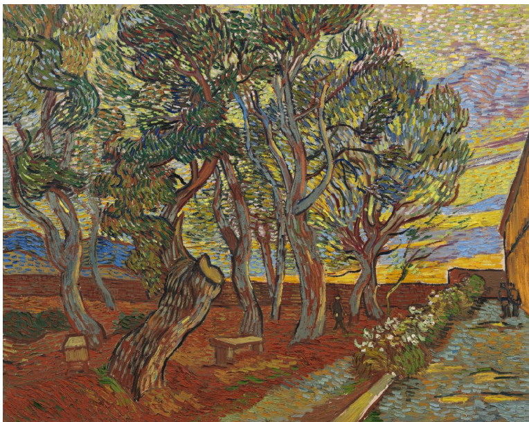
Slika 1. Vincent van Gogh, "Vrt sanatorija"