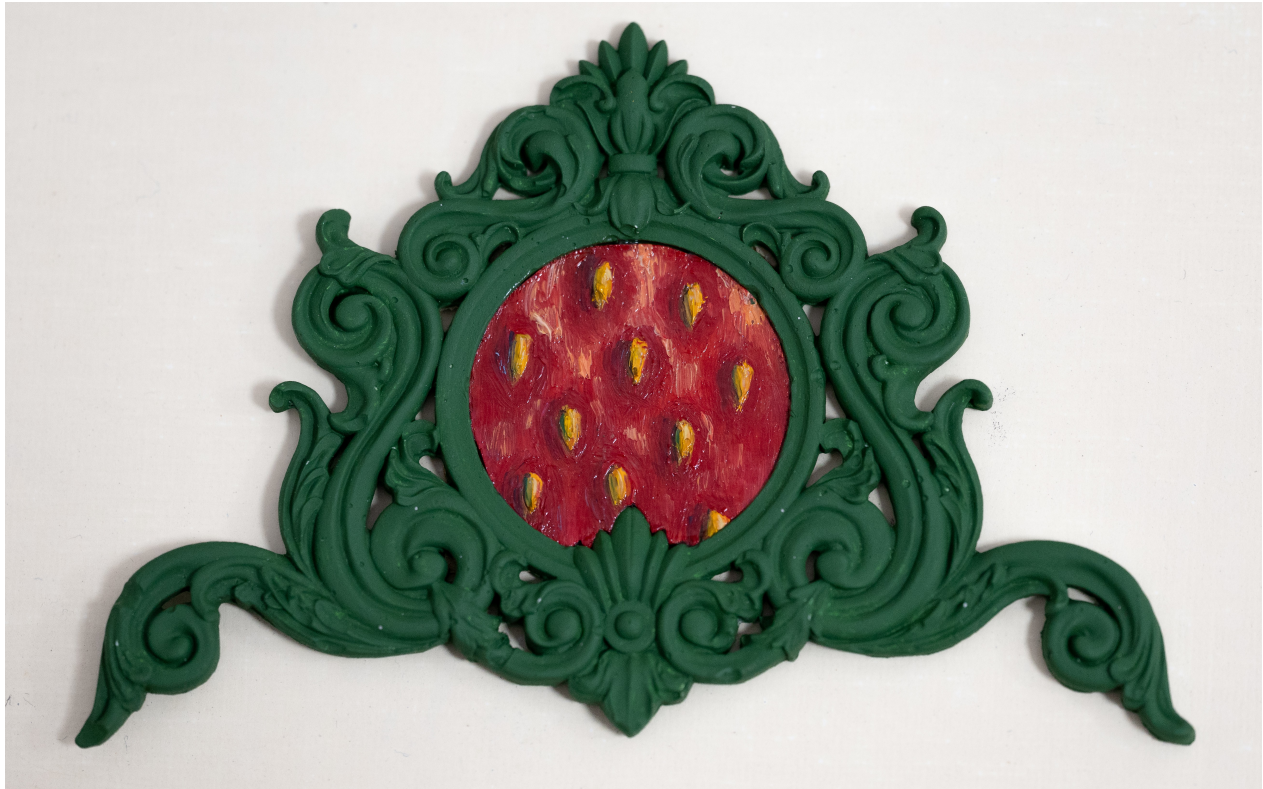
Slika 11. “ Jagoda ”