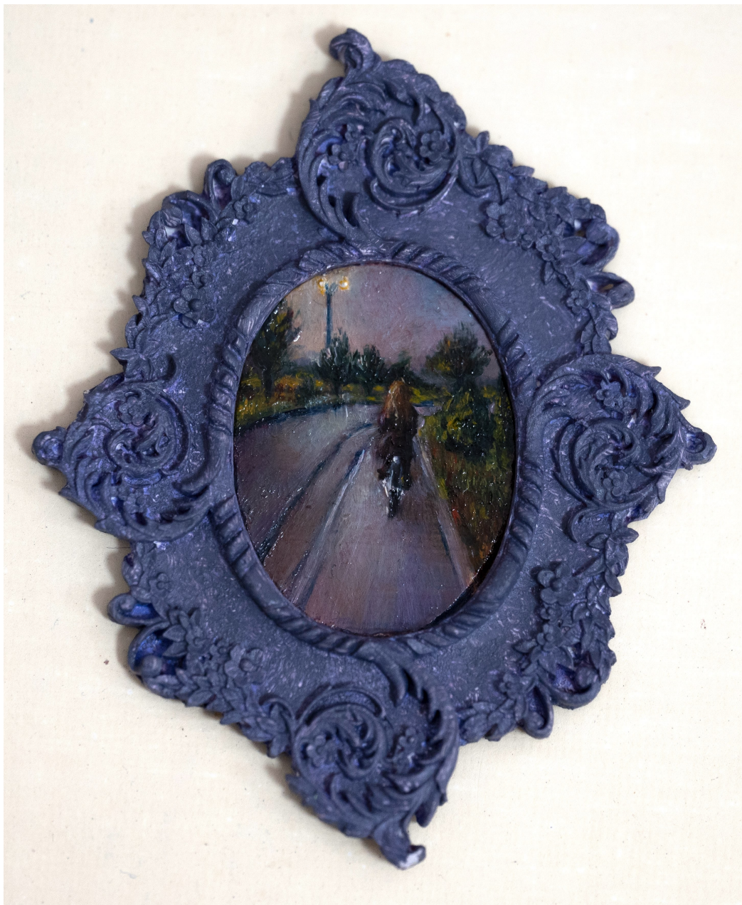
Slika 14. “Call me”