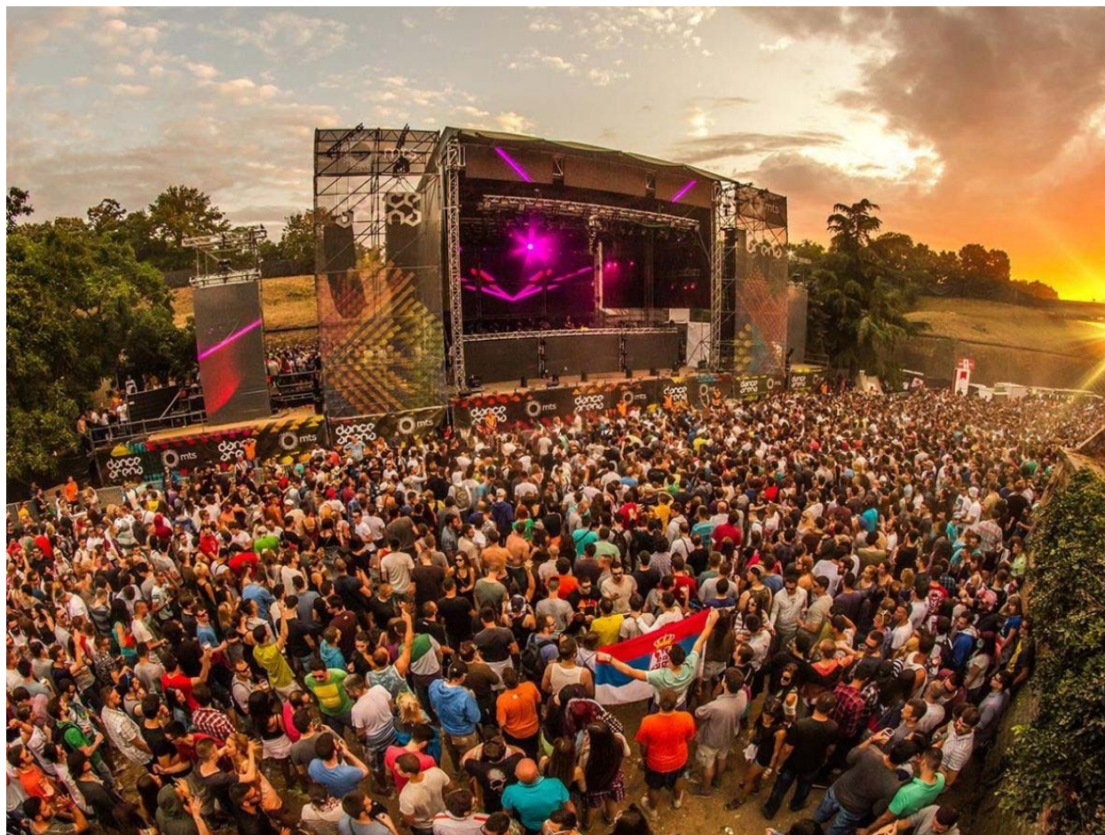
Slika 13. Glazbeni festival EXIT

Slika u nastavku rada prikazuje glavnu pozornicu na kojoj se izmjenjuju brojni izvođači tijekom pet dana trajanja festivala.