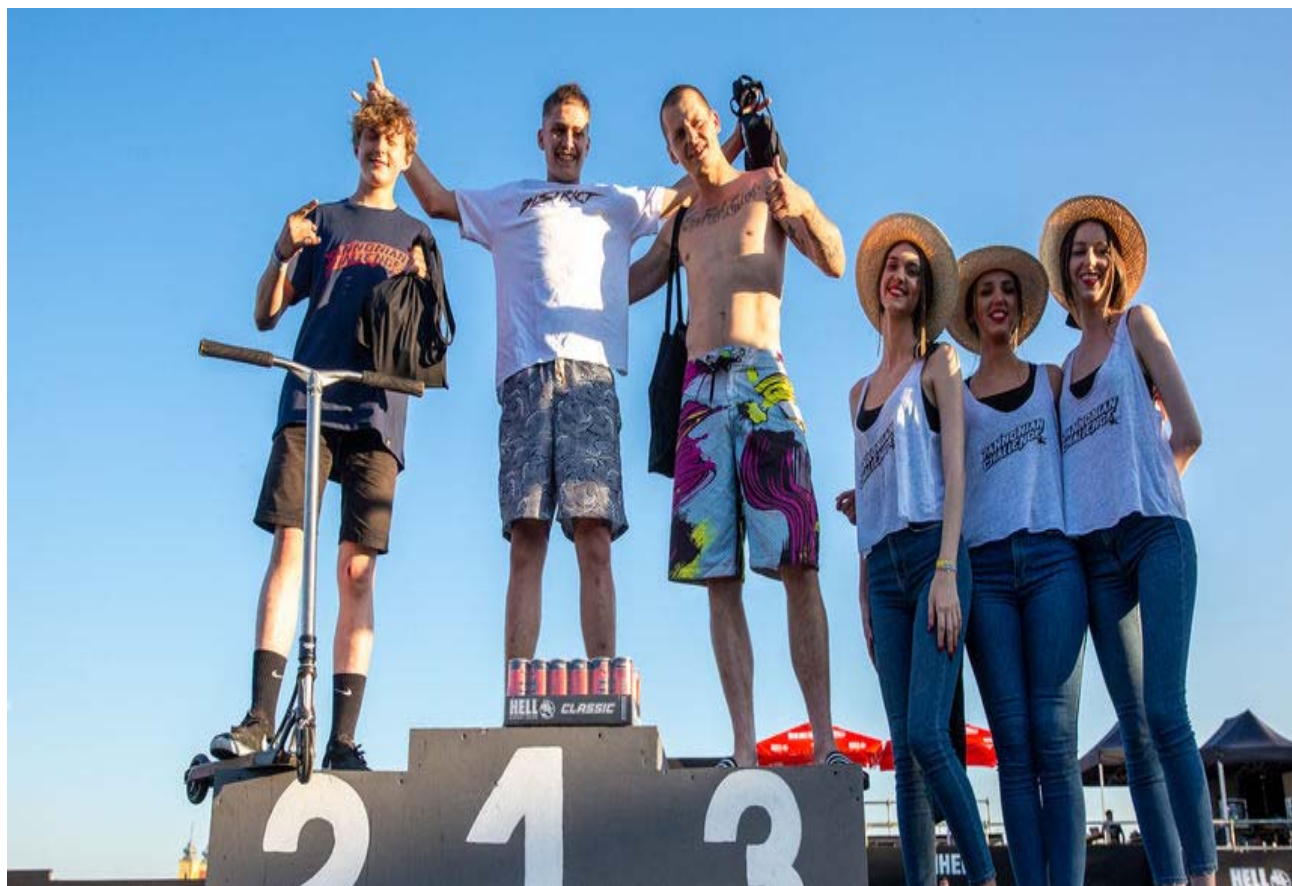
Slika 22. Proglašenje pobjednika u disciplini romobil koja je ove godine prvi puta uvrštena u natjecateljski program.

Na slici u nastavku vidi se premijerno ove 2019. godine svečano proglašenje najboljih natjecatelja u disciplini romobil. Ovo je disciplina koja je ove 2019. godine prvi puta uvrštena u natjecateljski dio programa i težnja je organizatora Pannoniana da od ove godine postane obavezni natjecateljski dio svake godine.