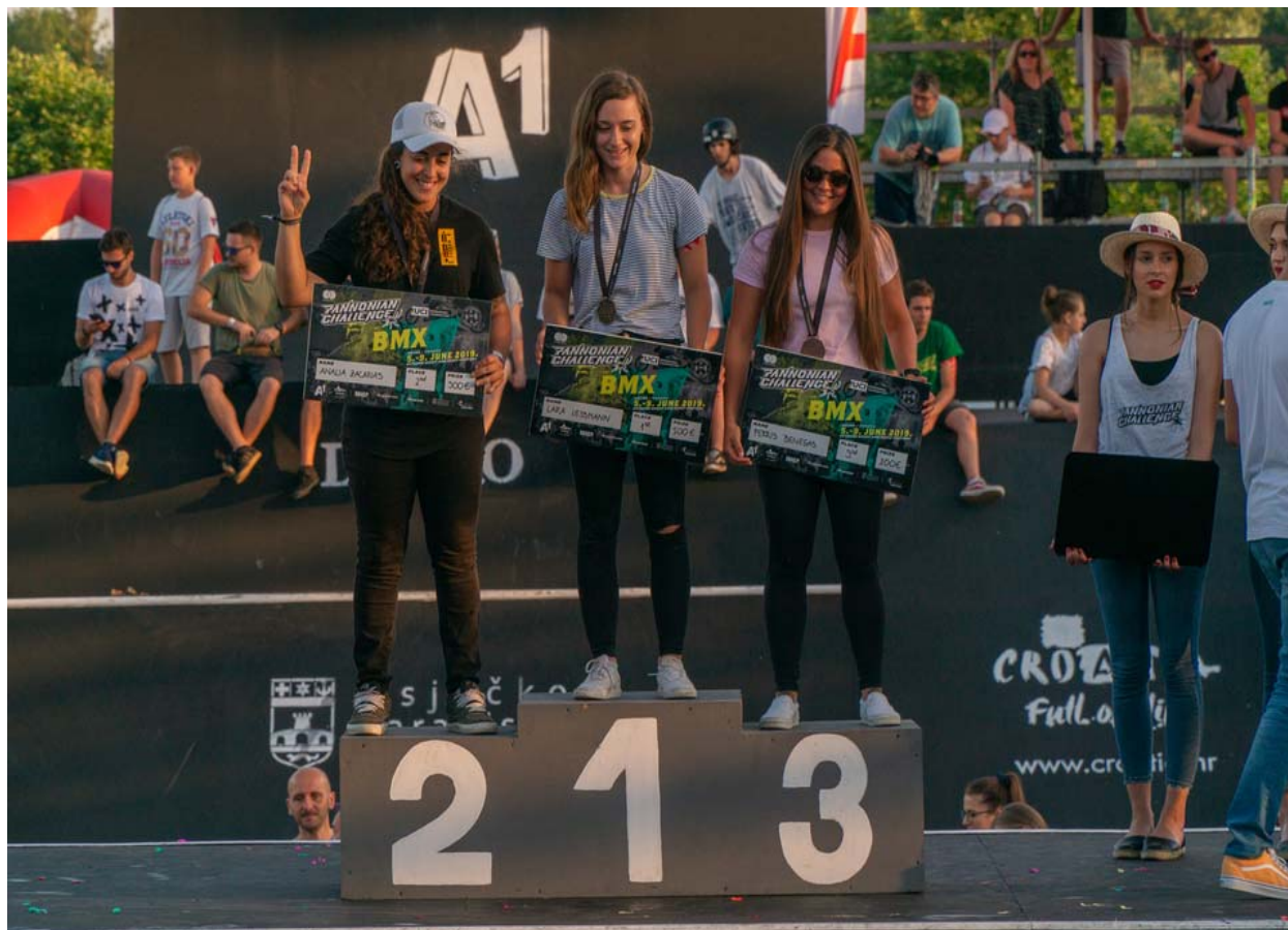
Slika 19. proglašenje pobjednika u disciplini BMX žene

Sljedeća slika prikazuje svečano proglašenje najboljih natjecateljica u 2019. godini u kategoriji BMX.