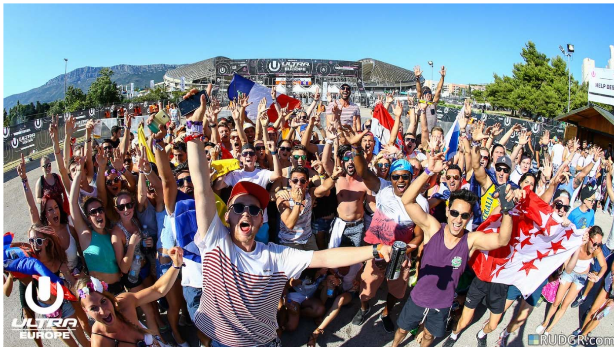
Slika 15. Ultra Europe ispred Poljuda kulnog stadiona NK Hajduk

Slika u nastavku prikazuje jedan manji dio posjetitelja ispred Poljuda 2018. godine (stadiona na kojem se šest godina održavala Ultra sve do ove 2019 godine). Slika prikazuje stanje, neposredno prije početka Ulte na kojoj se jasno može vidjeti dobro raspoloženje posjetitelja, pa čak kod nekih i nacionalnu pripadnost što potvrđuju zastavama svojih država.