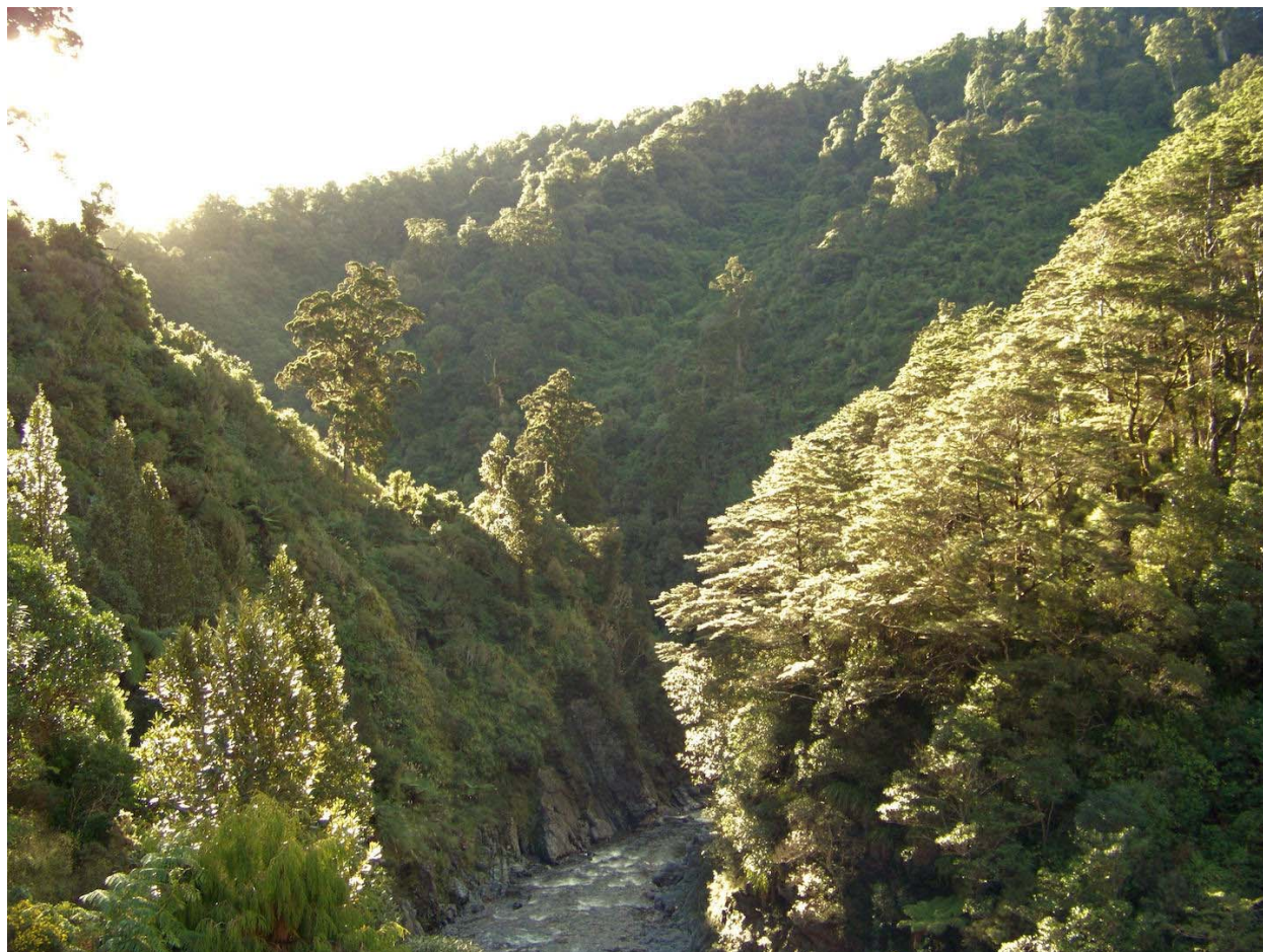
Slika 2. Mount Victoria

U Wellingtonu je sniman Gardens of Isengard, the River Anduin, Rivendell, Osgiliath Wood, Paths of the Dead. Ova slika prikazuje novozelandsku netaknutu prirodu koja je u više scena korištena kao filmski set, a postala je nezaobilazno mjesto posjeta ljubitelja trilogije Gospodar prstenova.