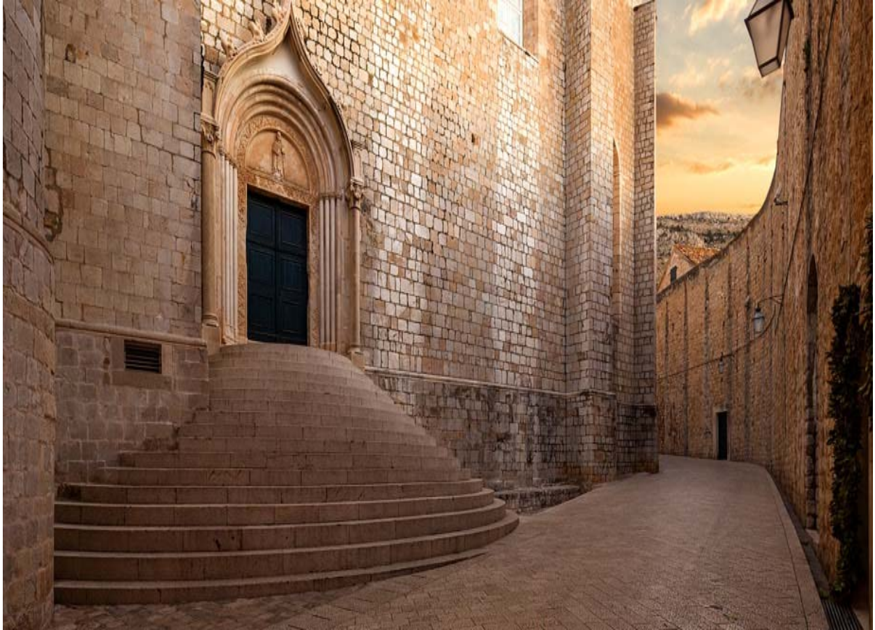
Slika 8. Ulica sv. Dominika lokacija poslužila za snimanje scene ubojstva nezakonitih sinova kralja Roberta i hod srama Cersei Lannister.