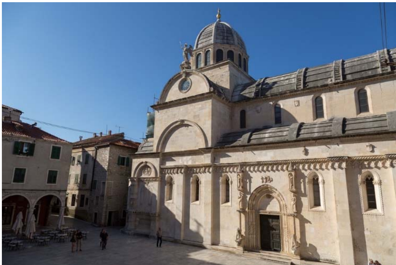
Slika 12. Šibenik - Luka grada Bravoosa