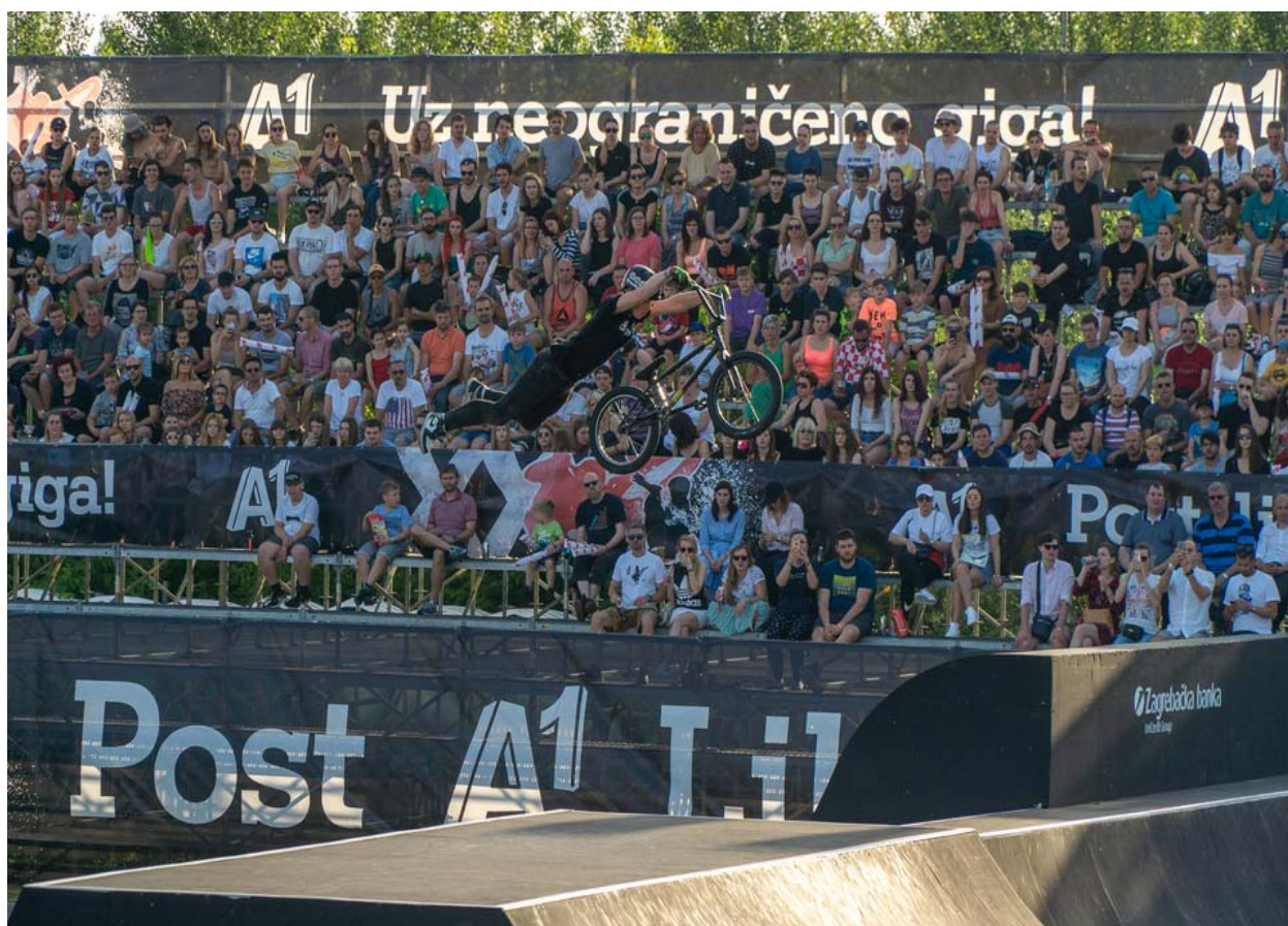
Slika 17. Pannonian Challenge