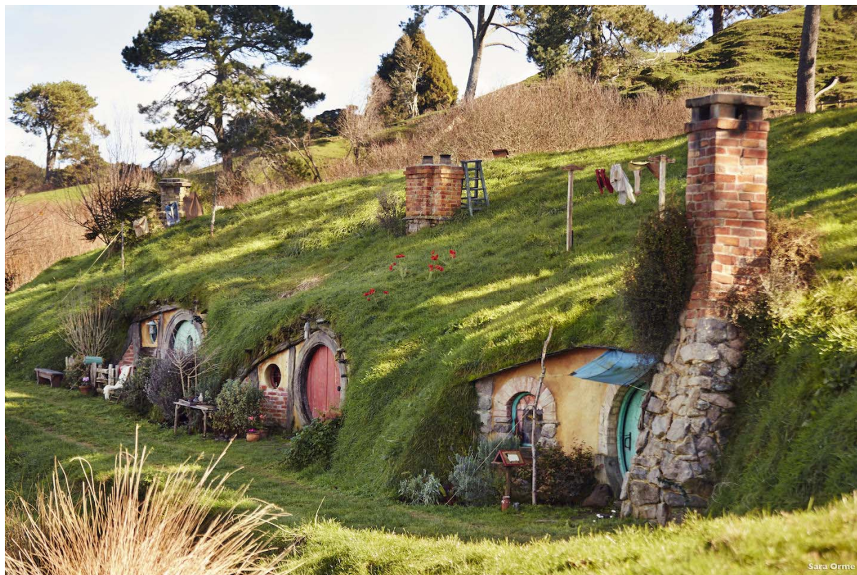
Slika 1. The Shire and Hobbiton selo u kojem žive Hobbiti

Matamata mjesto na kojem je smješten The Shire i Hobbiton je doslovno napravljeno za potrebe seta i ostat će trajna atrakcija. Ova slika prikazuje Shire selo u kojem žive Hobbiti, a nastalo je za potrebe snimanja trilogije.