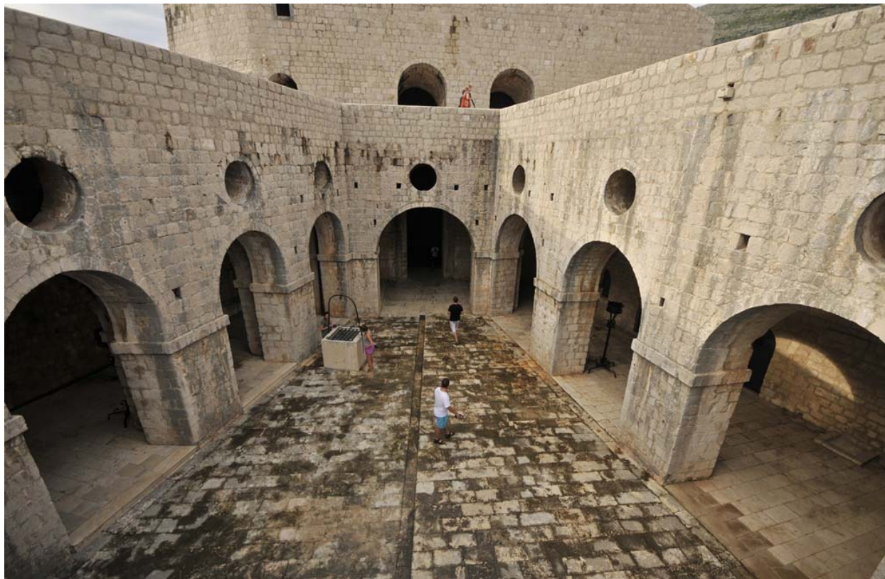
Slika 7. Kings Landing & Red Keep

Tvrđava Lovrijenac na filmskom setu je utjelovila King's Landing ili Kraljev Grudobran