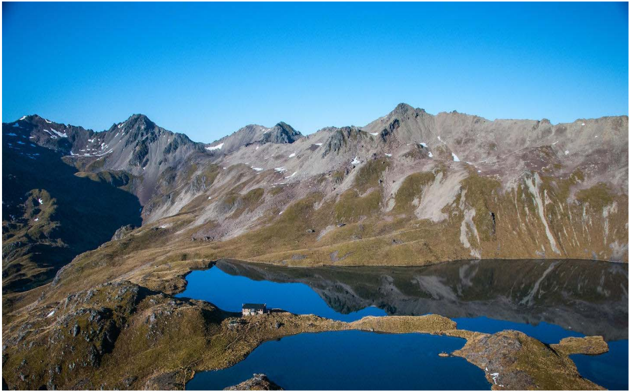
Slika 3. Nelson Tasman

Nelson Tasman je dio Nelson Lakes nacionalnog parka koji je ljubiteljima filma poznat kao mjesto istočni Bree kroz koje je Strider vodio hobite kako bi pobjegli od Crnih jahača.