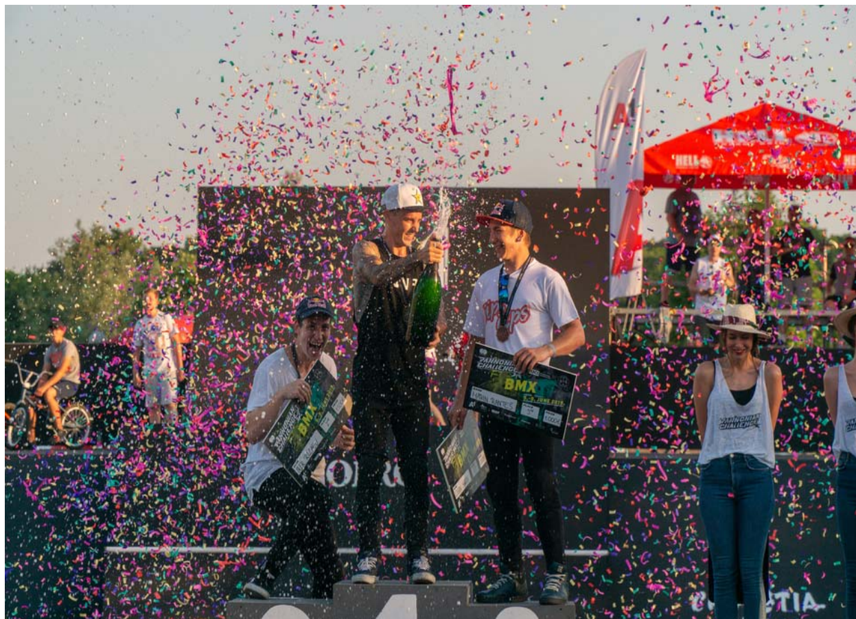
Slika 18. Proglašenje pobjednika u BMX disciplini muškarci

Na slici u nastavku vidi se dio ceremonije svečanog proglašenja najboljih natjecatelja za 2019. godinu u disciplini BMX.