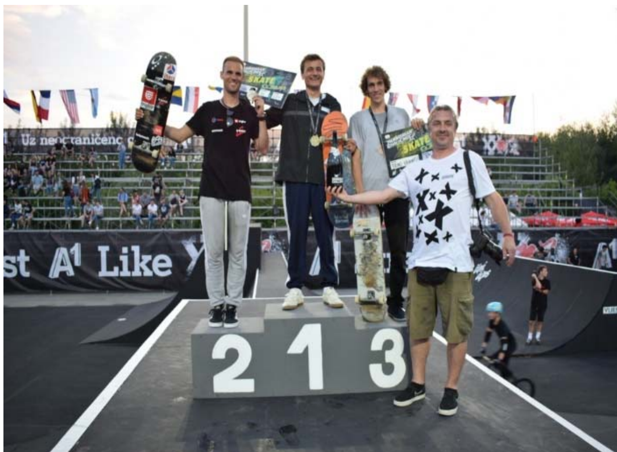
Slika 20. Proglašenje pobjednika u disciplini skate

Na slici ispod vidi se ceremonija svečanog proglašenja najboljih natjecatelja u 2019. godini u kategoriji skate.