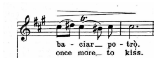
Primjer br. 2: oznaka za triler iznad note cis2

Fraze se moraju pjevati legato i „podržano“, tekst treba biti jasno izgovoren, a ataka tona mekana kako bi se zapjevi „odozgo“ što bolje pripremili i izveli. Dinamičke oznake moraju se poštivati kako bi se bolje prikazao karakter skladbe. Skladba ima i kratki B dio u kojem pjevač mora izmijeniti karakter iz veselog u nešto ozbiljniji zbog teksta koji u prijevodu glasi: „Bit ću zadovoljan, u svojoj mucu, kad bih samo mogao poljubiti te usne.“ Pjevač treba sukladno tekstu promijeniti emociju. Na odabranim riječima upisani su trileri 6 , a kako navodi Lhotka-Kalinski (1975:64): „Pjevački triler ostvaruje se samo kao pokret potresanja larinksa ili kao «trilerni udar», tj. brzo ponavljanje istog tona.“