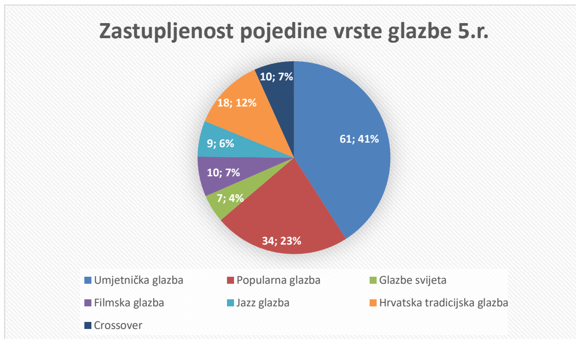
Grafikon 1: Zastupljenost pojedine vrste glazbe u udžbeniku Glazbeni krug 5

Analizom udžbenika Glazbeni krug 5 popisano je 149 različitih glazbenih primjera koji pripadaju različitim vrstama glazbe. Gotovo svi glazbeni primjeri dostupni su putem audio i videozapisa. Svega pet primjera dostupno je samo putem audiozapisa, a jedan putem videozapisa. Navedeno je pohvalno jer su današnja djeca vizualni tipovi zbog medijskog okruženja (računala, mobilni uređaji, tableti i dr.), a videozapisi su zbog toga važni za usmjeravanje pažnje učenika i ostvarivanje aktivnog slušanja glazbe. Što se tiče vrste glazbe, najzastupljenija je umjetnička glazba kod koje nalazimo 61 glazbeni primjer, odnosno zastupljena je 41 %. Iduća po zastupljenosti je popularna glazba s 34 glazbena primjera, što čini 23 %. Nešto u manjim postotcima su hrvatska tradicijska glazba kod koje smo pronašli 18 glazbenih primjera, što čini 12 % zastupljenosti. Podjednaku zastupljenost od 7 %, odnosno po deset glazbenih primjera imaju filmska glazba i crossover. Jazz glazba s devet glazbenih primjera zastupljena je 6 %. Najmanju zastupljenost od svega 4 % imaju glazbe svijeta sa sedam glazbenih primjera (Grafikon 1).