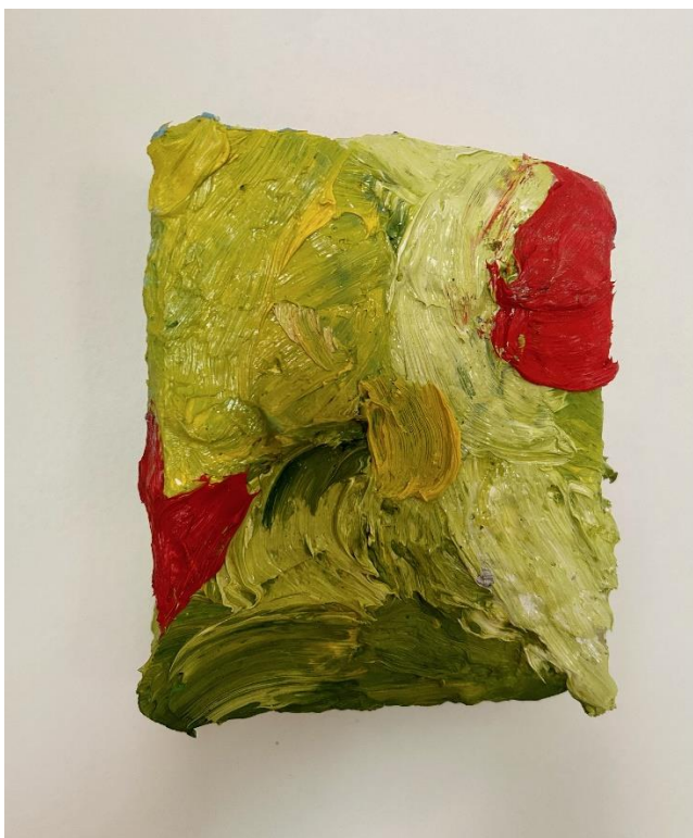
Slika 8. Bez naziva , izvor: autorica, 2024.g.