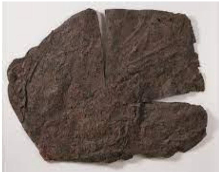
Slika 10. Ivo Gattin, Crvena površina s dvije usjekotine , 1961. g.

Poticaj za svoj rad crpila sam iz različitih izvora, a ponajviše iz apstraktnog i gestualnog slikarstva. Gestualno slikarstvo najviše me privuklo zbog izrazite materičnosti i spontanosti u kojoj se vidi umjetnikov užitek i zadovoljstvo stvaranja. Takvom slikarstvu težio je poznati hrvatski slikar Ivo Gattin. Njegova djela razlikuju se po strukturalnim vrijednostima jer djela konkretno nemaju određena značenja već je naglasak upravo na materiji. Gattin je za izradu takve vrste djela koristio različite teksture i materijale, a često su to bili prirodni i otpadni materijali. J. Denegri (2016:235-236) opisuje kako je Gattin u radovima upotrebljavao materijale poput voska, lima i pijeska. Također sjedinio bi pigmente i smole nanesene na grubo platno koje bi nakon toga polijevao benzinom i palio, a to sve je izrađivao na tlu na otvorenom prostoru kako bi izbjegao potencijalne opasnosti od požara. Čin takvog djelovanja na sliku uključuje unutarnje stanje autora koje se iskazuje pokretima cijelog njegovog tijela. Sagledavajući takvu vrstu ekspresivnog izražavanja može se reći kako Gattin u potpunosti izražava umjetničku slobodu kako materijalima tako i svojim fizičkim djelovanjem na sliku. Odbacivanjem klasične forme dobivaju se kompleksna umjetnička djela poput djela Crvena površina s dvije usjekotine iz 1961. godine.