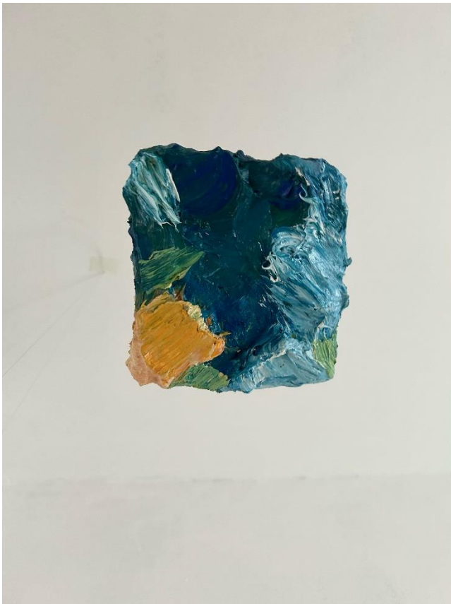
Slika 7. Bez naziva , izvor: autorica, 2024.g.