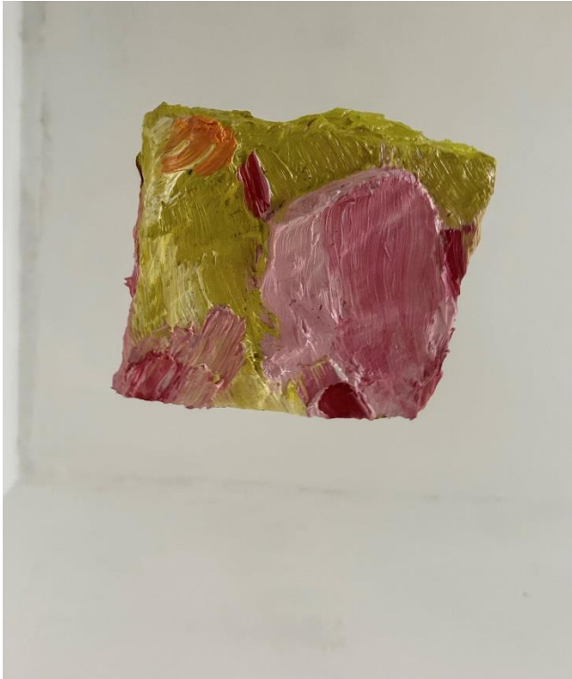
Slika 6. Bez naziva