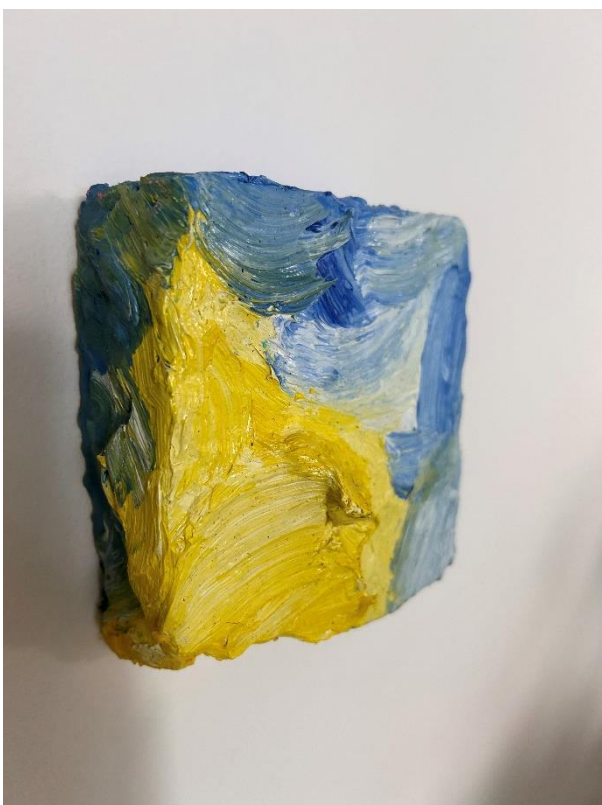
Slika 3. Bez naziva