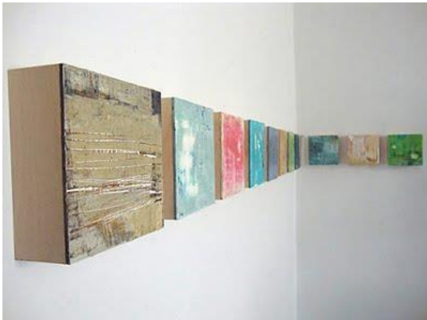
Slika 16. Elizabeth Shepell, Prikaz instalacije , 2011. g.