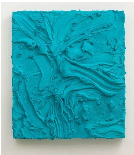
Slika 11. Jason Martin, Eter , 2011. g.