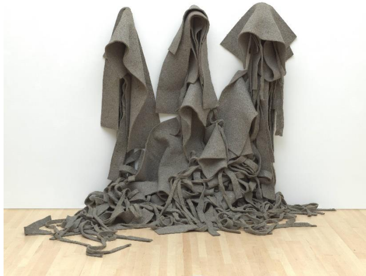
Slika 14. Robert Morris, Bez naziva , 1967. g.

Djela umjetnice Elizabeth Shepell također su me potaknula na promišljanje percepcije pomoću različitih formi i oblika. Njezino stvaralaštvo istaknuto je teksturom i slojevitosti, a svoje radove opisuje kao način na koji odbacuje sliku prema rubovima. Manje forme prvobitno izrađuje od gipsa, zatim s akrilom stvara slojeve boje, a njezine slike postaju objektima. Njezina djela pomalo podsjećaju na Martina, jer se vide potezi i duboki slojevi boje na rubovima. Promatrajući takva djela na mene je ostavljen dojam potpune fluidnosti i spontanosti, dakle ne postoje granice, već je sve povezano s prostorom i okolinom u kojoj se takva djela nalaze.