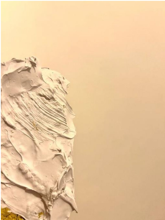
Slika 1. Teksturna forma u procesu

neizostavni dio čovjekova iskustva i postojanja. Kombinirani potezi grade teksturu samog djela jer ona pruža taktilni osjećaj pogledu, a to se može povezati s citatom: „Čak i oko dodiruje; pogled podrazumijeva nesvjestan dodir; tjelesno oponašanje i poistovjećivanje.“ (J. Pallasmaa, 1996:634). Cjelina forme malih formata otkriva jedinstvene oblike, forme, strukture i boje koje funkcioniraju kao zaseban rad. Forma u ovome radu ima veliki utjecaj na percepciju i interpretaciju jer utječe na način na koji primamo i razumijemo informacije koje dolaze putem naših osjetila, a konstruktivan dio takve percepcije upravo su slike koje se stapaju s prostorom.