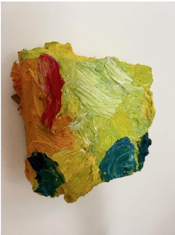
Slika 5. Bez naziva , izvor: autorica, 2024.g.