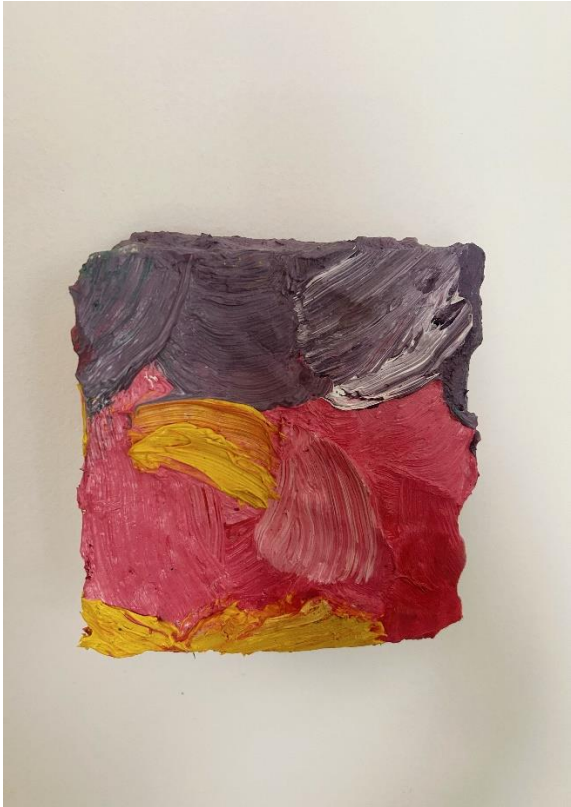
Slika 4. Bez naziva , izvor: autorica, 2024.g.