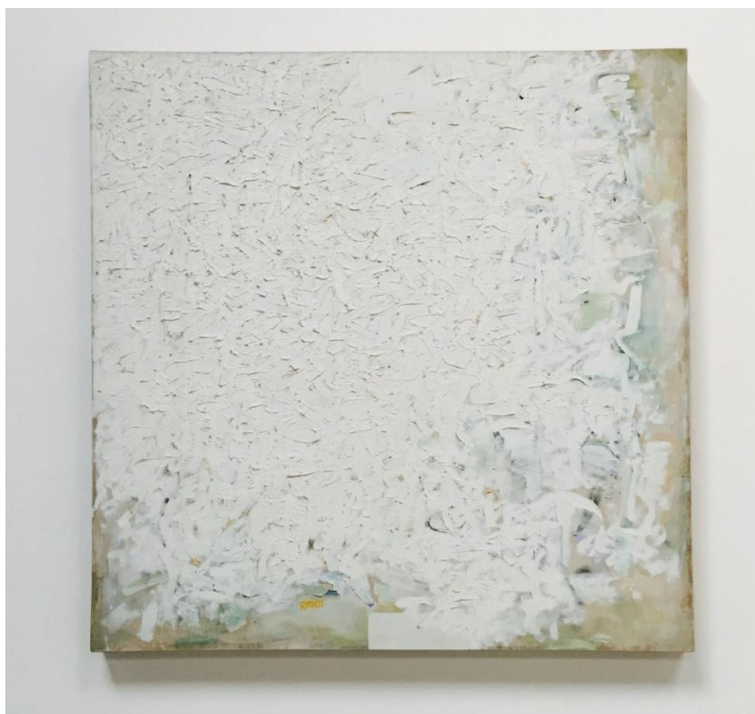
Slika 13. Robert Rauschenberg. Bez naziva , 1960. g.

Jasonova djela svojom teksturom prizivaju skulpture Roberta Morrisa koji je bio američki kipar te jedan od najutjecajnijih umjetnika u poslijeratnoj američkoj umjetnosti. Robert Morris u svojim djelima ipak nije koristio tradicionalne kiparske materijale, već žičane mreže i filc koji graniče između forme i antiforme. Svoje minimalističke radove izrađivao je od filca na način da bi ih vješao na zid u različitim slojevima, formama i kompozicijama, a gravitacija je ta koja je određivala kakav će konačni oblik dostići rad. Morris je upravo u svojim radovima istraživao percepciju objekata te na koji način gledatelji raspravljaju i doživljavaju prostor u kojem se nalaze njegova djela. Cjelokupni opus njegovih djela pokušava stvoriti kompleksni, paradoksalni prostor kojeg gledatelji doživljavaju svojim iskustvom i percepcijom koje se danas teško mogu nadmašiti.