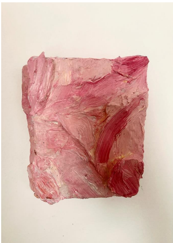
Slika 9. Bez naziva , izvor: autorica, 2024.