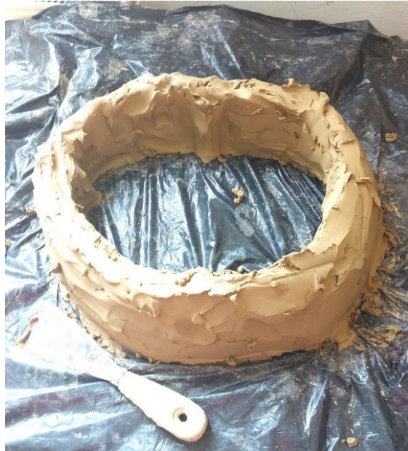
Slika 29. Donji dio skulpture

Nadodavanjem gline dobivamo formu, zatvoreni volumen skulpture, koji ostavlja dojam punine, odnosno kompaktni oblik. Površina skulpture je neravna i hrapava, čime je stvorena razigrana tekstura (Slika 30.).