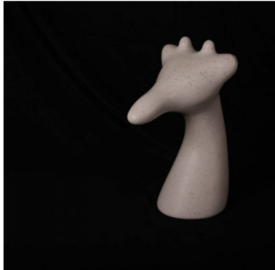
Slika 23. Emil Trutanić, Žirafa, 2013., kamen

Emil Trutanić još je jedan primjer hrvatskog umjetnika koji u svojim djelima tematizira životinje. Njegove skulpture izrađene su od prirodnih materijala, uglavnom bračkog kamena. Prema riječima profesorice Barbare Gaj njegova djela „iako poprilično stiliziranih i apstraktnih formi, sadrže prepoznatljive vizualne strukture određenih životinja koje predstavljaju“. (Gaj, 2013), (Slika 23.)