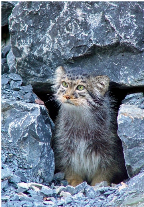
Slika 25. Pallas mačka u svojoj jazbini

Pallasove mačke nisu umiljate domaće životinje za koje su njihovi vlasnici emocionalno vezani. Istražuje ih se i piše o njima, iako žive u stepama i planinama srednje Azije, u kamenitim pustinjama i polupustinjama. Da bi se sakrile od ptica grabežljivica i vremenskih uvjeta služe se napuštenim jazbinama svizaca i drugim pukotinama ili rupama u zemlji (Slike 25. i 26.).