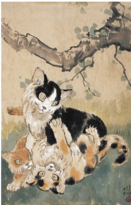
Slika 10. Xu Beihonga, Tri mačke, 1944., tuš, 53x34 cm

mačke može biti prikazana na više načina. Mačke se smatraju nepredvidljivima što se često interpretira kao simbol senzualnosti i zavođenja. U rano kršćanskoj umjetnosti smatrali su ih simbolom požude i izdaje, a mačke koje su prikazane kako vrebaju svoj plijen su tumačene kao nesiguran lov ili kao karakter smrti. (Koblar, 2022) U drevnoj Kini, mačke su bile voljena stvorenja što nam dokazuju i radovi kineskog umjetnika Xu Beihonga koji je radio radove mačaka u tehnici tuša (Slika 10.) Isto se može vidjeti i na primjeru pod nazivom Crna mačka i narcis kineskog slikara Zhu Linga (Slika 11.). Značajan primjer su i crteži Mačke, lavovi i zmaj, Leonarda Da Vincija koji se sastojao od preko 20 skica lavova i mačaka (Slika 12.).