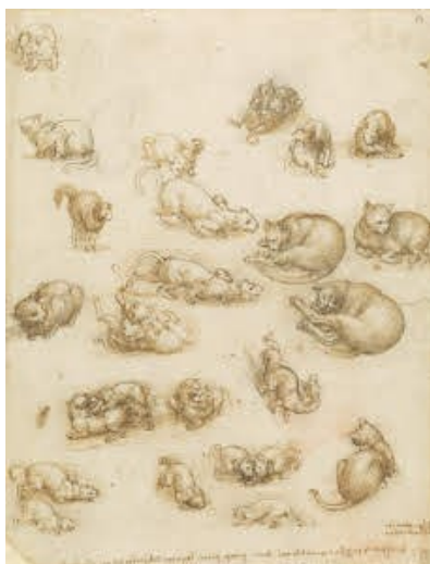
Slika 12. Leonardo da Vinci, Mačke, lavovi i zmaj, 1517-1518., crna kreda, tuš, 27x21 cm

S vremenom je umjetnost koja kao glavni motiv prikazuje mačku postala jedna od najpopularnijih tema u umjetnosti zahvaljujući emocionalnoj povezanosti ljudi i mačaka. Ljudi su mačke poimali od simbola štovanja do umiljatog kućnog ljubimca, a to su umjetnici i uspjevali kroz povijest interpretirati na vjeran način. Dakle, umjetnost koja prikazuje mačke ima dugu povijest. U dalekoj prošlosti slike mačaka koje su tada nastale imale su duhovno značenje, dok je u današnje vrijeme još širi raspon poruka kojima se prikazuje motiv mačke. Mačke se koriste za predstavljanje niza emocija i ideja. Tako se za japansku figuricu mačke Maneki-neko (Slika 13.) vjeruje da donosi sreću te je zbog toga postala kulturni simbol. Japanski umjetnik Utagawa Hiroshige prikazuje Maneki-neko u svom radu Likovi iz drama kao trgovci i kupci (Slika 14.).