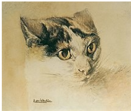
Slika 18. Luis William Wain, Realno nacrtana mačka, 1886., drvene boje, 33.8x28.5cm

Animalisti su likovni umjetnici koji u svojim radovima kao motiv pretežito prikazuju životinje. Sa sigurnošću se može reći da je gotovo svaki umjetnik barem jednom u svojim radovima izradio životinju. U popularnoj kulturi vjerojatno najprepoznatljiviji umjetnik koji je prikazivao mačke je engleski umjetnik Louis William Wain koji je popularnost stekao zbog svojih crteža mačaka koje igraju golf, piju čaj ili su prikazane u nekim drugim radnjama specifičnim za ljude pri kojima se mogu očitati i neke ljudske osobine. Pisac H. G. Wells napisao je da je Wain izumio mačji stil, mačje društvo, cijeli mačji svijet te da se engleske mačke koje ne izgledaju i ne žive kao mačke Louisa Waina srame same sebe. (Stokes, 2021) Njegova djela postajala su slavna preko noći jer nisu prikazivala samo mačke nego i ljudske osobine mačaka. Na slikama 18. i 19. možemo vidjeti Wainova djela s početka i kraja njegove karijere.