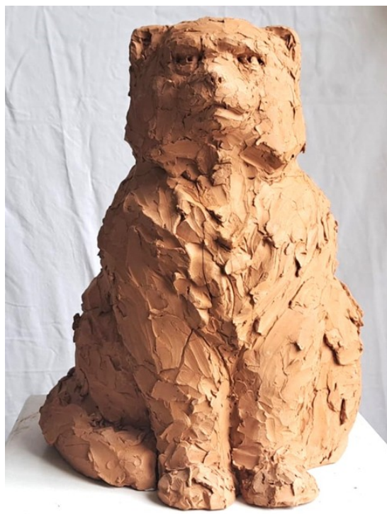
Slika 33. Druga mačka iz serije radova, 2024., 35x37x50 cm