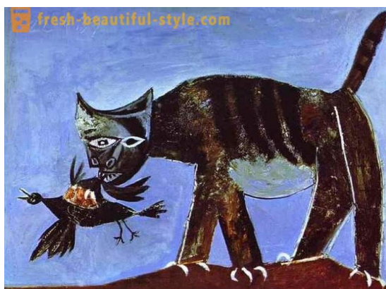
Slika 8. Pablo Picasso, Mačka lovi pticu, 1938., ulje na platnu, 81x100 cm

U razdoblju renesanse životinje su obrađivane na način da su u svom prikazu vjerno opisivale njihov realističan izgled. Za vrijeme baroka skulpture životinja postale su sve ekspresivnije i dinamičnije te su se u obradi koristili energičniji pokreti s puno više detalja kako bi se što vjernije prikazao stvaran izgled i karakter životinje. Često su bile prikazane u snažnim i dramatičnim pozama kako bi prikazale dramatičnost baroka. S razvojem modernizma u 19. i 20. stoljeću otkrivene su nove tehnike i stilovi, poput kubizma i apstrakcije (Slike 8. i 9.), gdje se životinjski motivi koriste kao način novog izražavanja. Ova tradicija se nastavlja i danas gdje umjetnici motive životinja koriste za izražavanje socijalnih, ekoloških i političkih tema. (Perić, 2023)