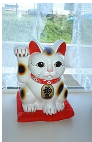
Slika 13. Figurica Maneki-neko, 17 st., porculan

S vremenom je umjetnost koja kao glavni motiv prikazuje mačku postala jedna od najpopularnijih tema u umjetnosti zahvaljujući emocionalnoj povezanosti ljudi i mačaka. Ljudi su mačke poimali od simbola štovanja do umiljatog kućnog ljubimca, a to su umjetnici i uspjevali kroz povijest interpretirati na vjeran način. Dakle, umjetnost koja prikazuje mačke ima dugu povijest. U dalekoj prošlosti slike mačaka koje su tada nastale imale su duhovno značenje, dok je u današnje vrijeme još širi raspon poruka kojima se prikazuje motiv mačke. Mačke se koriste za predstavljanje niza emocija i ideja. Tako se za japansku figuricu mačke Maneki-neko (Slika 13.) vjeruje da donosi sreću te je zbog toga postala kulturni simbol. Japanski umjetnik Utagawa Hiroshige prikazuje Maneki-neko u svom radu Likovi iz drama kao trgovci i kupci (Slika 14.).