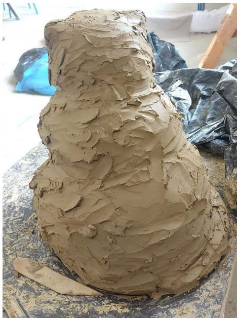
Slika 30. Zatvorena skulptura

Nadodavanjem gline dobivamo formu, zatvoreni volumen skulpture, koji ostavlja dojam punine, odnosno kompaktni oblik. Površina skulpture je neravna i hrapava, čime je stvorena razigrana tekstura (Slika 30.).