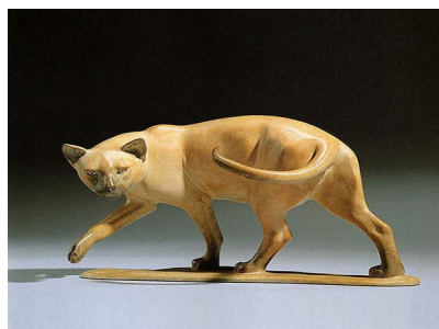
Slika 17. Gill Parker, Veslačka mačka, 2022., bronca, 17.8.x30 cm