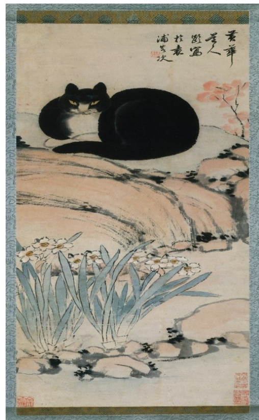
Slika 11. Zhu Ling, Crna mačka i narcis, tuš, 93.7 x36.8 cm