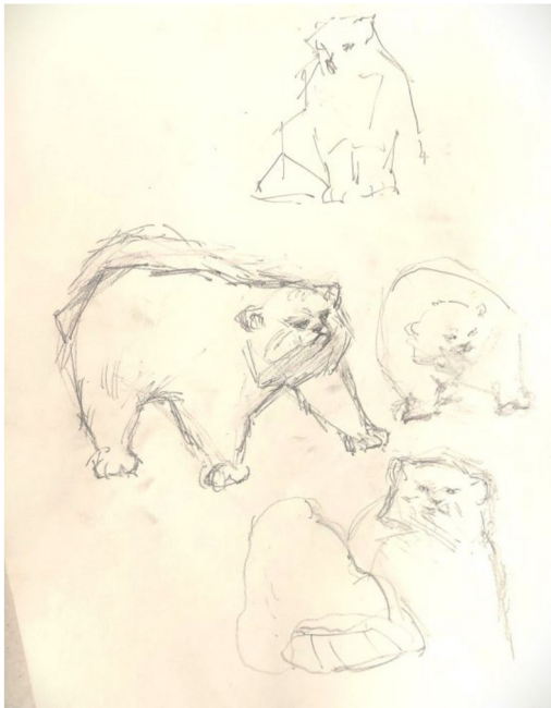
Slika 27. Skica za rad

Završni rad Pallas mačke je serija skulptura koju čine tri skulpture mačke izrađene u terakoti. Prvo su napravljene skice po kojima se modelirao rad (Slike 27. i 28.).