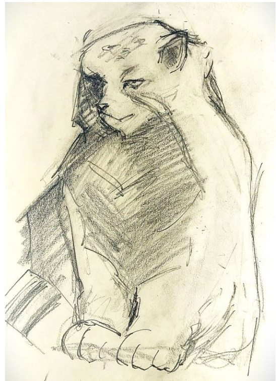
Slika 28. Skica za rad

Za izradu rada korištena je glina koja se koristi za izradu skulptura koje se pale u keramičkoj peći. Zbog specifičnosti tehnike i odabira materijala, skulpture su šuplje iznutra i izrađene tako da im je na svim dijelovima jednaka debljina stjenke. Odabran je postupak izrade skulpture građenjem stjenki, a takav način modeliranja najčešće se koristi u lončarskom pristupu oblikovanja forme koje se izrađuju šuplje. Za početak je izrađen donji dio skulpture na koji se dodavanjem nastavila graditi forma skulpture prema gore, ostavljajući unutrašnjost skulpture šupljom, pazeći pri tome na jednaku debljinu stjenki (Slika 29.). Ovakav način izrade skulpture dozvoljava da se realizira rad velikog formata zbog toga što se prilikom izrade donji dijelovi skulpture suše te na taj način stvaraju stabilnost koja nam dozvoljava da izgradimo rad u visinu.