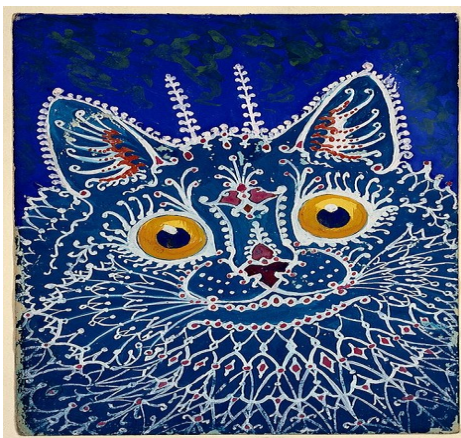
Slika 19. Luis William Wain, Mačka u gotičkom stilu, 1925.-39., gouache, 18.5x12.2 cm