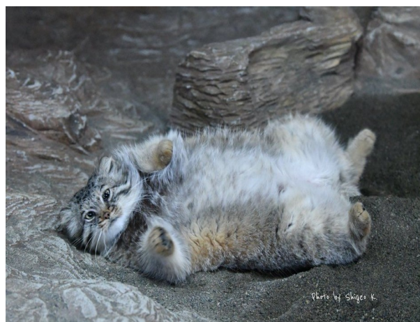
Slika 26. Ležeća Pallas mačka