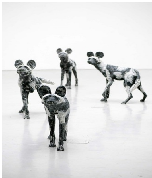
Slika 22. Vlatka Škoro, Čopor, 2020., poliester, 4x(60x30x90) cm

Hrvatska umjetnica Vlatka Škoro navodi da su joj životinje neiscrpan izvor inspiracije. U svom opusu ima velik broj skulptura životinja, no ne preferira da ju se klasificira kao animalistkinju. Kiparstvo joj je način života koji joj omogućava da se preispita, izrazi i igra što se može vidjeti u njezinim djelima poput rada pod nazivom Čopor. U izložbeni prostor postavlja deset skulptura afričkog divljeg psa, skulpture koje su izrađene od poliestera. (Bokor, 2020), (Slika 22.)