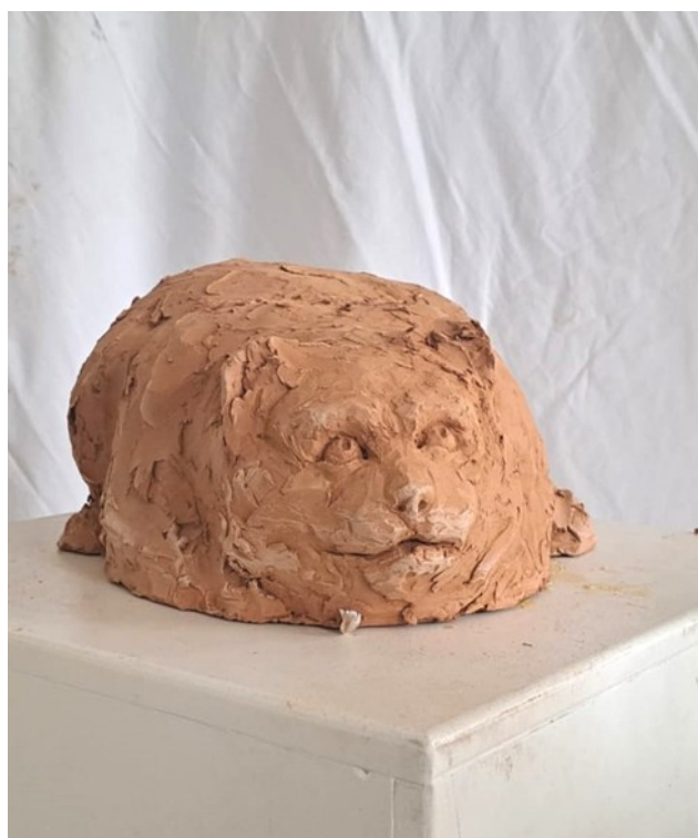
Slika 34. Treća mačka iz serije radova, 2024., 30x45x35 cm