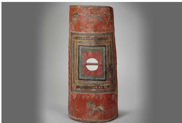
Slika 7. Rimski štit, Skutum, 4 st. pr. Kr., drvo, 107x84 cm

U razdoblju renesanse životinje su obrađivane na način da su u svom prikazu vjerno opisivale njihov realističan izgled. Za vrijeme baroka skulpture životinja postale su sve ekspresivnije i dinamičnije te su se u obradi koristili energičniji pokreti s puno više detalja kako bi se što vjernije prikazao stvaran izgled i karakter životinje. Često su bile prikazane u snažnim i dramatičnim pozama kako bi prikazale dramatičnost baroka. S razvojem modernizma u 19. i 20. stoljeću otkrivene su nove tehnike i stilovi, poput kubizma i apstrakcije (Slike 8. i 9.), gdje se životinjski motivi koriste kao način novog izražavanja. Ova tradicija se nastavlja i danas gdje umjetnici motive životinja koriste za izražavanje socijalnih, ekoloških i političkih tema. (Perić, 2023)