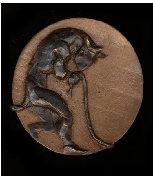
Slika 6. Sophie Dickens, Minotaur medalja, 2013., bronca, Ø10 cm

Rimsko doba obilježeno je likovima mačaka na štitovima rimskih vojnika čija simbolika je bila pobjeda, ljepota i sloboda (Slika 7.). U rimskoj književnosti su se štovale mačke koje se pronalaze u djelima pjesnika Vergilija i Publija Ovidija Nazona, „Metamorfoze“. (Saičić, 2021)