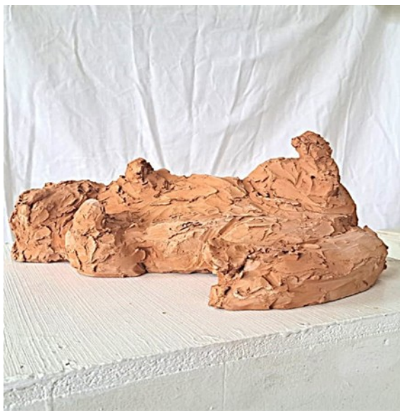
Slika 32. Prva mačka iz serije radova, 2024., 20x45x27 cm