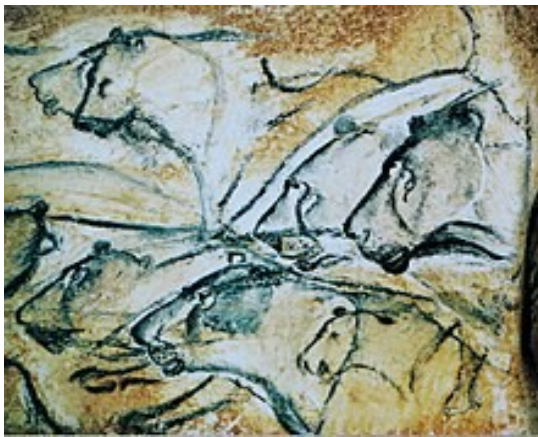
Slika 1. Prikaz lavova, Chauvet, Francuska, 15 000 pr. Kr.

„Prapovijesne špiljske slikarije lijepe su koliko i tajnovite. Nitko ne može pouzdano reći čemu su služile, no pružaju nam neodoljive zapise najranijih dana čovjekovog postojanja i uvid u prva zbivanja u umjetnosti“. (Škec, 2008) Najstariji primjeri prapovijesne umjetnosti s motivima životinja potječu iz paleolitika, a najznačajniji radovi europskog špiljskog slikarstva nastali su u špiljama jugozapadne Francuske (Slika 1.) i špiljama sjeverne Španjolske (Slika 2.).