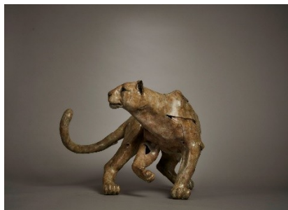
Slika 16. Fred Gordon, Leopard, 2022., bronca, 35x56x55 cm