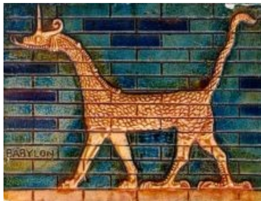
Slika 3. Mušhušu, Ištara vrata, 6. st. pr. Kr., reljef

Životinjski motivi bili su prisutni u umjetnosti i za vrijeme drevnih civilizacija poput Egipta, Grčke, Rima, Babilona i drugih civilizacija. Najpoznatija dijela Babilonske kulture su životinjski reljefi koji su izrađivani na opekama, jedan od njih je i Mušhušu (čudovište u liku lava, ptice i zmije) koji krase Ištara vrata na ulazu u Babilon (Slika 3.)