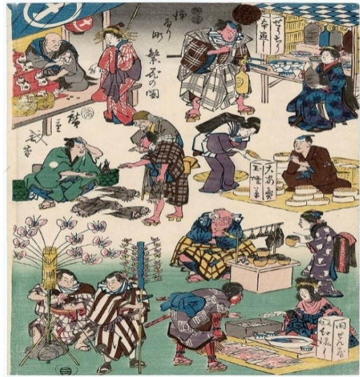
Slika 14. Utagawa Hiroshige, Likovi iz predstave kao trgovci i kupci, 1852., drvorez (nishiki-e); tinta i boja na papiru, 15.8x15 cm