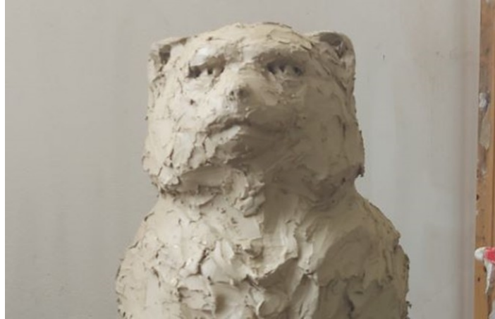
Slika 31. Glava skulpture

Za konačni izgled skulpture više pažnje je usmjereno na detalje, a najviše vremena bilo je potrebno za obradu i modeliranje glave. (Slika 31.).