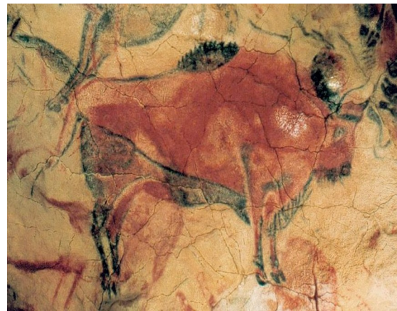
Slika 2. Bik, Altamira, Španjolska 30 000 pr. Kr.

Životinjski motivi bili su prisutni u umjetnosti i za vrijeme drevnih civilizacija poput Egipta, Grčke, Rima, Babilona i drugih civilizacija. Najpoznatija dijela Babilonske kulture su životinjski reljefi koji su izrađivani na opekama, jedan od njih je i Mušhušu (čudovište u liku lava, ptice i zmije) koji krase Ištara vrata na ulazu u Babilon (Slika 3.)