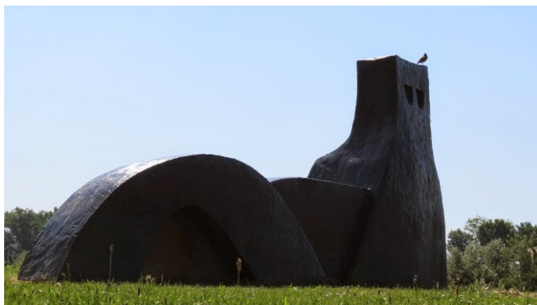
Slika 24. Branko Ružić, Mačka na savskom nasipu, 2001., bronca, 6.4x1.92x4.24 m

Jednostavnost kiparskog jezika i preobrazba tradicionalne forme su elementi koji predstavljaju radove Branka Ružića. Sažetom formom i minimumom oblikovanja ostvario je čitavi opus svojih umjetničkih djela. Jedno od njih je i skulptura mačke na savskom nasipu koja pripada Aleji skulptura. (Tekić, 2009), (Slika 24.)