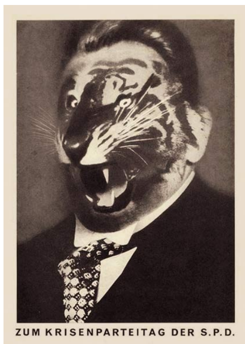
Slika 9. John Heartfield, Povodom kriznog kongresa SPD-a, 1931., foto montaža, 38x27 cm