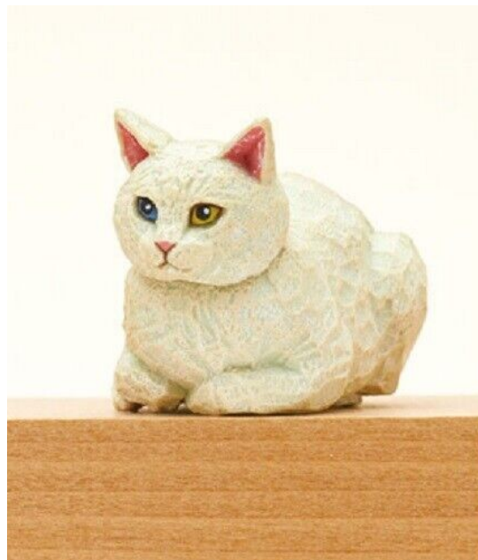
Slika 21. Mio Hashimoto, Skulpture mačaka u prirodnoj veličini, 2018., drvo

Hrvatska umjetnica Vlatka Škoro navodi da su joj životinje neiscrpan izvor inspiracije. U svom opusu ima velik broj skulptura životinja, no ne preferira da ju se klasificira kao animalistkinju. Kiparstvo joj je način života koji joj omogućava da se preispita, izrazi i igra što se može vidjeti u njezinim djelima poput rada pod nazivom Čopor. U izložbeni prostor postavlja deset skulptura afričkog divljeg psa, skulpture koje su izrađene od poliestera. (Bokor, 2020), (Slika 22.)