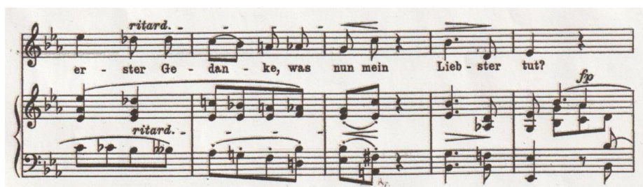
Primjer br. 7

Tek u drugoj strofi dolazi do male, ali uočljive promjene karaktera pojavom mola i silaznom melodijskom linijom do tona b , nakon čega slijedi ponavljanje prve strofe s nekoliko promjena u drugoj frazi; skok od velike sekste sada se pretvara u čistu oktavu te se ponavlja, a u repeticiji dolazi do ritardanda i kromatskih detalja koji prethode povratku u Es-dur (Primjer br. 7).