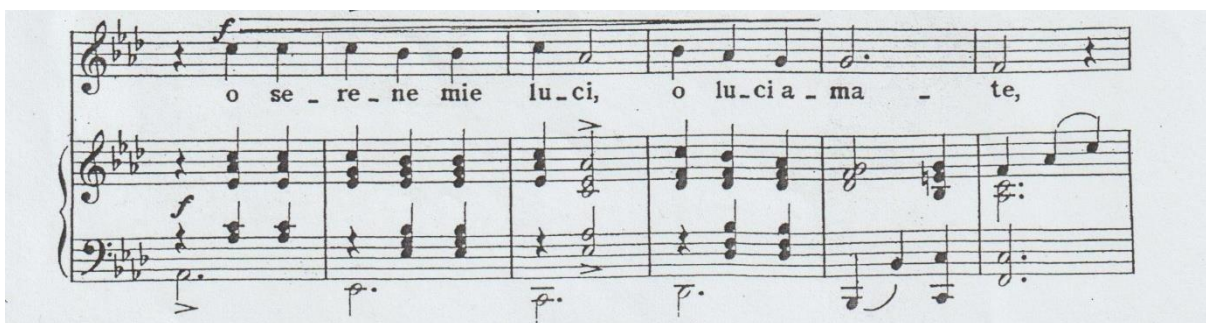
Primjer br. 1

Skladba O leggiadri occhi belli strofnog je oblika, a sastoji se od dva dijela – A i B. Pisana je u As-duru s modulacijama u paralelni fis-mol. Mjera je 3/4, tempo je umjeren s oznakom con spirito , što implicira na poletno i duhovno izvođenje. Pjevnu dionicu ne donosi poseban instrumentalni uvod, no u svakoj glazbenoj rečenici na prvoj dobi instrument samostalno iznosi harmoniju, što zajedno sa šesterotaktnom strukturom u skladbi naglašava trodobni impuls (Primjer br. 1).