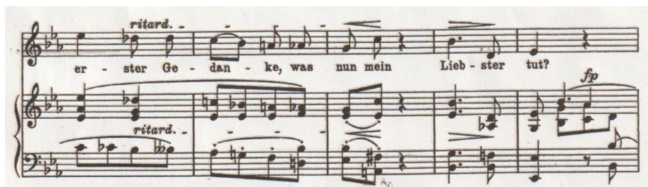
Primjer br. 7

Tek u drugoj strofi dolazi do male, ali uočljive promjene karaktera pojavom mola i silaznom melodijskom linijom do tona b , nakon čega slijedi ponavljanje prve strofe s nekoliko promjena u drugoj frazi; skok od velike sekste sada se pretvara u čistu oktavu te se ponavlja, a u repeticiji dolazi do ritardanda i kromatskih detalja koji prethode povratku u Es-dur (Primjer br. 7).