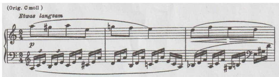
Primjer br. 3

Fraze u ovoj skladbi možemo promatrati formama glazbenih perioda (od 8 taktova), čije glazbene rečenice (od 4 takta) traže svoju zaokruženost. Prva glazbena perioda, pogotovo ako uzmemo narativni karakter teksta, zahtijeva da se tonovi pjevaju velikim legatom . Zbog etwas langsam (pomalo brzo) oznake tempa, u kombinaciji s delikatnom interpretacijom teksta, izazov je pjevaču zadržati preciznost pojedinačnog tona. Također, pri završetku treće glazbene periode dolazi do značajne promjene glasovnog registra, pri čemu se pjevač na početku postepeno spušta sve do tona a u maloj oktavi, nakon čega slijedi skok do a1 te vođenje melodijske linije do e2 (Primjer br. 4).