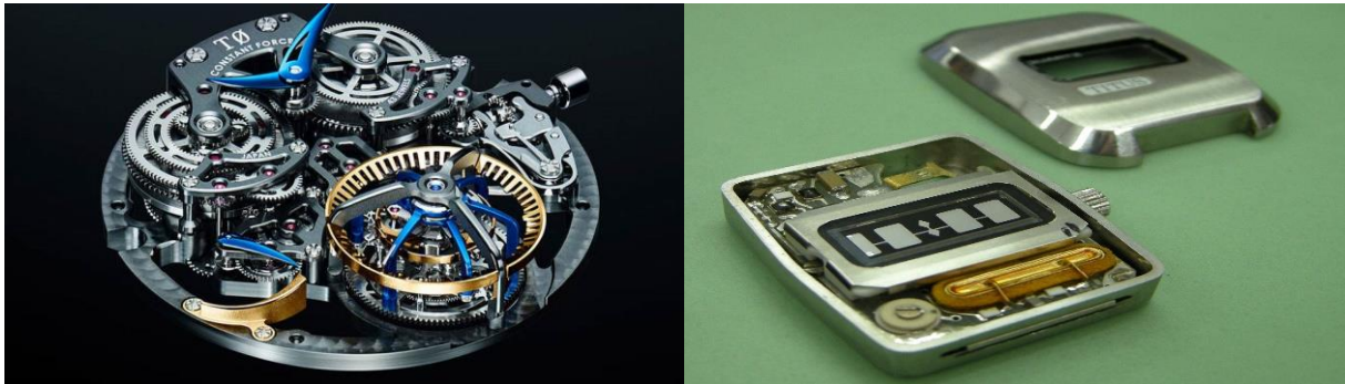
Slika 1 – Razlika između radnih jedinica analognog i digitalnog sata (Watch-a-porter, 2022) (Pinterest, 2016)

Na Slici 1. možemo vidjeti kako izgleda mehanizam unutar analognog sata koji šalje fizičke podražaje kako bi se dobio željan ishod, dok je nasuprot prikazana tvrda jedinica digitalnog sata koji radi isključivo na brojevima.