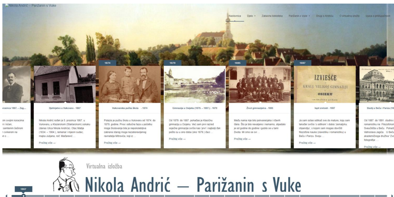
Slika 6 – Digitalna zbirka Gradske knjižnice Vukovar – Nikola Andrić – Parižanin s Vuke(NSK, 2024)

Na Slici 6 možemo vidjeti Digitalni zbirku Nikola Andrić – Parižanin s Vuke na kojoj je prikazano sučelje te sadržaj zbirke.