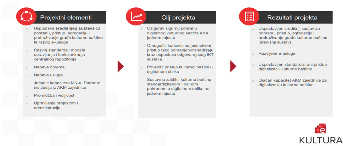
Slika 2 – Opseg projekta e-kultura u sažetku projekta „e-kultura – Digitalizacija kulturne baštine” Ministarstva kulture (2016)

Prema sažetku projekta „e-kultura – Digitalizacija kulturne baštine” koje je objavilo Ministarstvo kulture (2016) vizija projekta je: