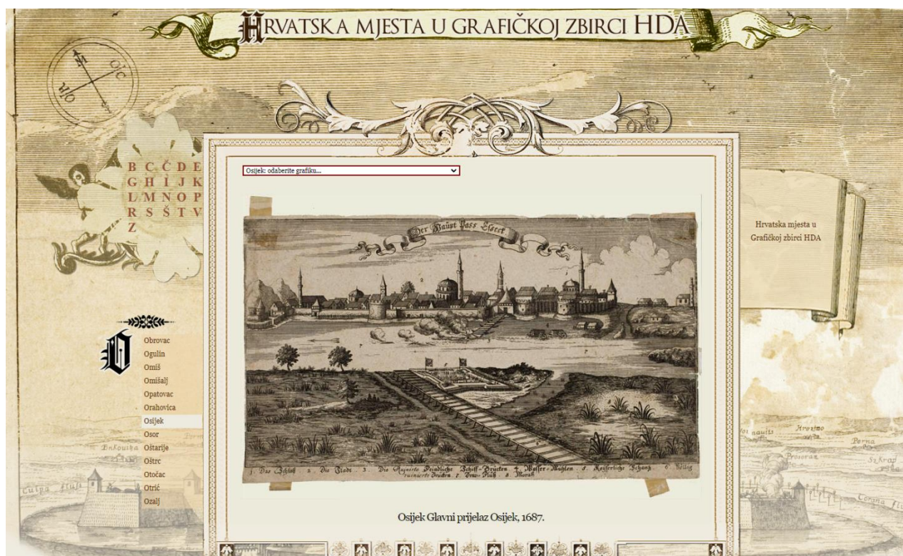
Slika 4 – Osijek Glavni prijelaz 1687, Hrvatska mjesta u grafičkoj zbirci HDA (ARHiNet, n. g.).

1. ARHiNET digitalni arhiv – ARHiNET digitalni arhiv podijeljen je u 11 tema : Hrvatska mjesta u Grafičkoj zbirci, Fotografijske slike iz Hrvatske, Dalmacije i Slavonije, Monumenta antiquissima, Album von Dalmatien, Arhivski vjesnik, Obrana sisačke gospoštije od Turaka, Zbirka fotografija Saler, Digitalna zbirka povelja, Radikalni arhiv, Zbirka grbovnica, Arhiv mapa za Dalmaciju i Istru. Odabirom na temu posjetitelja se vodi na stranicu kategorije na kojoj su zbirke, slike te predmeti podijeljeni po abecedi, tematski i sl. Na Slici 4 možemo vidjeti grafiku Osijeka iz 1687. dostupnoj u Grafičkoj zbirci Hrvatska mjesta Hrvatskog državnog arhiva.