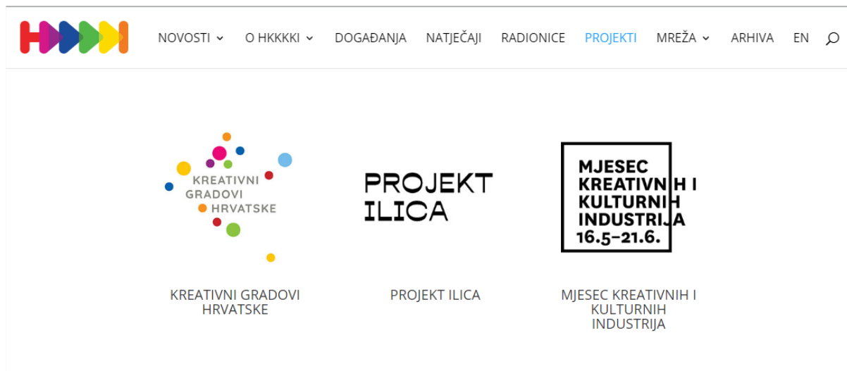
Slika 1: Projekti HKKKKI