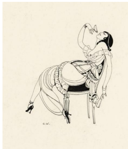
Slika 5. „Žena koja sjedi, posljednja kapljica“ (izvor: preuzeto u cijelosti. URL: https://www.swanngalleries.com/news/art-press-illustrated-books/2014/08/danish-girl-erotic-art-gerda-wegener/ pristup: 8. 8. 2023.)

U tom povijesnom razdoblju homoseksualnost i transrodnost kažnjavala se zatvorom, liječila se pod dijagnozom šizofrenije i u krajnjem slučaju smatrala se deluzijom i neuravnoteženim hormonima. Otvoreno gej muškarci nisu prihvaćeni u toj zajednici što je vidljivo u slučaju izopćenosti dva takva muškarca na balu, a postoje oni asimilirani poput Hernika koji prikrivaju svoje tendencije. Postoje situacije kada dolazi do fizičkog okršaja, poput scene gdje Einara napadaju dva homofobna građana u šetnji parkom. Ulla (Amber Heard) muškarce poput Einara opisuje kao „zbunjene“ i „drugačije“. Nije jasno kako se tretiraju lezbijke, no film otvara pitanje Gerde seksualnosti koja nikada nije potvrđena. Djela iz umjetničkog opusa prave Gerde Wagner pridonose teoriji da je bila lezbijka iako ne postoje čvrsti dokazi koji bi to potvrdili. Na Slikama 5 i 6 uočljivi su radovi iz njezina umjetničkog opusa gdje su primjetne tehnike tuša, crteži i akvarel.