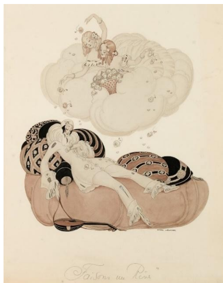
Slika 6. „Hajdemo sanjati“

LGBTQ+ zajednica aktivno se bori protiv stereotipa i uporno nastoji javnost educirati o različitosti roda i spola. U trenutku očajaja Einar izjavljuje kako nije važno što nosi, što predstavlja jednu od glavnih točaka kojih se transrodna zajednica i drugi članovi LGBTQ+ dotiču pri definiranju identiteta, odnosno kako se odjevne predmete ne treba dijeliti na temelju spolnih razlika.