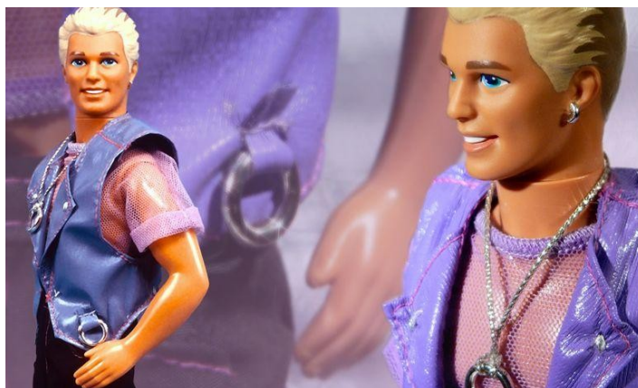
Slika 3. Mattel lutka „Earring Magic Ken“.

Moguće je potvrditi kako se sustav vrijednosti uistinu promijenio od 1993. što je vidljivo iz dva primjera: