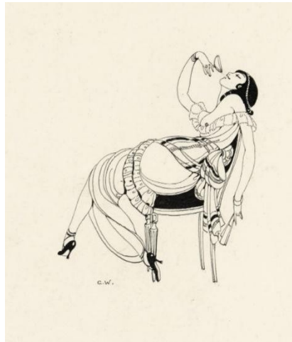
Slika 5. „Žena koja sjedi, posljednja kapljica“ (izvor: preuzeto u cijelosti. URL: https://www.swanngalleries.com/news/art-press-illustrated-books/2014/08/danish-girl-erotic-art-gerda-wegener/ pristup: 8. 8. 2023.)