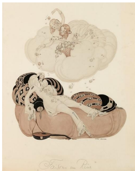
Slika 6. „Hajdemo sanjati“ (izvor: preuzeto u cijelosti. URL: https://www.swanngalleries.com/news/art-press-illustrated-books/2014/08/danish-girl-erotic-art-gerda-wegener/ pristup: 8. 8. 2023.)

LGBTQ+ zajednica aktivno se bori protiv stereotipa i uporno nastoji javnost educirati o različitosti roda i spola. U trenutku očajaja Einar izjavljuje kako nije važno što nosi, što predstavlja jednu od glavnih točaka kojih se transrodna zajednica i drugi članovi LGBTQ+ dotiču pri definiranju identiteta, odnosno kako se odjevne predmete ne treba dijeliti na temelju spolnih razlika.