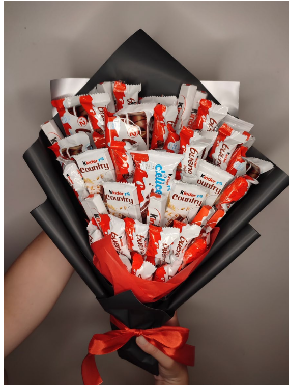
Slika 2. Slatki buket