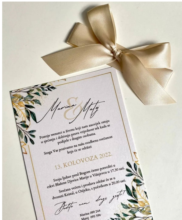
Slika 3. Pozivnice za vjenčanje