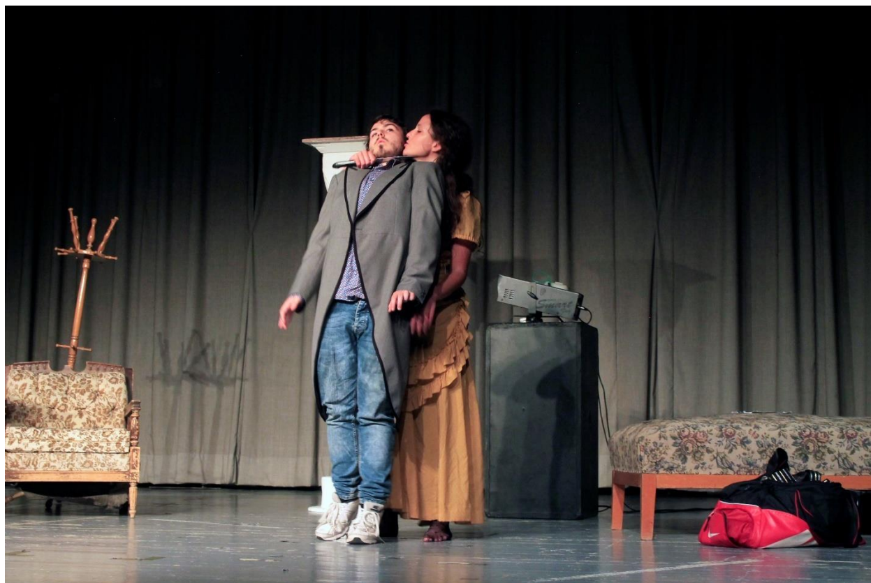
Slika 10: "stavlja mu nož pod grlo"

riječ o čistoj mržnji, no scena je postala točna kada sam igrala spoj erosa i tanatosa i time učinila Dunajevu punokrvnim sadistom. Ovaj način, koji smatram jednim od najboljih momenata u svojoj igri, kreirala sam putem snažnog i specifičnog osjećaja atmosfere, Taj impuls u meni se stvorio nakon što sam ispoštovala samoreferentnost drame. Netom prije Wanda parodira repliku “Živci mi zuje kao glazbena viljuška, zrak se oko mene crveni.” 19 , time kao da izaziva Thomasa, kao da mu postavlja pitanje “Želiš li ovo zbilja?”. Kada on odbaci njezine argumente, ona mu, naravno, ispuni želju.