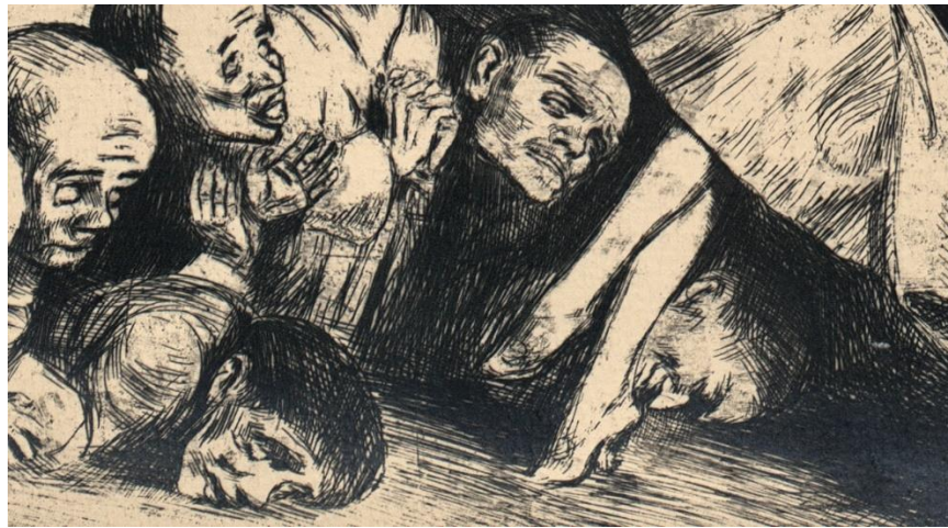
Slika 1: Bruno Schulz, "Pilgrims II"

Putem ovih inspiracija trudili smo se produbiti razumijevanje likova i njihovih unutarnjih svjetova.