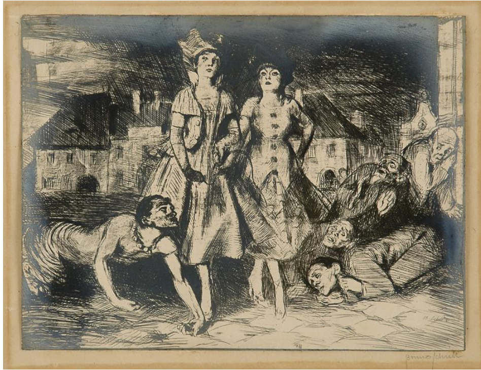
Slika 4: Bruno Schulz, "Enchanted City II"

Važno je imati otkud "vući" ulogu. Glumac je tako na početku procesa kao zdenac, u njemu se često već nalaze dijelovi uloge koju treba igrati, neki su skriveni na samom dnu, neki su već na površini i samo ih treba ispoljiti, no neke se mora tek „uliti“ koristeći vanjske podražaje kako bi u sebi pronašli nove putove i odgovore, zato je ovaj dio procesa toliko važan.