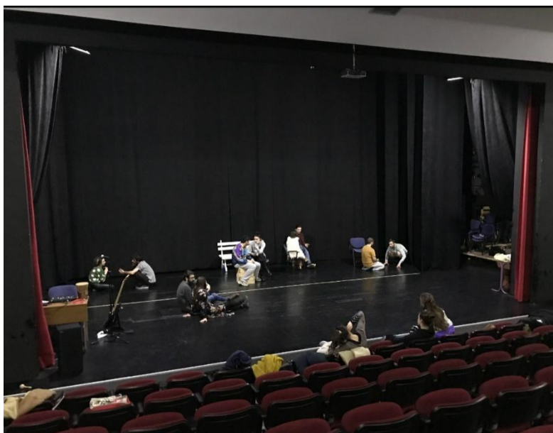
Slika 4: proba u kazališnoj sali Laze Kostića

Nakon što smo sve pročitali, redatelj je predložio novu improvizaciju koja bi nam omogućila da dublje upoznamo i razvijamo naše likove. Svaki glumac je zauzeo prostor u kazališnoj dvorani, označen kao soba u kojoj njegov lik boravi. Zadatak je bio izolirati se i istražiti što njegov lik radi kada je sam. Ova improvizacija je za mene predstavljala oslobađajući trenutak jer sam Matildi dopustila da se slobodno izrazi. Uživala sam u stvaranju Matildinog rituala priprema čaja, njezina načina oblačenja, nježnog vezivanja marame oko glave, udisanja osobnog prostora obogaćenog mirisima jasmína i mirisnih štapića. Također, istaknula sam neke od njezinih gesta koje su me posebno zaintrigirale, te sam se detaljno posvetila istraživanju njezine osame kroz pisanje i bolje upoznavanje s njezinim unutarnjim svijetom.