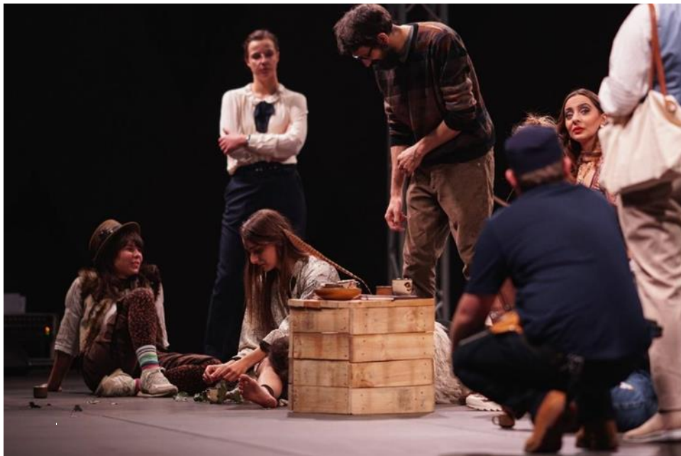
Slika 9: Drveni kubus korišten u raznim svrhama

U svemu što se radilo u predstavi, radili smo kao tim. Iako se u kazalištu takve stvari povjeravaju osobama zaduženima za to i čekamo da se rekviziti ili kostimi pojave na sceni, kod nas je to bilo drugačije. Ako bi netko od nas pronašao predmet koji bi mogao biti koristan za neki lik ili situaciju drugog glumca, odmah bismo to podijelili. I to su neki od elemenata za koje smatram da su doprinijele kvaliteti cijelog tima, ali i predstave. Na sceni je bilo mnogo predmeta koji se mogu povezati sa šumom, npr. lišće, grane, drveni kubusi koji su služili kao sjedalice ili stolovi. Također, mnogo kostima je bilo zemljanih tonova, pogotovo kod onih likova koji su duže boravili u Darkovoj zajednici, što je dodatno pojačalo atmosferu povezanosti s prirodom. Ovaj pažljivo osmišljen detalj dao je predstavi jedinstven vizualni i atmosferski identitet, doprinoseći ukupnoj autentičnosti i bogatstvu izvedbe.