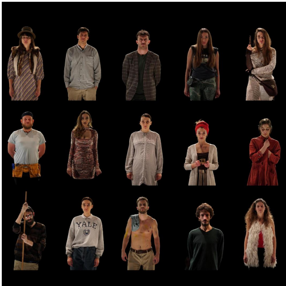
Slika 1: B(j)egunci

Likovi u predstavi su ljudi koji su zbog određenih razloga napustili dotadašnji način života, svoju okolinu i pristupili zajednici koju je nekada davno osnovao Darko, daleko od civilizacije, u šumi, na zamišljenoj tromeđi Srbije, Hrvatske i Bosne i Hercegovine. Svaki od likova imao je svoju ideju o tome tko je “Darko”. On je nekome bio partner, tiha ljubav iz mladosti, inspiracija, brat, a drugome zlostavljač ili pak samo utjelovljenje zla. Na kraju je glavni sukob i proizišao iz iskrivljenih percepcija naših likova, te se prava istina o Darku saznaje na kraju.