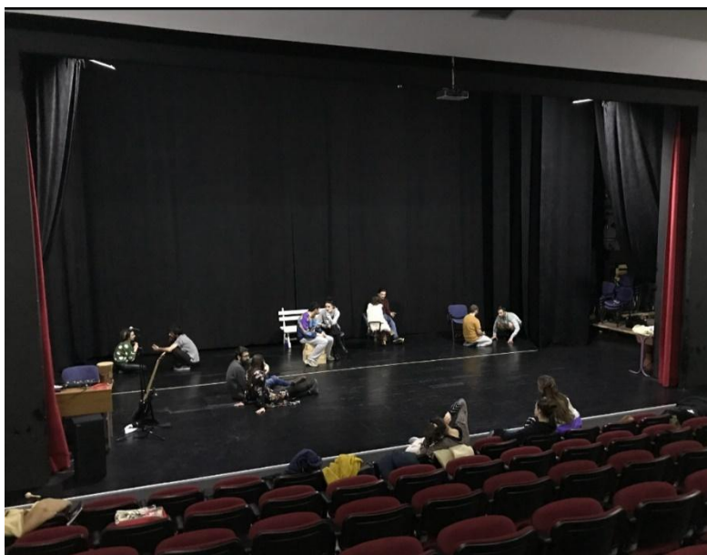
Slika 4: proba u kazališnoj sali Laze Kostića

Nakon što smo sve pročitali, redatelj je predložio novu improvizaciju koja bi nam omogućila da dublje upoznamo i razvijamo naše likove. Svaki glumac je zauzeo prostor u kazališnoj dvorani, označen kao soba u kojoj njegov lik boravi. Zadatak je bio izolirati se i istražiti što njegov lik radi kada je sam. Ova improvizacija je za mene predstavljala oslobađajući trenutak jer sam Matildi dopustila da se slobodno izrazi. Uživala sam u stvaranju Matildinog rituala priprema čaja, njezina načina oblačenja, nježnog vezivanja marame oko glave, udisanja osobnog prostora obogaćenog mirisima jasmína i mirisnih štapića. Također, istaknula sam neke od njezinih gesta koje su me posebno zaintrigirale, te sam se detaljno posvetila istraživanju njezine osame kroz pisanje i bolje upoznavanje s njezinim unutarnjim svijetom.