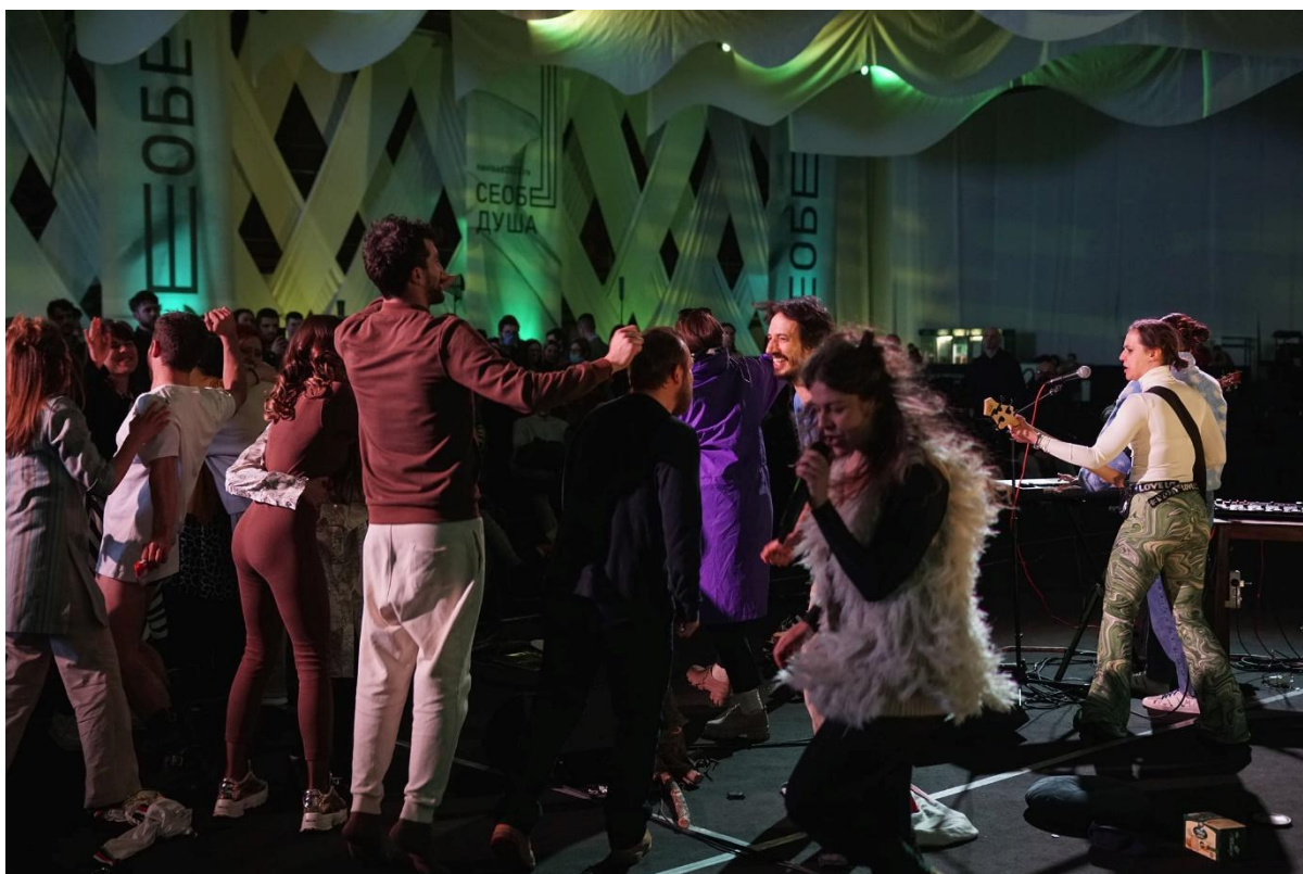
Slika 12: Premijera, završna pjesma