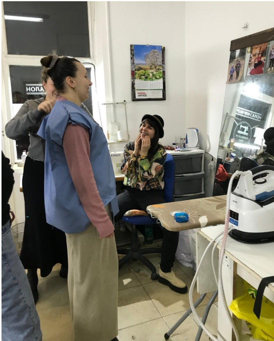
Slika 10: Kostimska proba