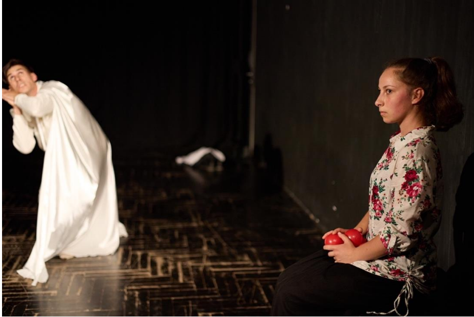
Slika 8 Njihova prva suradnja

Po završetku njegove etide nastavlja se razgovor sa žirijem: