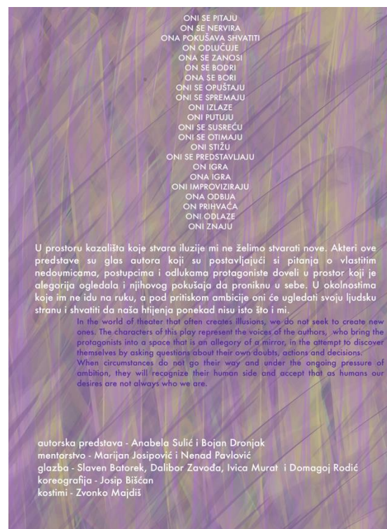
Slika 2 Programska knjižica predstave