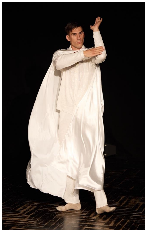
Slika 16 On na audiciji u kostimu