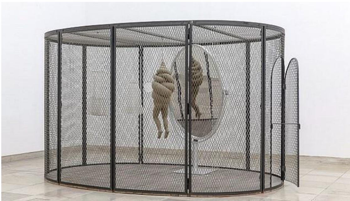
Slika 2. Louise Bourgeois, Ćelija XXVI, 2005., metal, tkanina, ogledalo

Još jedna bitna figura u polju reprezentiranja trauma u vizualnoj sferi je francuska umjetnica Louise Bourgeois koja se kroz materijale i procese u stvaranju svojih umjetničkih djela nosila sa prerađivanjem problematičnih i traumatskih sjećanjima iz djetinjstva. Serija od 60 radova pod imenom “Ćelije”, od kojih sam izdvojila primjere (slika 2. i 3.), nudi psihološki svijet vlastite borbe u eksploraciji doma iz djetinjstva, memorija i fantazija. Zatvorene forme instalacija su jedinstvene arhitektonske jedinice koje su po objašnjenju umjetnice “kuće koje udomljuju strahove”. Sagrađeni kao kavezi, svaka ćelija je ispunjena kolekcijom sakupljenih objekata koji su odraz njenog djetinjstva. U isto vrijeme zatvori patnje i kuće sigurnog raja, sadržavaju memorije traumatičnih događaja, ali isto tako i fantazije idealnog doma u smislu potrebe da rekonstruira svoju prošlost nad kojom može imati kontrolu i izmjeniti ju.