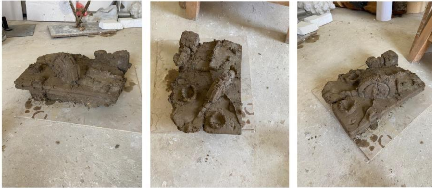
Slika 5. "Stol"

Instalacija se tako slaže iz tri dijela, prvo se postavljaju metalne konstrukcije preko kojih ide gaza, te potom skulpture od zemlje se slažu u svaki element zasebno.