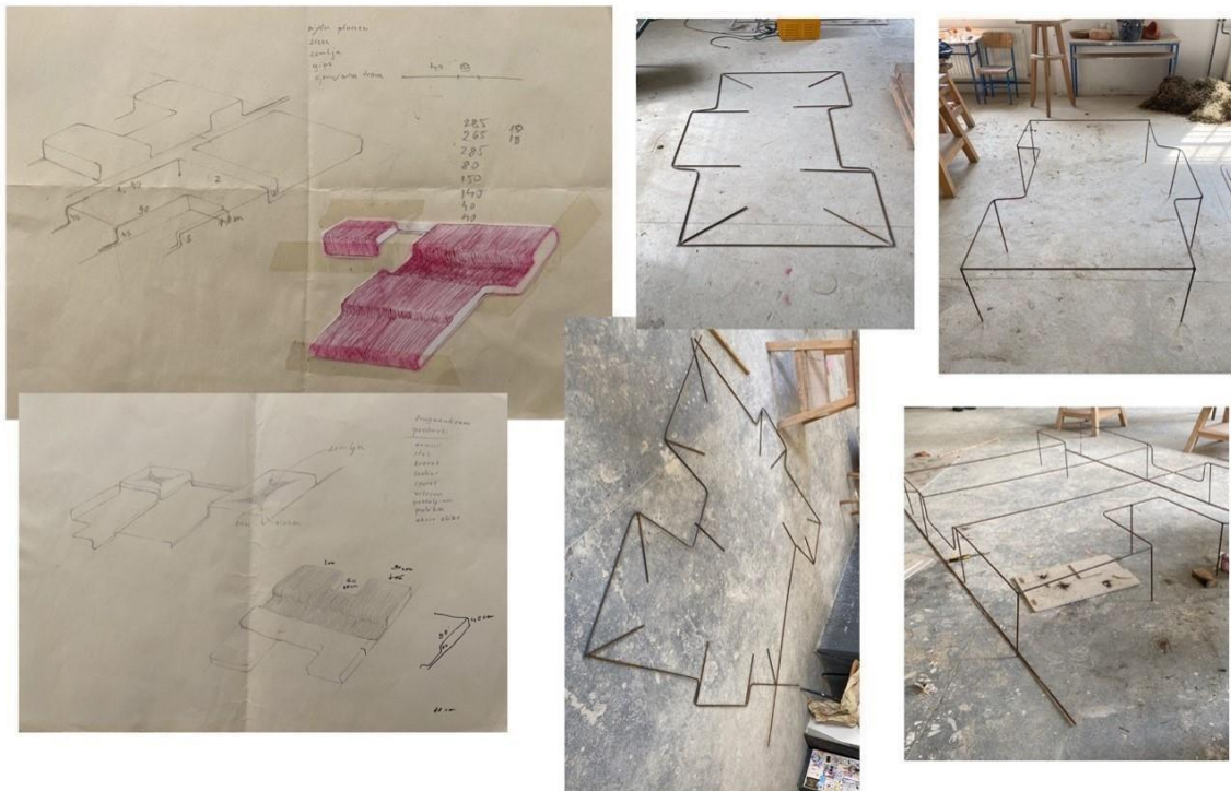
Slika 10. Skice metalnih konstrukcija te proces njihove izrade.