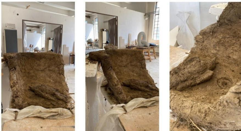
Slika 6. "Kada"