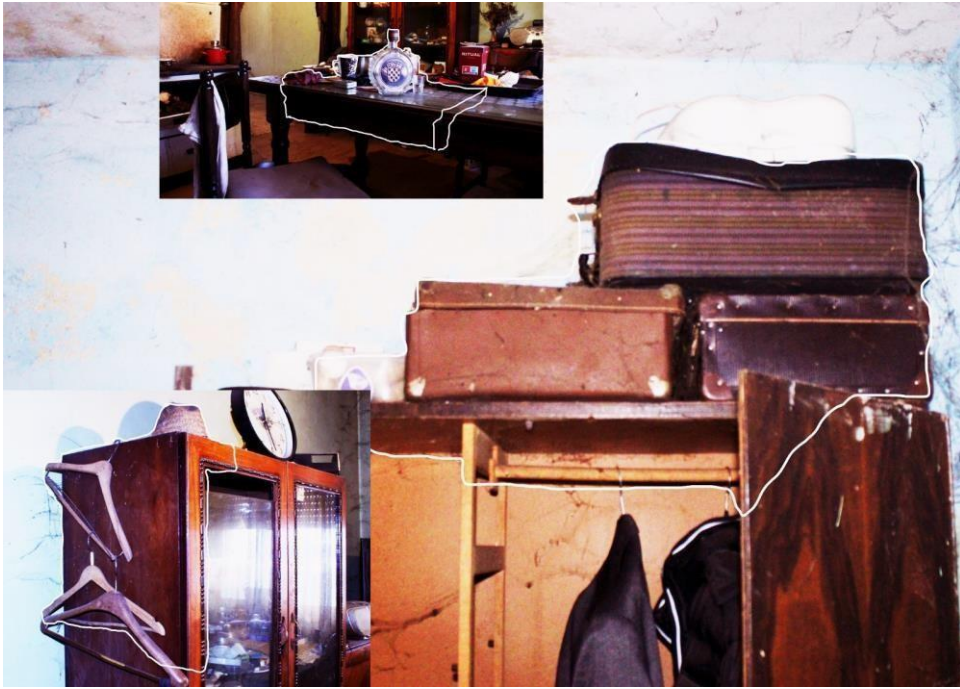
Slika 9. Fotografije predmeta iz kuće po kojima s neki od objekata realizirani.