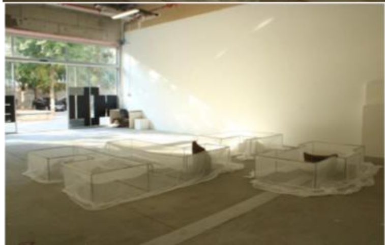
Slika 11/ 12/ 13.