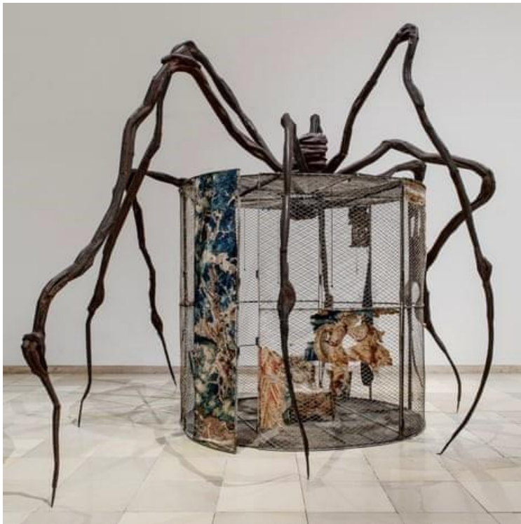
Slika 3. Louise Bourgeois, 1997., čelik, drvo, staklo, tkanina, kost, tepih, guma, srebro