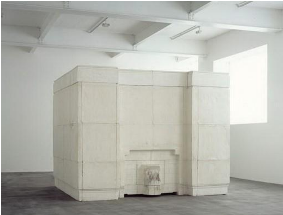
Slika 4. Rachel Whiteread, „Duh“ 1990., gips na metalnom okviru

Kao primjer ponovnog činjenja prisutnim britanska umjetnica Rachel Whiteread svoje skulpture, crteže, svakodnevna okruženja, objekte i površine transformira u sablasne replike koje bivaju jezivo prepoznatljive. Kroz tehniku lijevanja, ona oslobađa svog subjekta: kreveti, stolovi i kutije pa sve do vodenih tornjeva i cijelih kuća. Od praktične upotrebe, sugerirajući novu trajnost prožetu sa sjećanjem. Njen rad „Duh” 1990. (slika 4.) napravljen lijevanjem sobe Viktorijanske kuće u betonu, čime stvara čvrsti kalup koji je pokupio detalje zidova, prozora i kamina, Duh je pozitiv sobe u stvarnim mjerama tog objekta koji sepostupno otkriva kako ga okružujemo. Za ovaj rad kaže kako je htjela „mumificirati zrak u sobi”, naglašavajući memorijalne tonove evocirane tihim nalik na mauzolej djelom. Njena konstantna praksa reprezentiranja obiteljskih prostora (sobe, stepenice, kuće), namještaj (stolice, stolovi, madraci, police), otvara takozvane „životne odljeve” prema novim mogućnostima da njena uvjerljiva umjetnost oblikuje svijest o promjenjivom fenomenu svakidašnjeg.