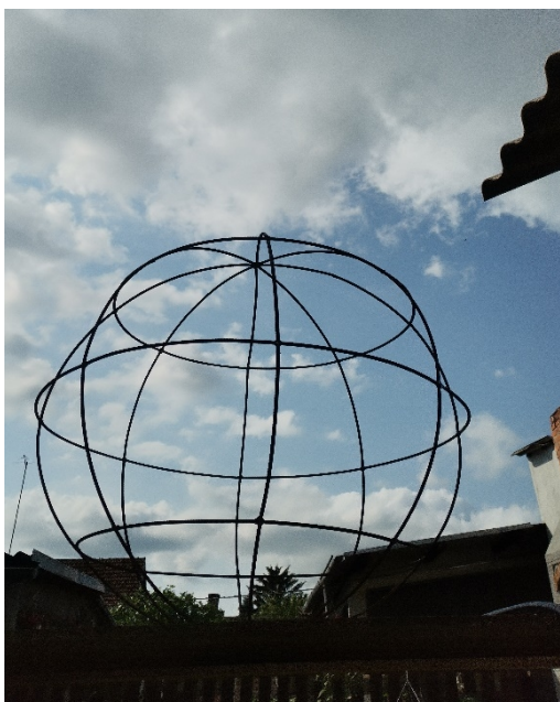
10. Slika – „Topla okruglina“