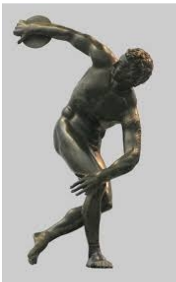
6. Slika – Bacač diska – Myron