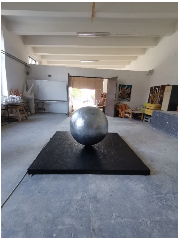
18. Slika – „Topla okruglina“