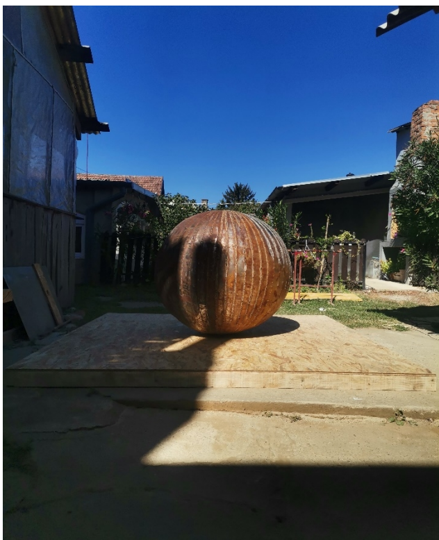
12. Slika – „Topla okruglina“