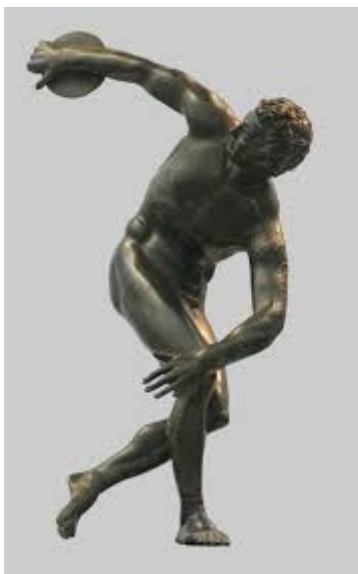
6. Slika – Bacač diska – Myron