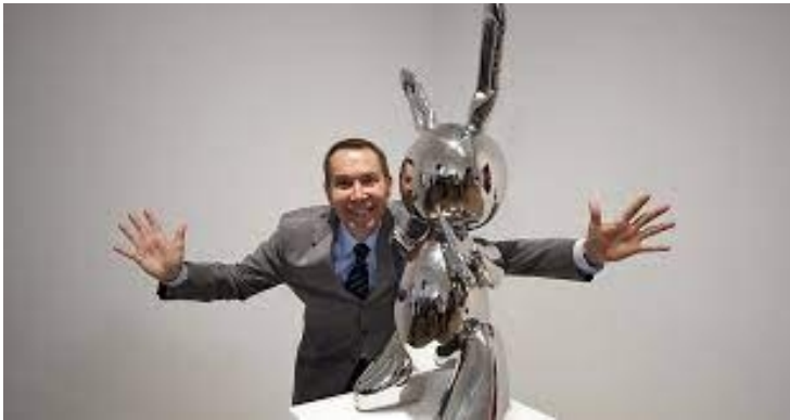
5. Slika – Rabbit – Jeff Koons

Bronca se tradicionalno smatra najboljim metalom za kiparstvo zbog svojih kvaliteta poput lakoće, trajnosti, fleksibilnosti i sposobnosti da se detaljno oblikuje. Skulpture od bronce se lako lijevaju i oblikuju te imaju sjajnu površinu koja ne hrđa. Mjed se također koristi u kiparstvu, ali nije toliko zastupljen kao bronca. Skulpture od mjedi su u većini slučajeva tanji i lakši od bronce te imaju sjajnu i zlatnu površinu. Željezo i čelik već duže vremena se koriste za izradu skulptura. Takve skulpture su teške i robusne. Razlika između željeza i čelika je u tome što, ukoliko ne dođe do zaštite površinskog sloja, željezo će vremenom apsorbirati vlagu iz zraka te će početi hrđati, dok čelik ne može hrđati.