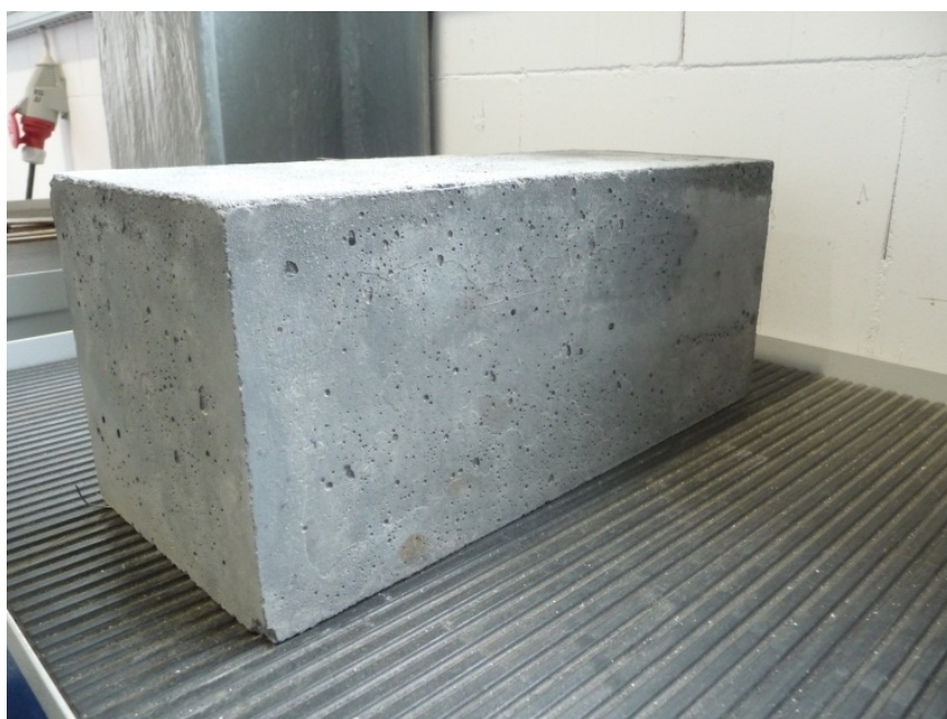
3.Slika – Betonski blok