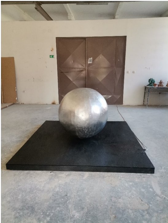
15.Slika – „Topla okruglina“