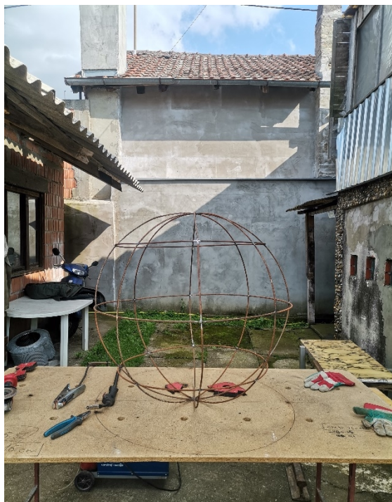
9. Slika – „Topla okruglina“ izrada konstrukcije

Praktični dio diplomskog rada započinjem razmatranjem savršenog oblika za skulpturu, te kako i kakav bi utjecaj imalo termičko svojstvo zagrijavanja materijala na samu skulpturu. Rad je zamišljen kao oblik sfere napravljen od metalnih ploča. Unutar sfere se nalazi grijač koji je priključen na električnu mrežu. On zagrijava sferu na određenu temperaturu. Rad je interaktivan i poziva promatrača da slobodno rukom dotakne površinu kugle. Tada promatrač postaje „dodirivač“. U konceptualnom smislu rad je zamišljen kao interaktivna skulptura. Kugla predstavlja zatvorenu cjelinu jednog područja te sam za završni rad odabrao baš kuglu jer upravo ona zatvara jednu cjelinu u mom životu. S obzirom da sam u ranijem pisanom dijelu spominjao kuglu kao topli oblik možemo uzeti sunce kao primjer tople kugle. Moj doživljaj skulpture pronalazim upravo u njenoj toplini, u toplini poput sunčeve.