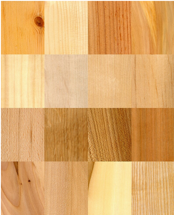
2. Slika – Vrste drveta