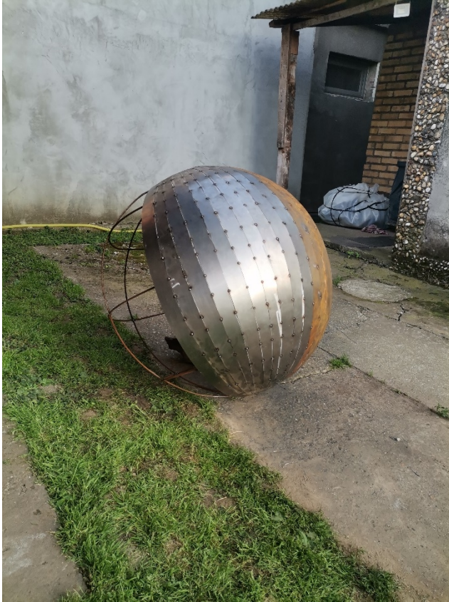
11. Slika – „Topla okruglina“

Nakon sastavljanja u željeni oblik svi elementi se spajaju takozvanim „pikanjem“ pomoću aparata za zavarivanje što znači da se materijal zavaruje s međusobnim razmacima od deset do petnaest centimetara.