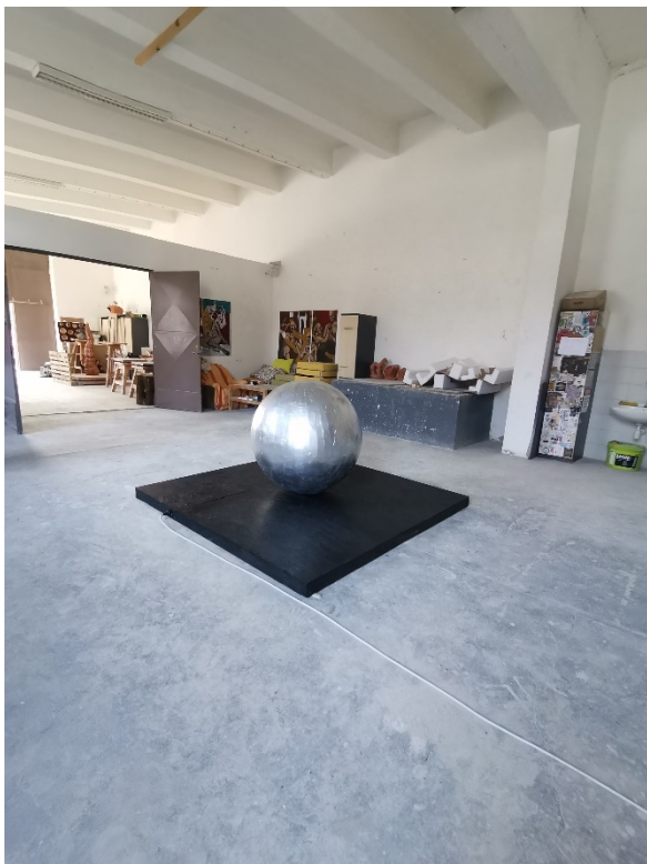
17. Slika – „Topla okruglina“