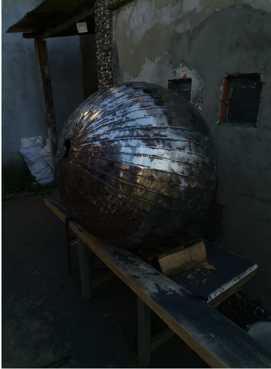
13. Slika – „Topla okruglina“

za očuvanje skulptura i njihovu dugotrajnost. U konačnici ovaj rad doprinosi boljem razumijevanju termičkih svojstava metala u skulpturi i naglašava važnost kontrole i praćenja tih svojstava za očuvanje skulptura.