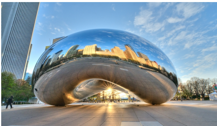
4. Slika – Cloud Gate „The Bean“, Chicago – Anish Kapoor