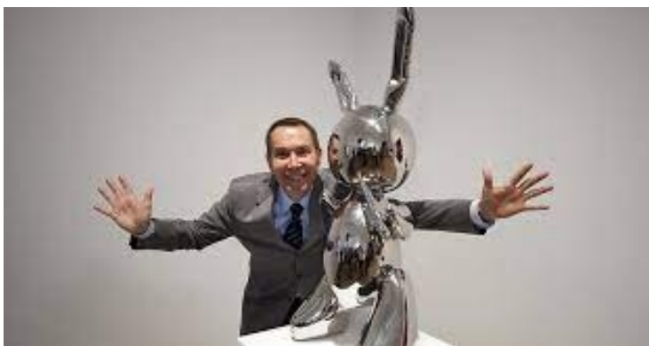
5. Slika – Rabbit – Jeff Koons

Bronca se tradicionalno smatra najboljim metalom za kiparstvo zbog svojih kvaliteta poput lakoće, trajnosti, fleksibilnosti i sposobnosti da se detaljno oblikuje. Skulpture od bronce se lako lijevaju i oblikuju te imaju sjajnu površinu koja ne hrđa. Mjed se također koristi u kiparstvu, ali nije toliko zastupljen kao bronca. Skulpture od mjedi su u većini slučajeva tanji i lakši od bronce te imaju sjajnu i zlatnu površinu. Željezo i čelik već duže vremena se koriste za izradu skulptura. Takve skulpture su teške i robusne. Razlika između željeza i čelika je u tome što, ukoliko ne dođe do zaštite površinskog sloja, željezo će vremenom apsorbirati vlagu iz zraka te će početi hrđati, dok čelik ne može hrđati.