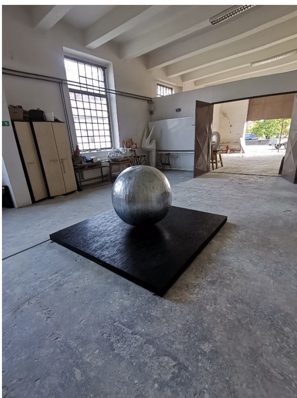
19. Slika – „Topla okruglina“