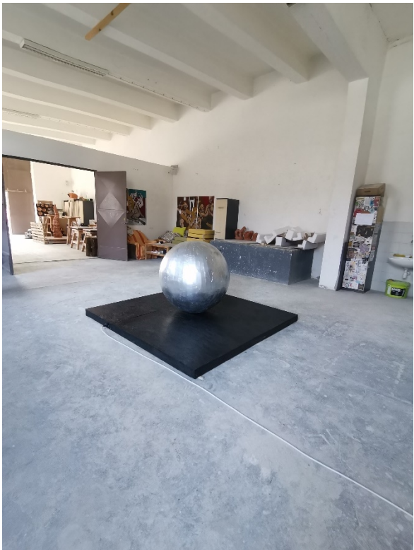
17. Slika – „Topla okruglina“