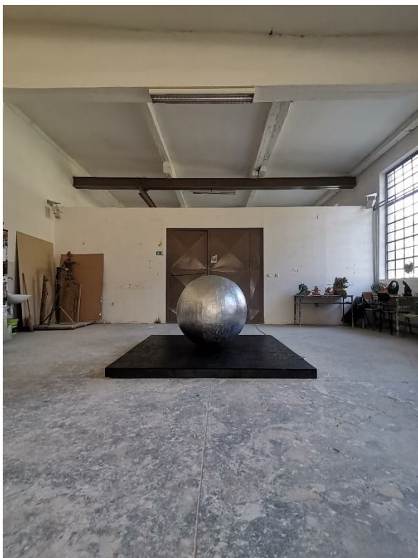
20. Slika – „Topla okruglina“