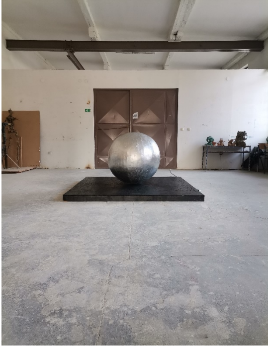
14. Slika – „Topla okruglina“