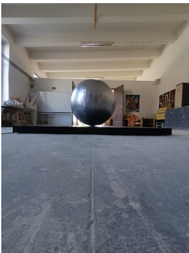
21. Slika – „Topla okruglina“