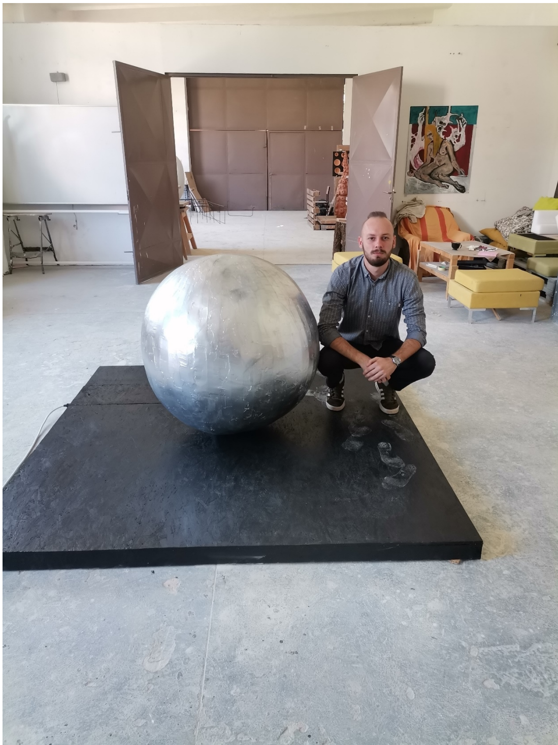
22. Slika – autor i rad „Topla okruglina“