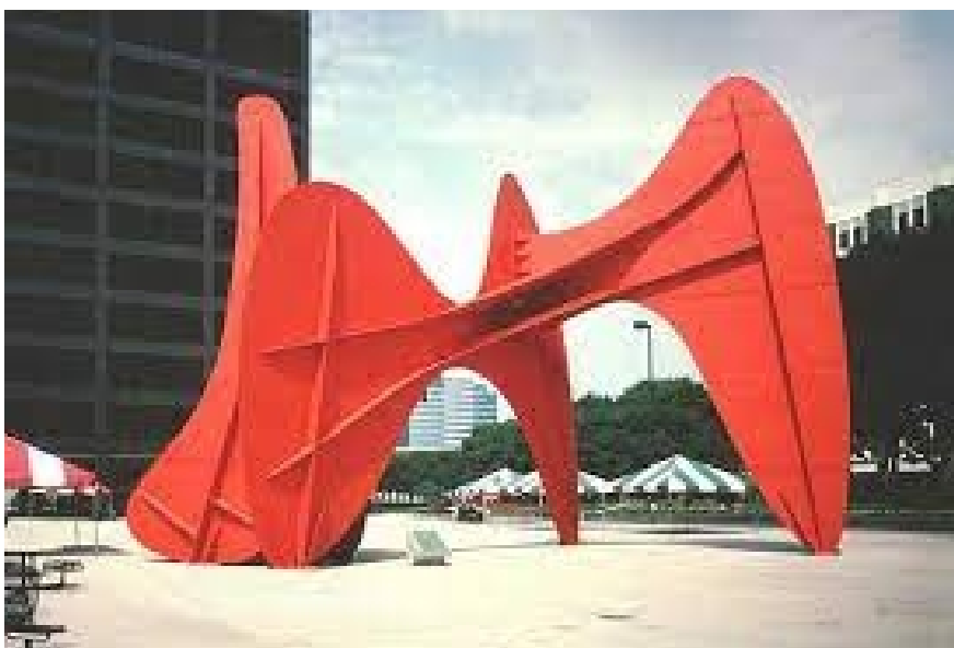
7. Slika – skulptura umjetnika Alexandra Caldera

Metal kao medij u umjetnosti ima različite primjene, a jedna od njih je i u grafičkom dizajnu posebice u izradi metalnih matrica za otiskivanje. Metalne matrice su ploče od različitih