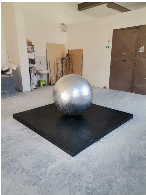
16. Slika – „Topla okruglina“