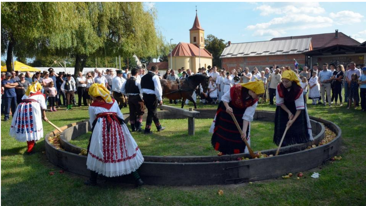
Slika 8. Prikaz procesa izimanja jabuka

bi mogao okretati kotač koji će drobiti jabuke. Nakon što je konj privezan, muški članovi uzimaju vreće s jabukama i stavljaju ih u drvene valove, nakon toga žene uzimaju drveni lopatak kojim raširuju jabuke po valovima kako bi sve bilo ravnomjerno raspoređeno. Kada je to učinjeno, stariji član koji je zadužen za konja, daje znak muškarcima da se maknu i tjera konja prema naprijed i time započinje proces izimanja. Konj vuče kamen koji se okreće u valovima i drobi jabuke, a žene za to vrijeme jedna iza druge idu i lopatkom dižu zdrobljene jabuke kako bi kamen lakše prolazio i kako bi se sve jabuke ravnomjerno što sitnije samljele. Dok se jabuke drobe u valovima, muškarci u ambaru pripremaju drvene posude (škafove) u koje će se zdrobljene jabuke pokupiti i nositi u prešu na cijedenje. Nakon nekoliko krugova kamenom, kada stariješina vidi da su jabuke zdrobljene i da su pustile dosta soka, zaustavlja konja, odvezuje ga i pušta ženama da krenu kupiti jabuke u škafove.