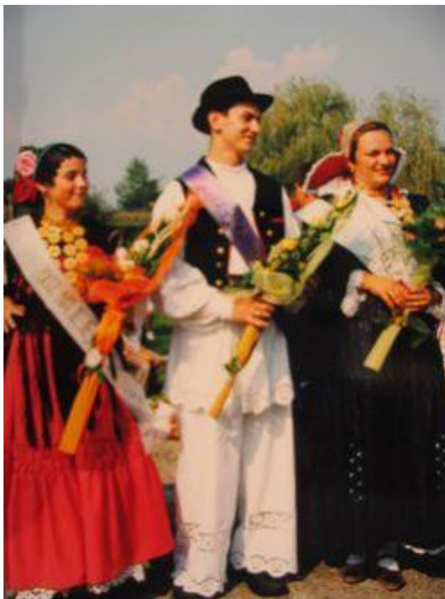
Slika 10. Izbor za najljepšu djevojku, snašu i momka