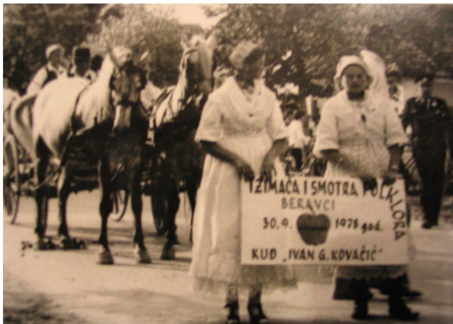
Slika 6. Povorka prve Ižimače

Na dan manifestacije članovi društva, kao i svi mještani, okupljaju se u centru sela u Etno parku gdje se manifestacija održava. Najčešće u programu sudjeluje oko deset do petnaest gostujućih kulturno-umjetničkih društava iz raznih dijelova Hrvatske, ali i šire. Program Ižimače od samih početaka tradicionalno započinje svečanom povorkom svih gostujućih društava od jednog kraja sela sve do Etno parka, prilika je to za goste iz folklornih društava da pokažu svoje tradicionalno ruho.