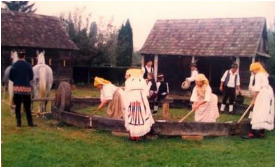
Slika 3. Prikaz išimače i pomoćnih gospodarskih zgrada