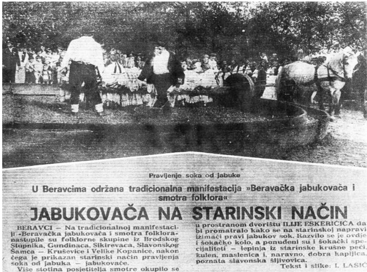
Slika 5. Arhivirani isječak iz novina - Ižimača 1978. godine

Naime, ono što je također vidljivo jest naziv manifestacije koji je naveden u isječku novina. Naziv glasi „Beravačka jabukovača i smotra folklor“, a ne Ižimača kako je danas poznajemo. Ono što je zanimljivo jest činjenica da je manifestacija promijenila svoj naziv već druge godine u Ižimača – smotra folklor i starih običaja , upravo iz razloga kako bi istaknula ono što se htjelo prvotno zaštititi – ižimača. Osim toga, dan je uvid u kulturni program toga dana. Osim prikaza izimanja jabuka što čini okosnicu kulturnog programa, svoje pjesme, plesove i običaje priliku su imali prikazati i članovi kulturno-umjetničkih društava iz drugih sredina. Tako znamo da su na prvoj smotri folklor nastupale folklorne skupine iz Brodskog Stupnika, Gundinaca, Sikirevaca, Slavanskog Šamca, Kruševice i Velike Kapanice. S obzirom na kulturno djelovanje udruga koje su se bavile promicanjem kulture i baštine tijekom 70-ih godina, može se reći da je za manifestaciju manjeg mjesta nastup šest folklornih skupina bio smatran itekakvim uspjehom.