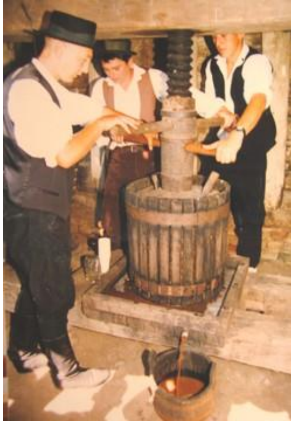
Slika 9. Prikaz prešanja jabuka u ambaru