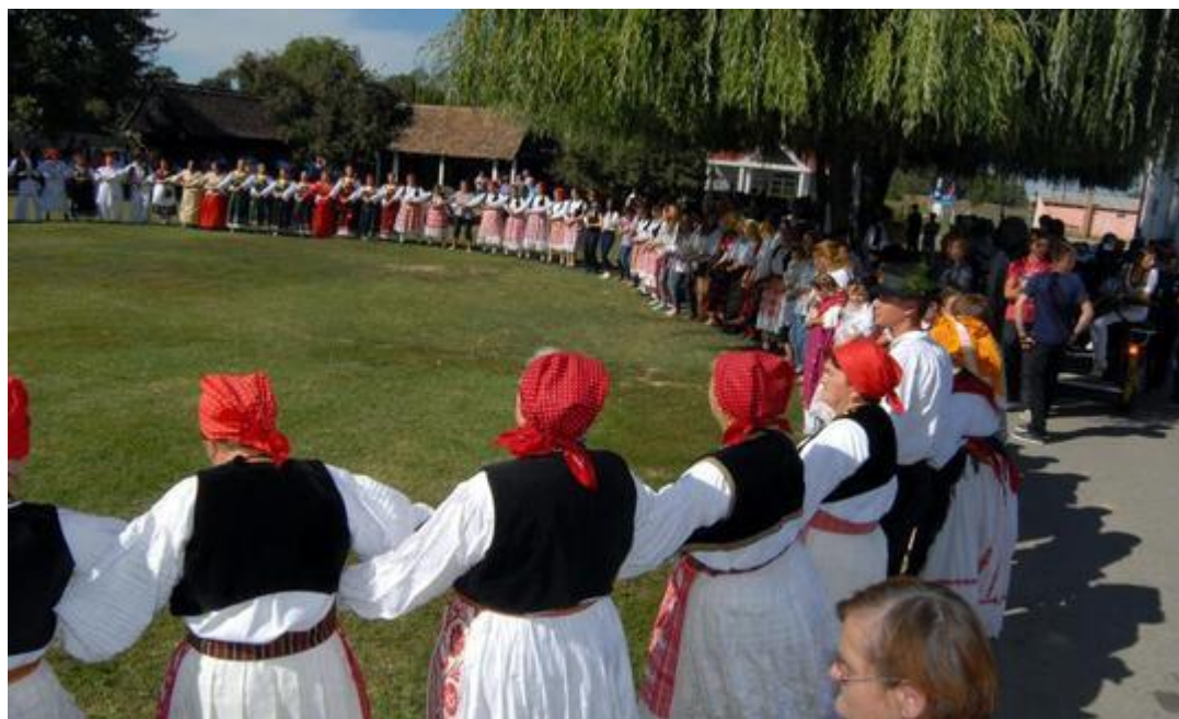
Slika 7. Tradicionalno šokačko kolo u Etno parku