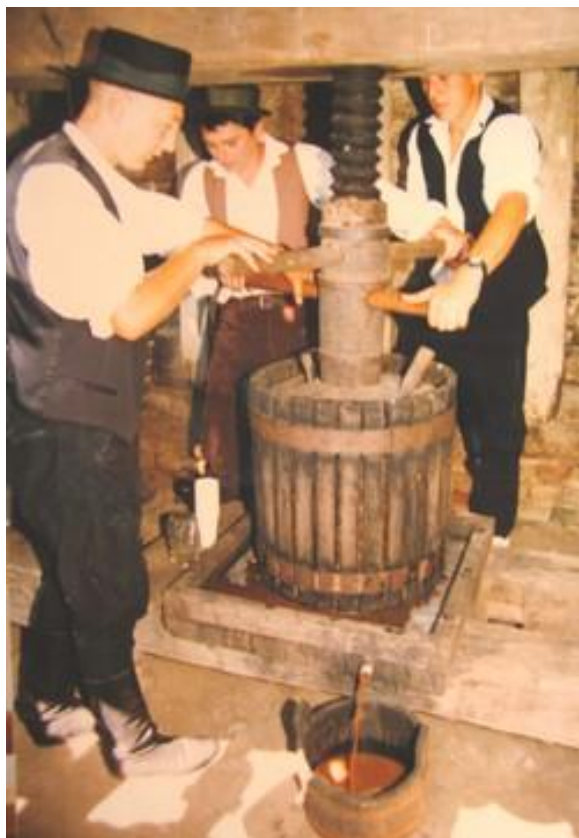
Slika 9. Prikaz prešanja jabuka u ambaru