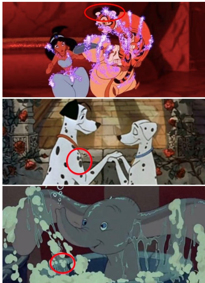
Slika 6. Prikaz skrivenih obrisa Mickeyja Mousea

“Ova nadaleko poznata šala koja se ponavlja postala je omiljena dosjetka među Disneyjevim entuzijastima. Svaki novi Disneyjev film postaje prilika za upuštanje u čudnu igru “lova na skrivenog Mickeyja”. Kroz mnoge godine svoga rada, Disney je utkao suptilne prikaze Mickeyja Mousea u svoje kinematografske kreacije. U određenim prilikama ti su slučajevi očiti – poput igračke Mickeyja Mousea koja krasi policu u trgovini u Frozenu. Ipak, u drugim slučajevima, zadatak otkrivanja postaje znatno izazovniji. Primjeri uključuju suptilni obris Mickeyjeve glave koji se formira u Pongovom krznu ili unutar Dumbovih mjehurića za kupanje ili na trenutak dok Jasminin tigar, Rajah prolazi kroz transformaciju” (Vidi sliku 6.). (Josh 2021)