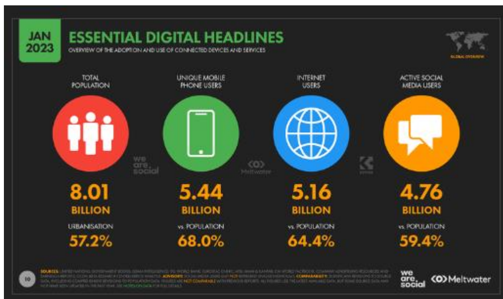
Slika 1. Korisnici novih tehnologija 2023. Godine (Dataportal, 2023.)

„Današnji novi mediji temelje se na audiovizualnim iskustvima radija i televizije, privlačnosti rješenja potrošačke elektronike, odnosno industrije zabave, povećanju brzine prijenosa koje omogućavaju suvremeni telekomunikacijski sustavi te petostoljetnom iskustvu tiska i nakladništva, a mogući su samo ako koristite neki od najrazličitijih oblik računala.“ (Peruško, 2011:204)