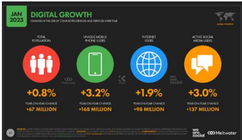
Slika 2. Rast korištenja digitalnih tehnologija 2023. (Datareportal, 2023.)

podacima s portala Datareportal (2023.) vidljivo da od 8,1 milijardi ljudi na svijetu, njih 5,44 milijarde koristi mobilni telefon. Od toga, 5,16 milijardi ljudi koristi Internet, a 4,76 milijardi ljudi koristi društvene mreže.