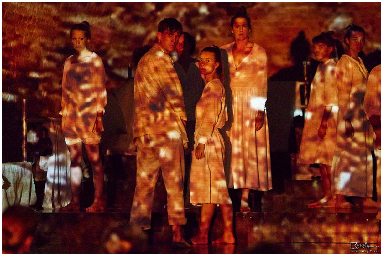
Slika 9: Četvrta scena - Osuda

U sljedećoj smo sceni postavili cilj naglasiti kontrast i brzinu moguće promjene između sklada i razora odnosa među ljudima. Kako bismo to postigli, koristili smo se različitim razinama tribina primjenjujući žuto, bijelo i crveno svjetlo kao ključne elemente vizualnog prikaza promjene među ljudima. Žuta rasvjeta simbolizirala je trenutke i osjećaje harmonije unutar skupine, međusobno razumijevanje, zajedničko sudjelovanje u aktivnostima, dijeljenje smijeha i pružanje potpore jedni drugima. Zaustavljanjem žutog svjetla i prijelazom na bijelo svjetlo označili smo kraj trenutaka sklada i suradnje. Pod bijelim smo svjetlom stajali nepomično, s pogledima usmjerenima prema publici, čime smo metaforički prikazali osudu svih nas koji pasivno promatramo svijet i sukobe oko sebe ne poduzimajući konkretne korake za promjenu. Nakon bijelog, palilo bi se crveno svjetlo koje je označavalo trenutke sukoba i borbe.