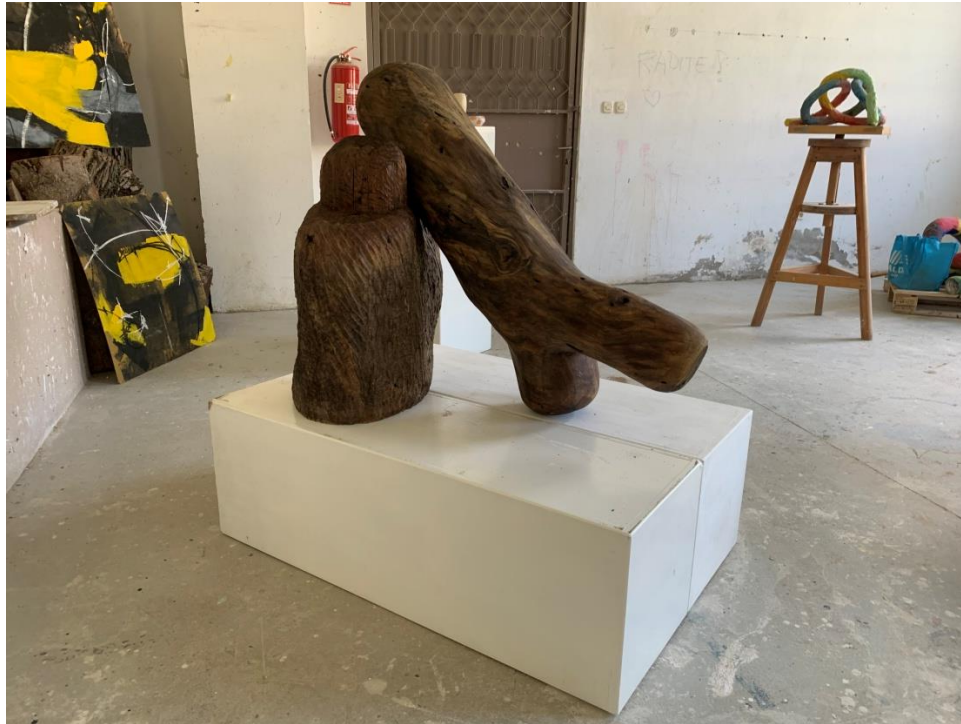
Slika 7. Oslonac - gotov rad, 2023., drvo