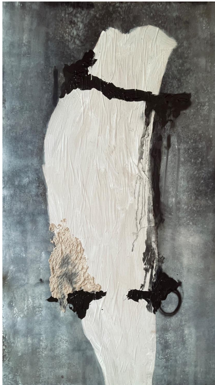
Druga slika IO triptiha FAIOTO

Druga slika predstavlja moju sadašnjost. Koristio sam se bojom u spreju kao glavnim materijalom za stvaranje dinamike. Autolak simbolizira osobnu slobodu i izražavanje. Odabrao sam svjetliji kolorit u odnosu na prvu sliku, što označava raznolikosti i živost moga trenutačnoga života. Uključio sam središnji apstraktni motiv kako bih sugerirao strukturu i poredak koji sam postigao kao odrasla osoba.