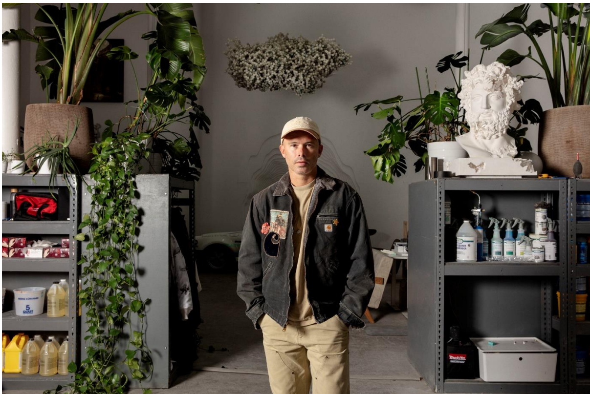
Daniel Arsham u studiju, New York, 2021.

U intervjuu za 52 Insights rekao je kako je na njega utjecao uragan koji mu je uništio dom iz djetinjstva, kada je imao 12 godina, što ga je natjeralo na razmišljanje o prolaznosti i propadanju svega. Također je rekao da sadašnji trenutak lažnih vijesti i alternativnih činjenica vidi kao priliku za umjetnike da uključe ljude u raspravu o stvarnosti i mašti: „Jednostavno mislim da smo u trenutku u kojem su stvarnost, činjenice i cijeli ovaj koncept alternativnih činjenica i lažnih vijesti takva kulturološka dodirna točka. Bilo je dosta razgovora u smislu da je to negativan aspekt društva, što svakako mogu razumjeti i složiti se, ali također vjerujem da kada ljudi na vlasti stvaraju scenarije u kojima se stvarnost može preispitivati, to također otvara priliku za nas koji funkcioniramo i radimo u tom prostoru kako bismo ga kapitalizirali.” Također je govorio o svom radu sa slavnim osobama i o svojoj fascinaciji erodiranjem čvrstih predmeta radi stvaranja nadrealnih skulptura.