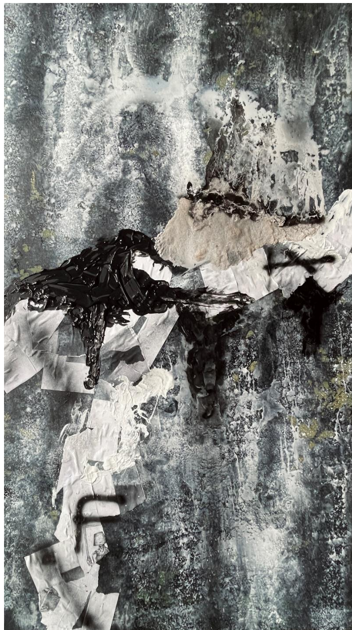
Prva slika FA triptiha FAIOTO

Prva slika, najsloženija u triptihu, predstavlja moju prošlost. Koristio sam se pijeskom kao glavnim materijalom za stvaranje teksturirane i grube površine. Pijesak simbolizira moje korijene, porijeklo i sjećanja. Odabrao sam zemljane tonove koji odražavaju toplinu i nostalgiju za djetinjstvom i mladošću. Kontrast crne i bijele te izbljeđenost pozadine sugerira protok vremena i blijedeće nekih sjećanja i iskustava.