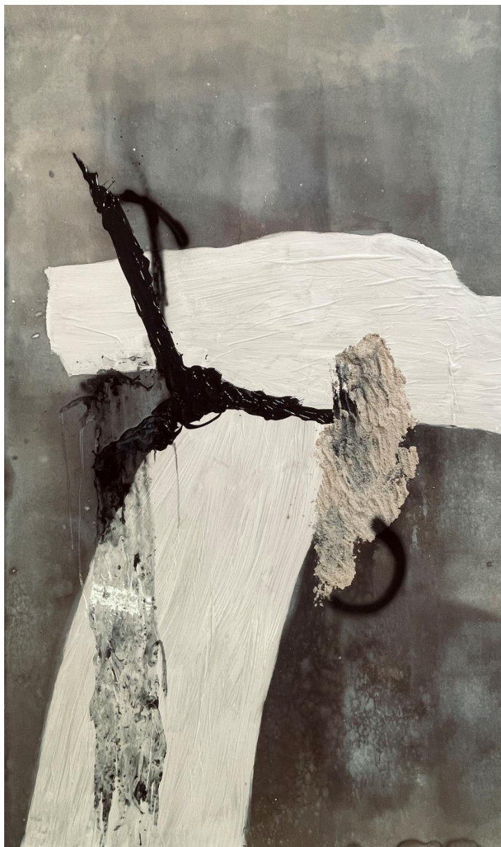
Treća slika TO triptiha FAIOTO

Treća slika predstavlja moju budućnost. Koristio sam se bojama za beton kao glavnim materijalom za stvaranje čvrste i glatke površine. Kolorit simbolizira snagu, otpornost i ambiciju. Sivi i bijeli tonovi odražavaju jednostavnost i jasnoću vizije spram početnoga stadija triptiha. Slike povezuje tema apstraktnoga slikarstva koja omogućuje istraživanja različitih emocija, značenja i perspektiva pomoću oblika, boje i teksture. Kao što je Daniel Arsham rekao: „Apstraktno slikarstvo je oblik bijega od stvarnosti“, a ja bih rekao da ono jest moja stvarnost. Apstraktnim slikarstvom bježim od ograničenja stvarnosti i pronalazim autentičnoga sebe.