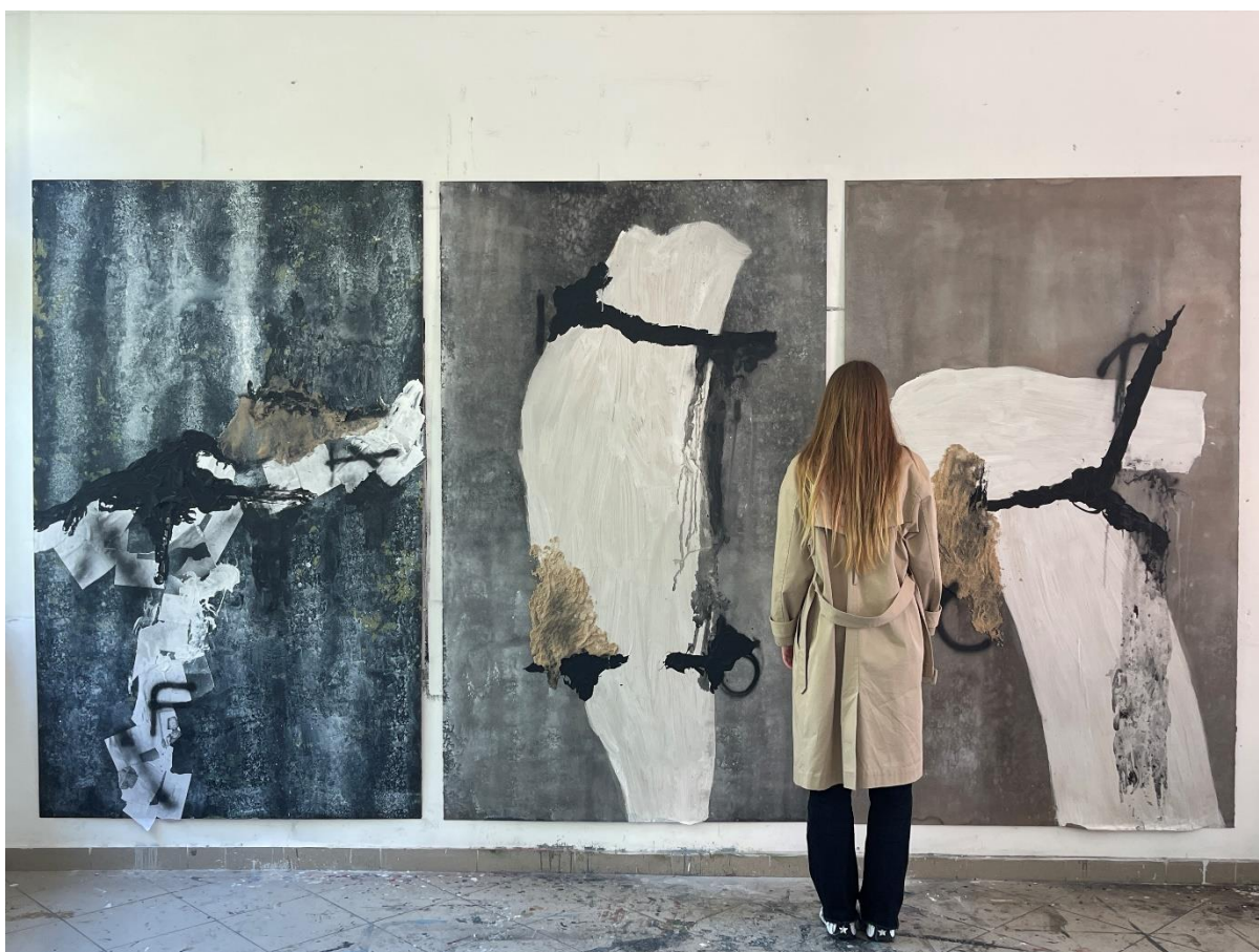
Izložbeni postav triptiha FAIOTO , 2023.

Triptih FAIOTO sastoji se od serije slika kombiniranih tehnika. Neke od ključnih jesu pijesak-kolaž, stare grafike te boja za beton. Triptih čine tri slike jednakih dimenzija. Slike su postavljene u horizontalnom nizu s razmakom od najmanje 5 cm. Svaka dimenzija slike iznosi 220 cm x 130 cm, a širina postava 405 cm. Triptih je proizvod različitih elemenata poput linije, teksture, plohe i boje. Materijal je različitim alatima i tehnikama nanošen na površinu plohe.