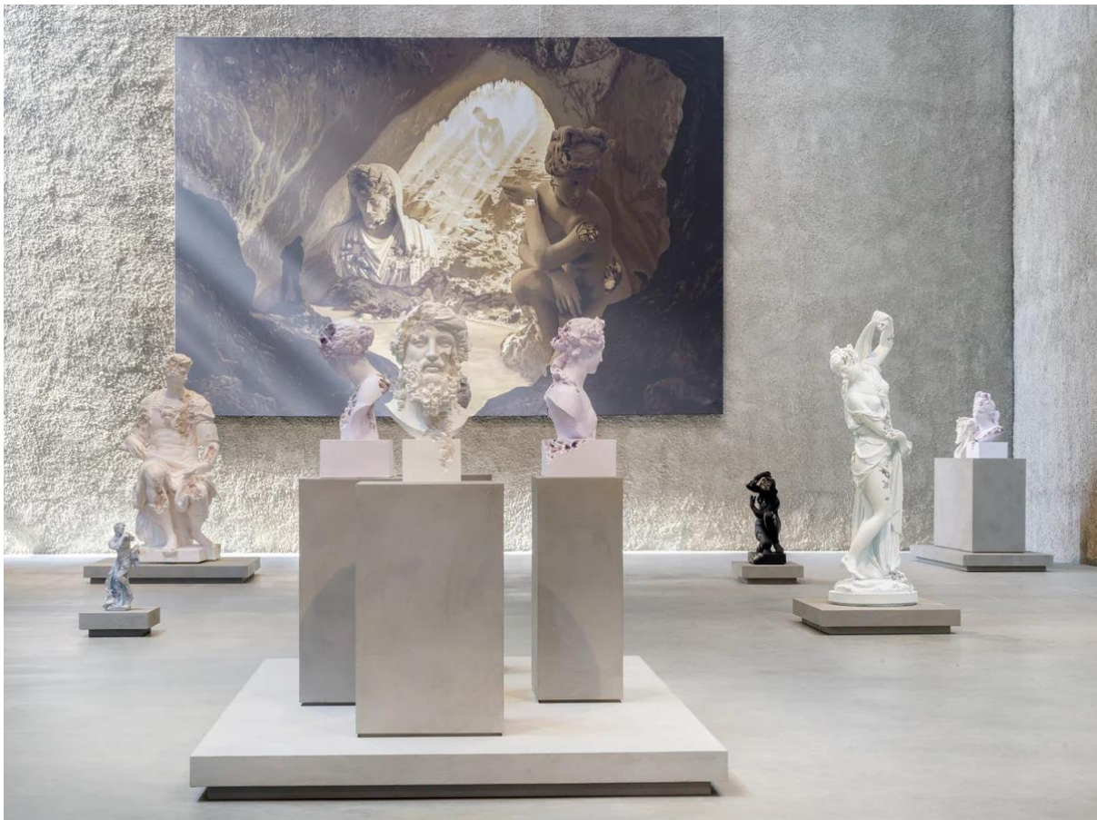
Izložbeni postav Arshamove Unearthed , izložbe u Konig Galerie, Berlin, 2021.

Daniel Arsham jest dugogodišnji uspješni američki umjetnik koji istražuje misterije vremena preko svojih skulptura, slika i instalacija. Često se koristi materijalima poput kristala, pepela i pijeska kako bi stvorio predmete koji izgledaju kao da su ih nagrizle prirodne sile. U intervjuu za IGNANT rekao je da ga zanima ideja stvaranja nečega što izgleda kao da je iz prošlosti, a zapravo je iz budućnosti. Govorio je i o svojoj prvoj samostalnoj izložbi u Berlinu, pod nazivom Unearthed , gdje je predstavio relikte iz drevnih civilizacija za koje je zamišljao da će biti otkriveni 3021. godine.