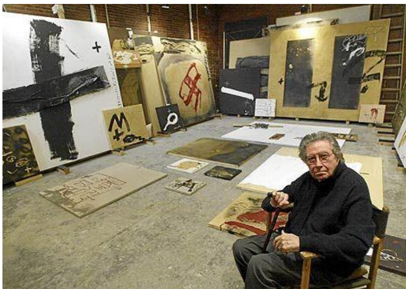
Tapes u studiju, veljača 2012.

Antoni Tapes bio je katalonski slikar, kipar i teoretičar umjetnosti koji je postao jednim od najpoznatijih umjetnika svoje generacije. U intervjuu za UNESCO Tapes je rekao kako je uvijek bio zainteresiran za materijalni aspekt slike, za materiju boje i kako ta materija može postati jezik. Također je rekao: „Uvijek sam pokušavao koristiti materijale koji nisu tradicionalni, koji su loši, koji se smatraju malo vrijednim. Koristio sam pijesak, zemlju, krpe, papir, sve vrste stvari koje sam nalazio oko sebe.” Tapes je vjerovao da korištenjem tim materijalima može stvoriti novi jezik i izraziti svoje ideje na jedinstven način.