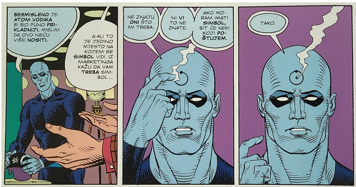
Slika 8 Čuvari, Simbol, poglavlje 9, 120. str., © DC Comics

Zadnja nada za čovječanstvo pojavljuje se u liku Laurie koja ga spoznajom o svom životu navodi na promjenu mišljenja. Jest da se na kraju to u potpunosti nije isplatilo niti je ikako dublje utjecalo na rasplet, ali teorija koju Dr. Manhattan postavi na temelju Laurienog sloma, važan je uvid u njegov način razmišljanja: „Predomislio sam se. Termodinamička čuda... Događaji za čije su ostvarenje izgledi tako astronomski mali da su praktično nemogući, poput spontane pretvorbe kisika u zlato. Čeznem nazočiti tako nečemu. A opet se u svakom ljudskom snošaju tisuću milijuna spermija natječe za jedno jajašce. Pomnoži te izgleda s bezbrojnim naraštajima, unatoč izgledima da ti pretci ne budu živi, da se sretnu i začnu baš točno ovoga sina, točno onu kćer... Sve dok tvoja majka ne zavoli čovjeka kojeg ima svaki razlog mrziti, a iz te se unije, od tisuću milijuna djece što su se natjecala u oplodnji, pojavljuješ ti, samo ti. Izlučiti tako specifičan oblik iz kaosa nevjerojatnosti je kao zrak pretvoriti u zlato ... To je krunska nevjerojatnoća. Termodinamičko čudo." (Gibbons & Moore, 2013:304-305). Nakon što spozna da uistinu na Zemlji za njega više nema ničega, odlučuje otići i stvoriti svoje ljude na drugom planetu u drugom sistemu.