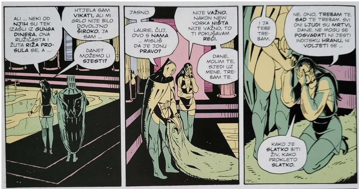
Slika 29 Čuvari, Lauriena reakcija na Veidtova djela, poglavlje 12, 402. str.

Na samom kraju Laurie odlazi posjetiti Sally u kalifornijski starački dom. Priznaje joj da je saznala tko joj je pravi otac i zagrljajem zatvara taj dio svojega života te nastavlja prema novim mogućnostima (slika 30).