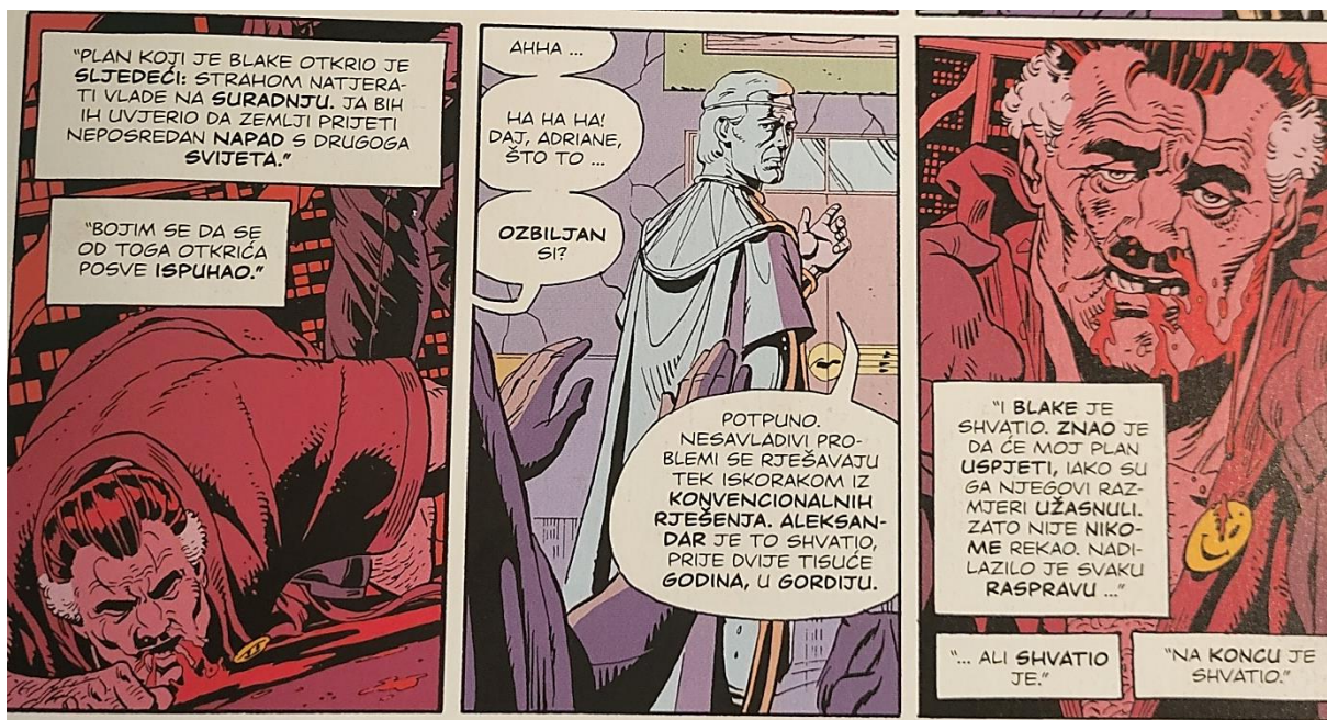
Slika 34 Čuvari, Blake jena koncu shvatio, poglavlje 11, 371. str., © DC Comics

Unatoč amoralnom načinu života, Blake je uspio doći do svog limita kada je slučajno otkrio zavjeru koju je Adrian Veidt pripremao još od raspada Crimebustersa . Naime, dok je bio u zrakoplovu tijekom jedne misije 1985., Blake je primijetio sumnjivu aktivnost na neucrtanom otoku. Odlučio se infiltrirati na otok i tako saznao njegovu svrhu. Ta je spoznaja bila izrazito traumatična (slika 34). Nesposoban podnijeti teret znanja, Blake je provalio u stan Edgara Jacobija, javno poznatog kao Moloch the Mystic, i pijano mu ispričao sve o otoku. Taj događaj Moloch prepriča Rorschachu, a potvrda dolazi od strane Veidta koji Danu i Rorschachu da sve ostale detalje. Adrian Veidt, koji je kontrolirao aktivnosti na otoku i ozvučio Molochov stan iz vlastitih razloga, na taj je način otkrio za Comedianovu infiltraciju te ga je odlučio ubiti. Tako počinje radnja Watchmena .