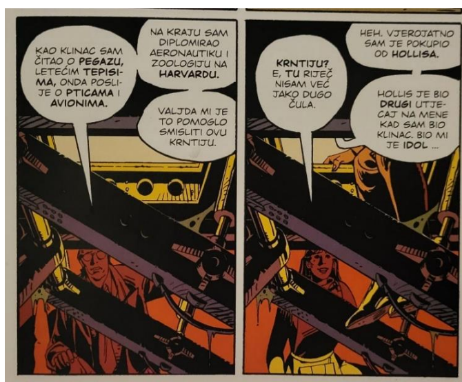
Slika 23 Čuvari, Dan o svome djetinjstvu, poglavlje 7, 215. str., © DC Comics

Kao dijete, Dan je bio introvert fasciniran pticama, zrakoplovstvom, mitologijom i pothvatima svog junaka Nite Owla u borbi protiv kriminala. Omiljene su mu bile priče o Pegazu i letećem tepihu iz mitologije (slika 23).