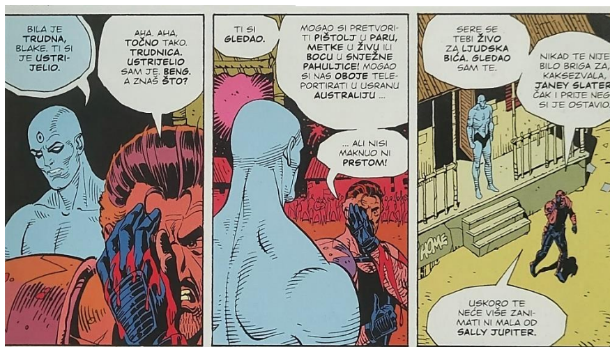
Slika 7 Čuvari, Nisi maknuo ni prstom, poglavlje 2, 55. str., © DC Comics

Međutim, osjećaj identiteta Dr. Manhattana vjerojatno je najčudniji od svih likova u Watchmenu . Dodijeljena mu je titula "superheroja". Nikada nije odlučio promijeniti svoj identitet i nikada nije skrivao svoj prošli život od ljudi koje je poznao. Nije lišen emocija što je primjetno u nekoliko trenutaka koje dijeli s Janey ili Laurie. On u suštini ne gubi dio identiteta koji ga je činio Jonom Ostermanom nego samo kroz djelo sve više i više odustaje od njega.