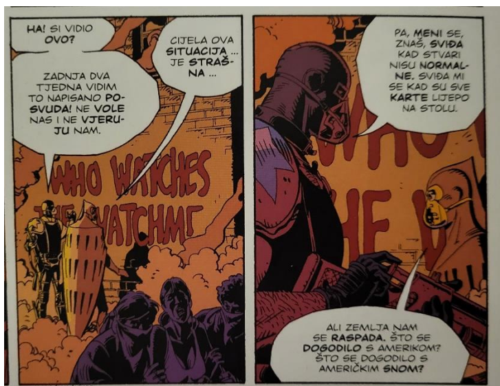
Slika 31 Čuvari Što se dogodilo s američkim snom, poglavlje 2, 58. str., © DC Comics

Comedian je glavni okidač radnje u Watchmenu. Edward Eddie Morgan Blake bio je maskirani osvetnik i paravojni operativac za vladu Sjedinjenih Američkih Država. Blake je bio aktivan četrdeset pet godina uz pomoć sponzorstva vlade i tiska koji su ga predstavljali kao domoljubni simbol rata i pobjede. Najbolji uvid u Blakeov karakter nudi Rorschach: „ Blake je razumio. Tretirao je kao šalu, ali je razumio, vidio je pukotine u društvu, vidio male ljude u Maskama koji ga pokušavaju održati na okupu...Vidio je pravo lice dvadesetog stoljeća i odabrao mu postati odraz i parodija. Nitko drugi nije vidio šalu zato je bio usamljen. Čuo sam jednom vic: Čovjek dođe doktoru, kaže da je deprimiran. Kaže da je život težak i okrutan. Kaže da se čuti samim u neprijateljskom svijetu, a put pred njim nejasan je i nesiguran. Doktor kaže 'Tretman je jednostavan, večeras u našem gradu nastupa veliki klaun Pagliacci. Pođite ga pogledati. To će Vas oraspoložiti!' Čovjek brizne u plač. Kaže: 'Ali, doktore ... Ja sam Pagliacci.'“ (Gibbons & Moore, 2013:67). O Blakeu se saznaje najviše kroz sjećanja ostalih likova s obzirom na to da je na početku radnje ubijen.