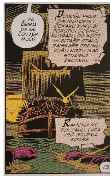
Slika 14 Čuvari, Mornar pliva prema Black Freighteru , poglavlje 11, 359. str., © DC Comics