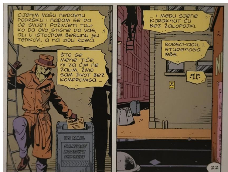
Slika 22 Čuvari, Rorschachov zadnji potez., poglavlje 10, 334. str.