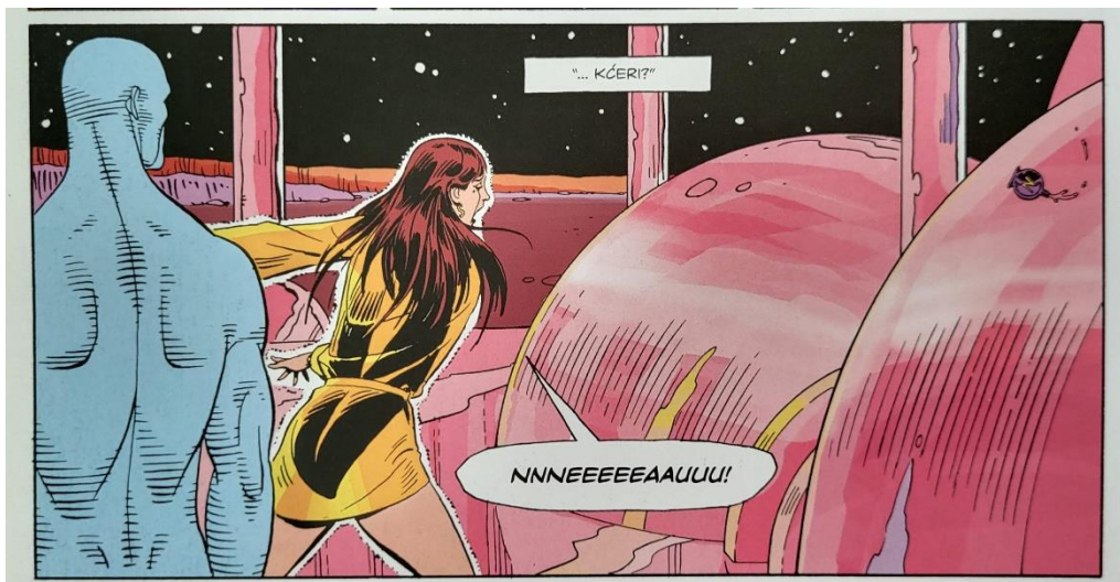
Slika 28 Čuvari, Lauriena spoznaja, poglavlje 8, 302. str., © DC Comics

Laurieno prvo sjećanje bila je noć iz 1954. kada je uhvatila svoju majku i Laurencea, Sallynog supruga, kako se svađaju oko svojih života i toga kako su završili zajedno. U stvarnosti, Laurence je napao Sally zbog još jedne afere s Comedianom. Dok je odrastala, Laurie je znala da Laurence nije njezin pravi otac i uvijek je sumnjala da je njezin pravi otac Hooded Justice zato što su, navodno, Sally i on izlazili tijekom 40-ih godina prošloga stoljeća. To je sjećanje jedan od katalizatora koji izravno utječu na rasplet radnje. Naime, kompletna spoznaja događa se na Marsu gdje ju je odveo Dr. Manhattan kako bi razgovarali. Oni ulaze u raspravu jer postoji ogromna kognitivna barijera koja nijednome ne nudi potpunu transparentnost. Manhattan ju navodi do te spoznaje za koju zna da slijedi, ali nije siguran kako će ona točno utjecati ne samo na Laurie već i na njega. Spoznaja stiže u obliku jedne vrlo jednostavne informacije, a ta je da je njezin otac zapravo Comedian (slika 28).