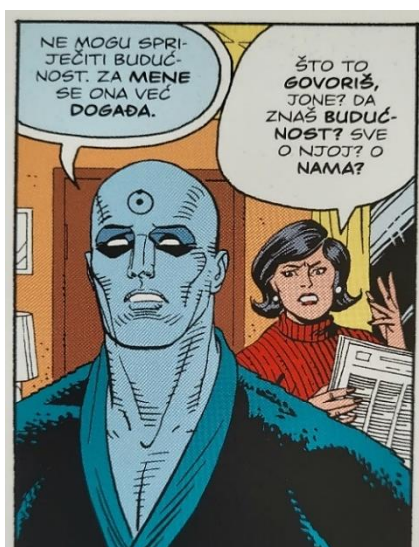
Slika 2 Čuvari, Objašnjenje simultanosti, poglavlje 4, 124. str., © DC Comics

Ime je dobio po Manhattan projektu. Projekt Manhattan bio je istraživački i razvojni pothvat tijekom Drugog svjetskog rata koji je rezultirao pojavom prvih nuklearnih oružja. Dr. Manhattan postupno postaje pijun vlade Sjedinjenih Američkih Država iako sredstva kojima je njegova lojalnost osigurana nisu otkrivena. Snimljen je kako rastavlja pušku, uništava tenk Patton i obznanjen je u javnosti. Taj događaj, spektakulariziran za javnost, prozvan je „Zorom superheroja“.