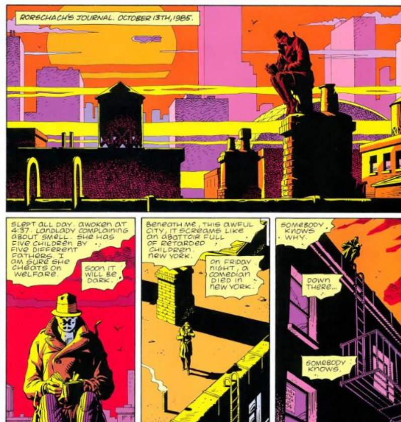
Slika 1 Allan Moore i Dave Gibbons, Watchmen 1987., preuzeto s: https://hyperallergic.com © DC Comics

žanru ili pak samom autoru. Lica čitateljima služe kao indikator emocija, a autorima često kao umjetnička intervencija te nekad i kao izvor simboličkog potencijala. Boje imaju važnu ulogu u svijetu stripa. Crno-bijeli strip i strip u boji dvije su odvojene umjetnosti. Strip u boji je, naravno, popularniji jer od čitatelja traži manji stupanj maštovitosti, a izaziva osjećaj realnosti. Boje sa sobom donose i simboliku koja je dobrodošao aspekt. Najčešća paleta boja rabljena u stripovima, pogotovo u superherojskom žanru, je standardna paleta osnovnih boja crvene, plave i žute. No, i tu ima izuzetaka kao na primjer u grafičkom romanu Watchmen Alana Moorea i Davea Gibbonsa. (slika 1) Oni su se odlučili koristiti sekundarnom paletom koja se sastoji od narančaste, ljubičaste i ružičaste boje, a osnovnim su se bojama koristili sporadično, ali uvijek s visokim stupnjem važnosti. I naposljetku, naracija. Cjelokupni verbalni dio uz nadopunu likovnog čini naraciju odnosno priču u cjelini. Unutar nje čitatelji mogu pronaći književne elemente, a sama naracija ovisi o stilu, smjeru i preferencama autora.