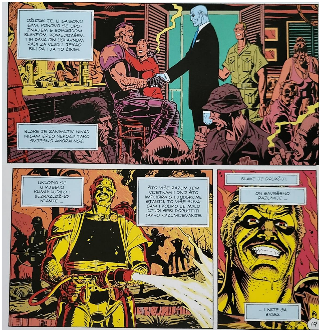
Slika 33 Čuvari, Blake je drukčiji, poglavlje 4, 127. str., © DC Comics

Kako Manhattana prati motiv sata tako Comediana prati značka žutog smajlića. Osim kao njegov simbol, služi i kao simbol cijelog romana, te se često kroz njega pojavljuje u bitnim narativnim trenucima. Krvava mrlja na znački nalikuje strelici sata koja pokazuje 12 minuta do ponoći, što se referira na sat sudnjeg dana koji je na početku romana na 12 minuta do ponoći, a svakim poglavljem se sve više približava uništenju.