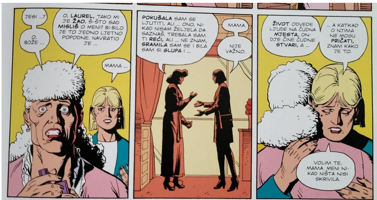
Slika 30 Čuvari, Laurie oprašta majci, poglavlje 12, 409. str., © DC Comics