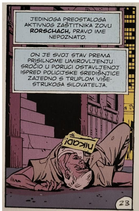
Slika 20 Čuvari, Rorschachov odgovor, poglavlje 4, 131. str., © DC Comics

Rorschachova smrt, za koju je inzistirao da je Dr. Manhattan izvrši, vjerojatno je oblik kompromisa koji mu omogućuje čuvanje njihove tajne, a da zapravo ne pristane na to, i koji je izbrisao jedinu uključenu stranu koja bi bila voljna otkriti informacije. (slika 21) Tajna se odnosi na Veidtov veliki plan izvršen na samom kraju grafičkog romana. Ono što ostali likovi nisu znali jest da je Rorschach netom prije odlaska na svoju posljednju misiju isporučio svoj dnevnik novinama New Frontiersman koje se spominju kroz cijelo djelo i tako čitateljima osigurao otvoreni kraj (slika 22).