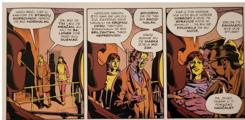
Slika 24 Čuvari, Danova opravdanja,, poglavlje 7, 219. str., © DC Comics

Najočitiji način na koji se Watchmen poigrava ovim konceptima je korištenje superheroja. Dan, na primjer, ima drugi identitet u Noćnoj ptici koji skriva od javnosti. Pokušava se odvojiti od vremena koje je proveo kao osvetnik zaključavajući svu svoju staru opremu i memorabilije vezane za njegovu bivšu karijeru u svoj podrum, ali ne može se u potpunosti odvojiti od toga. Nite Owl je Dan, bez obzira na to što je Nite Owl sve što Dan nije: hrabar, jak, heroj i nekada davno omiljen. Zatvaranjem Nite Owla, Dan zapravo pokušava zaključati dijelove vlastite osobnosti i živjeti skromnijim životom koji zapravo ne predstavlja tko je on, što dovodi do njegove usamljenosti i žaljenja kasnije u životu. On se pokušava opravdati i stvoriti neki smisao u svojim osjećajima, no to na kraju ispada samo kontraproduktivno. Dan tako predstavlja tipičnog junaka koji je često samo 'neki' tip, svakodnevan i standardan (slike 24 i 25). On je najbliže što se može zvati tradicionalnim junakom uz postmoderni zaokret prema preispitivanju vlastite važnosti i sposobnosti. Problem impotencije i samopouzdanja dolazi u pitanje više puta u djelu, a jedini odgovor koji je spreman ponuditi glasi: „Aha, pretpostavljam da kostimi imaju neke veze s tim. Ali je čudan osjećaj, znaš? Tako otvoreno to nekome priznati. Istupiti iz ormara. Samopouzdan sam kao da gorim. I svi maskosjeci, svi ratovi svijeta samo su slučajevi... Samo problemi koje treba riješiti.”(Gibbons & Moore, 2013:238).