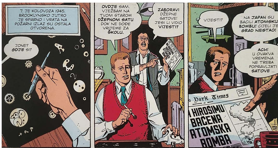
Slika 4 Čuvari, Mladi Jon Osterman, poglavlje 4, 111. str., © DC Comics

1959. godine preselio se u istraživačku bazu u Gila Flatsu gdje su se izvodili eksperimenti vezani s 'unutarnjim poljima' fizičkih objekata koji su, ako ih se dira, rezultirali njihovim raspadanjem. Tamo je upoznao Janey Slater, kolegicu znanstvenicu, s kojom je stupio u vezu. Nesreća koja je izazvana minimalnom ljudskom pogreškom, predstavlja prekretnicu u Jonovoj potencijalnoj budućnosti. On je, naime, slučajno zaboravio ručni sat, koji ujedno postaje i njegov simbol kroz cijelo djelo, u prostoriji gdje se provode već spomenuti eksperimenti. U četvrtom poglavlju Dr. Manhattan kroz niz sjećanja postavlja temelj svojega stava vezanog uz vrijeme, prolaznost i generalnu nemoć pojedinca da uistinu izazove neku promjenu.