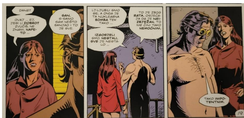
Slika 25 Čuvari, Danovi osjećaji, poglavlje 7, 229. str., © DC Comics