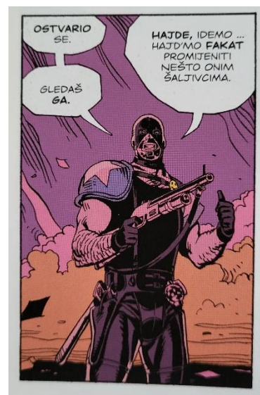
Slika 32 Čuvari, Američki san, poglavlje 2, 58. str., © DC Comics

Dok je bio u Saigону, udružio se s Dr. Manhattanom koji se pridružio ratnim naporima u ožujku 1971. Zajedno su odigrali glavnu ulogu u ratu SAD-a s Vijetnamom. Ubrzo nakon što su moći Manhattanu prisilile Sjeverne Vijetnamce na potpunu predaju, Blake se suočio s Vijetnamkom kojoj je očito napravio dijete. Otvoreno joj je rekao da planira odmah otići iz zemlje bez nje, a ona mu je u bijesu razbijenom bocom ozlijedila lice. Blake ju je upucao i ubio što je već viđeno na slici 7. Njegova je ozljeda dovela do unakazujućeg ožiljka koji mu se