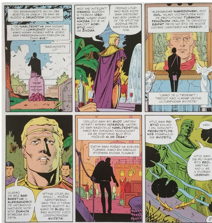
Slika 10 Čuvari, Veidtovo hodočašće, poglavlje 11, 354. str., © DC Comics

Po smrti roditelja odlučio je krenuti na hodočašće fizičkog, mentalnog i duhovnog otkrića, slijedeći rutu Aleksandra Velikog, koji je njegovo idol iz djetinjstva i imenjak. Učinio je to jer se zbog svog intelekta osjećao usamljeno, a u svojim suvremenicima nije vidio izvor zadovoljstva (slika 10). To hodočašće provodi ga kroz Mediteran, Malu Aziju i nekadašnju drevnu Perziju. Veidt je otišao u sjevernu Tursku kako bi ponovno slijedio put svog idola do vladavine sa željom da izjednači svoja postignuća i donese doba prosvjetljenja mračnom svijetu. Putovao je obalom Crnog mora zamišljajući Aleksandrovu vojsku kako kroz krvavi rat zauzima luku za lukom. Otputovao je na sjever prema Gordiju podsjetivši se na Aleksandrov uspjeh u rješavanju nerješivog Gordijskog čvora. Zatim je krenuo na jug u Egipat kroz Memfis. Sa strahopoštovanjem je gledao u ruševine kojima su nekoć vladali faraoni starog Egipta poput Ramzesa II. Veidt je nastavio svoje putovanje kroz Babilon, preko Kabula do Samarkanda, zatim niz Ind. Proputovao je Kinu i Tibet. Na Tibetu se susreo sa skupinom redovnika od kojih je naučio kako koristiti potpuni kapacitet svog mozga, a čak je dobio i kuglicu hašiša. Zatim se vratio u Babilon na mjesto Aleksandrove smrti. Tu Veidt prepoznaje Aleksandrove neuspjehe vidjevši da nije uspio ujediniti svijet niti je izgradio jedinstvo koje bi ga nadživjelo.