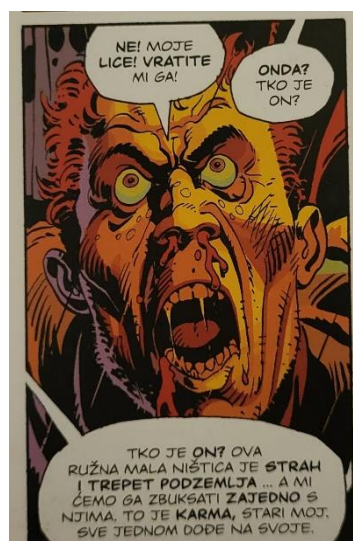
Slika 17 Čuvari, Walter Kovacs bez maske,, poglavlje 5, 170. str., © DC Comics