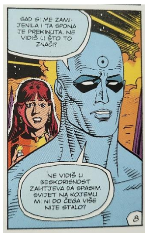
Slika 6 Čuvari, Nije mu stalo do ljudi, poglavlje 9, 286. str., © DC Comics