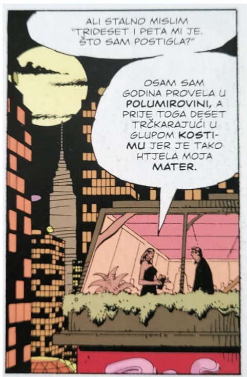
Slika 26 Čuvari, Laurie se žali Danu, poglavlje 1, 31. str.

Isto kao i Dan, Laurie Jane Juspeczyk druga je po redu nošenja svog superherojskog imena. Prethodnica je bila njezina majka Sally Jupiter. Sally je svoju kćer gurnula u obiteljski posao borbe protiv kriminala. Laurie nikada nije bila previše zainteresirana da postane nasljednica svoje majke. To i sama naglasi više puta (slike 26 i 27): „Je l'? E pa i običan život, moj život je isto "kaotični teren"... Ili je to preapstraktno i neprebrojivo? To jest, ako te tako fasciniraju stijene izvijene u čudne oblike, tad si, Isusa ti, trebao vidjeti mene prije nego sam tebe srela! Moja mi je majka erodirala pubertet, klešući me u figuru kakvu bi ona imala da nije imala mene. Natjerala me u pustolovine, dižući strku oko 'moje karijere', pokušavajući živjeti kroz mene..." (Gibbons & Moore, 2013:292). Možda se ponosi svojim poljskim podrijetlom, što bi djelomično moglo objasniti njeno inzistiranje da je zovu pravim prezimenom. Ona je glasna u svojim feminističkim i humanitarnim brigama i prilično je sposoban borac, a na početku priče pokazuje se kako ima zategnut odnos sa svojom majkom, iz već spomenutih razloga, što je još jedan razlog zašto joj se ne sviđa ime Jupiter. Njezini feministički stavovi vide se u tome što većinu aspekata vezanih uz javne identitete nje, a prije i njezine majke, smatra degradirajućim (kostime, pitanja, očekivanja itd.).