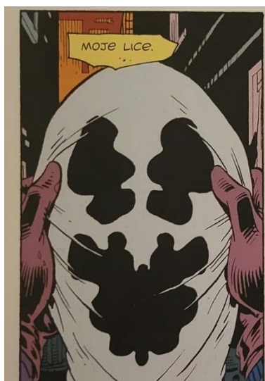
Slika 16 Čuvari Rorschachova maska,, poglavlje 5, 160. str., © DC Comics