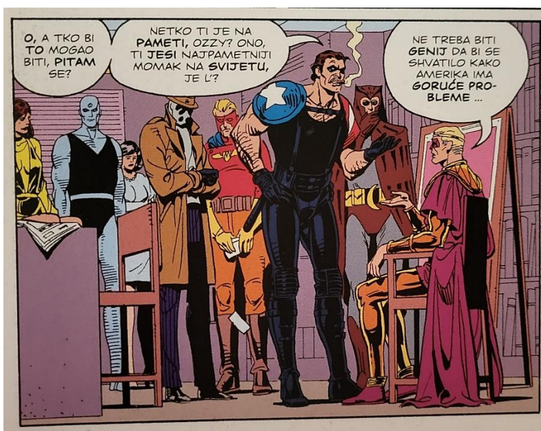
Slika 9 Čuvari, Najpametniji momak na svijetu, poglavlje 2, 50. str., © DC Comics

Kao dijete Veidt je bio smatran čudom iako se trudio prikriti svoju inteligenciju. Nakon smrti roditelja, Veidt je sa 17 godina naslijedio njihovo značajno bogatstvo, ali je sve odlučio dati u dobrotvorne svrhe kako bi mogao pokazati da je sposoban postići bilo što počevši ni od čega. Krajem 1958. Veidt je usvojio odjevni stil Aleksandra Velikog i grčko ime Ramzesa II. kako bi postao kostimirani pustolov poznat kao Ozymandias. Debitirao je razbijanjem velikog kruga krijumčara opijuma i heroina. Posebno se usredotočio na uništavanje sindikata organiziranog kriminala koji je vodio Moloch the Mystic. Njegovi pothvati u borbi protiv kriminala priskrbili su mu reputaciju u kriminalnom podzemlju zbog njegovih atletskih sposobnosti i visokog intelekta, koji mu je priskrbio i titulu "najpametnijeg čovjeka na svijetu" (slika 9).