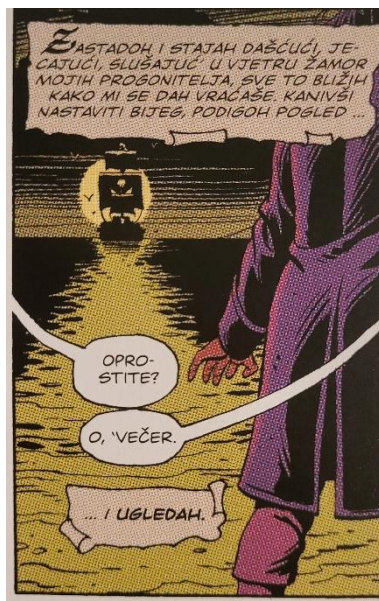
Slika 13 Čuvari, Black Freighter čeka mornara na pučini, poglavlje 11, 359. str., © DC Comics

preživio napad. Spaja splav napravljen od plinom napuhanih tijela njegovih mrtvih suputnika i očajnički odlazi kući kako bi upozorio svoju obitelj jedući galebove koji lete dovoljno blizu, pije slanu vodu i bori se s morskim psima koje su privukla plutajuća tijela. S vremenom pomorac gubi zdrav razum i bira ludilo samo kako bi otkrio da je stigao kući, i odmah kreće u juriš ubijajući dva jahača koja su naletjela na njegov splav na plaži. Kada stigne do svog starog doma, za koji sada zna da su ga zauzeli gusari Black Freightera , ubija prvu osobu koju vidi samo da bi otkrio da je to njegova žena. Sada uistinu sam, pomorac u šoku i užasu bježi iz svog doma i otpliva na more gdje ga čeka Black Freighter (Slike 13,14 i 15).