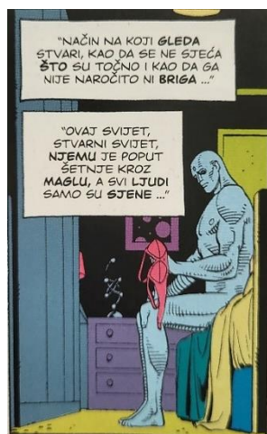
Slika 5 Čuvari, Svi ljudi za njega su sjene, poglavlje 3, 83. str., © DC Comics

Dr. Manhattan je u teoriji mogao u potpunosti spriječiti izrazito važne narativne trenutke koji su na kraju djela kulminirali u ogromnoj tragediji, no on to nije učinio. Iz više izvora u djelu saznaje se da Manhattan gubi osjećaj za to što znači biti čovjek (slike 5,6, i 7). Tom idejom su se autori odlučili poigravati. Glavna pitanja kojima su se vodili bila su: „Što kada bi Superman uistinu postojao? Bi li bio dobar lik? Ili bi zbog svoje odvojenosti od običnog čovjeka bio emotivno preudaljen?”.