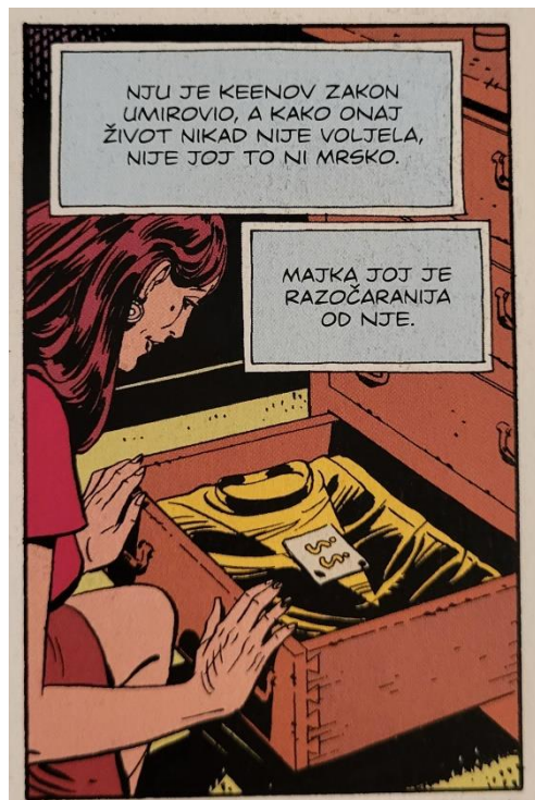
Slika 27 Čuvari, Keenov zakon ju je umirovio, poglavlje 4, 131. str., © DC Comics