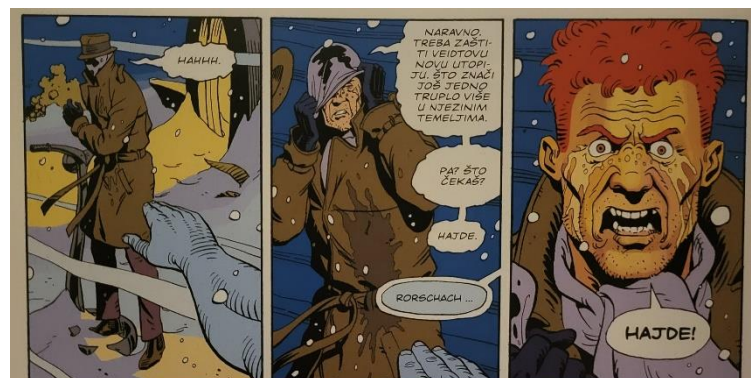
Slika 21 Čuvari, Rorschachova smrt., poglavlje 12, 404. str., © DC Comics