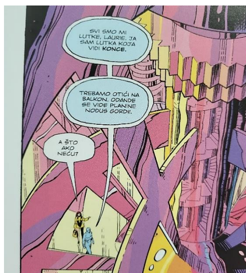
Slika 3 Čuvari, Lutka koja vidi konce poglavlje 9, 283. str., © DC Comics