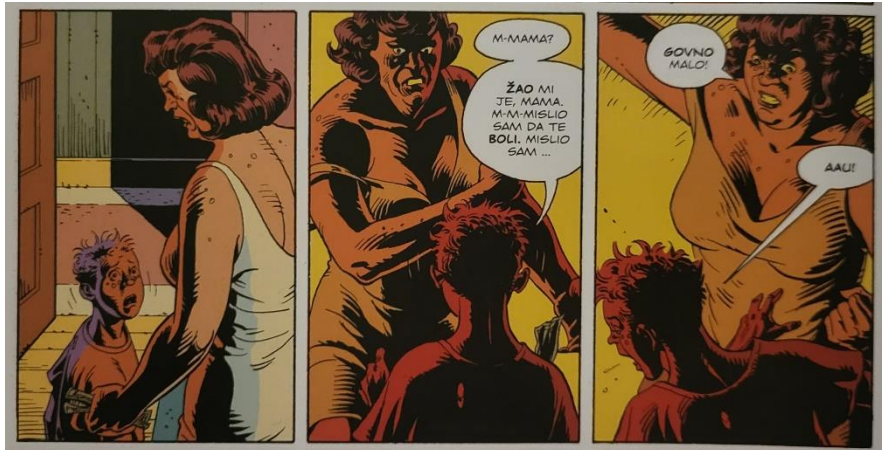
Slika 18 Čuvari, Kraj stripa u stripu., poglavlje 6, 180. str., © DC Comics

Kovacs je odrastao u nasilnom domaćinstvu sve dok nije stavljen pod državnu skrb u Charlton domu za nezbrinutu djecu, nazvanom po Charlton Comicsu (slika 18.). Nakon što je izašao iz udomiteljstva, našao je posao kao konfekcijski radnik, ali mu je to ubrzo postalo dosadno jer mu u to vrijeme nije služilo pravoj svrsi. Nakon što je čuo okolnosti smrti Kitty Genovese, Kovacs se razočarao u skrivenu apatiju koju je vidio kao svojstvenu većini ljudi.