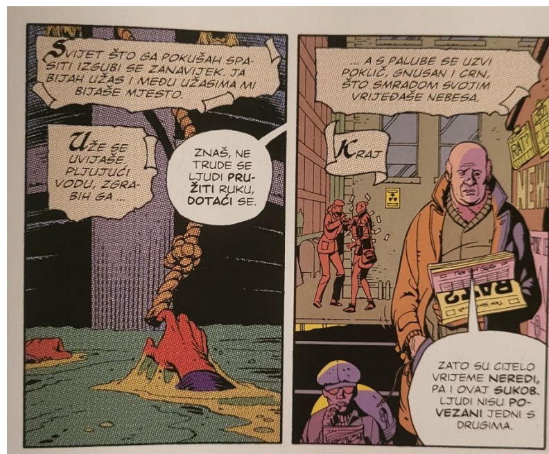
Slika 15 Čuvari, Kraj stripa u stripu., poglavlje 11, 369. str., © DC Comics