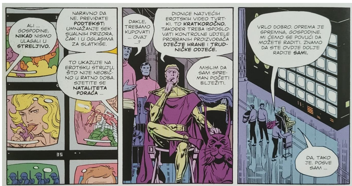
Slika 12 Čuvari, Veidtova promišljanja o tržištu, poglavlje 10, 320. str., © DC Comics

poziciju koju više nije toliko lako opravdati (slika 12). „Iako je takva marketinška strategija svakako relevantna i doista uspješna u kontekstu društvenih previranja, mislim da moramo početi uzimati u obzir činjenicu da takvo stanje, ovako ili onako, ne može zauvijek potrajati. Jednostavnije rečeno, trenutačne okolnosti u kojima se naša civilizacija nalazi odvest će nas u rat ili neće. Ako nas povedu u rat, i naši najbolji planovi postaju nebitni. Ako potraje mir, nagađam da je vjerojatan novi uzlet društvenoga optimizma, što znači promjenu imidža Veidtove kozmetike, usmjerene na novoga kupca.”(Gibbons & Moore, 2013:343). Tu bi se čitatelji mogli igrati đavoljeg odvjetnika i reći kako je njegov ekonomski uspjeh zapravo bio sredstvo kojim je on postigao svoj veliki plan, i što je najzanimljivije, ne bi bili u krivu. Veidt Enterprises , i sve potkompanije koje im pripadaju, svojom linijom proizvoda omogućile su Veidtu provođenje plana bez potrebe miješanja i nagovaranja vanjskih stranki. Osim tih tmurnih činjenica, njegovi proizvodi pomažu svijetu Watchmena stvoriti osjećaj realnosti pomoću raznih reklama ili baš izravnih proizvoda koji se često pojavljuju u kadrovima.