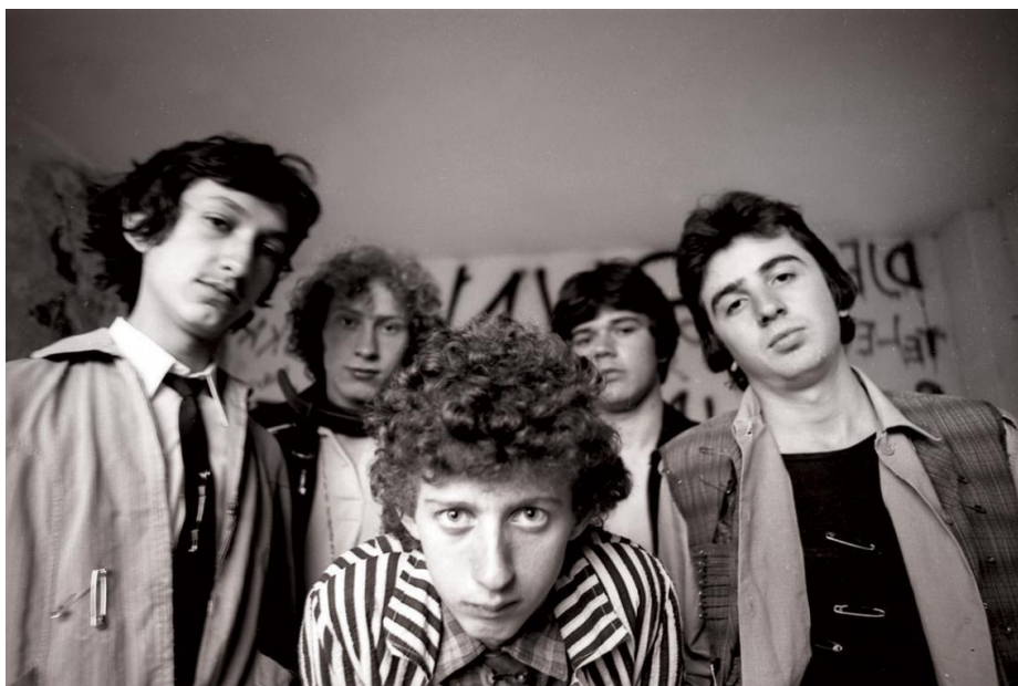
Prilog 4. Prljavo Kazalište