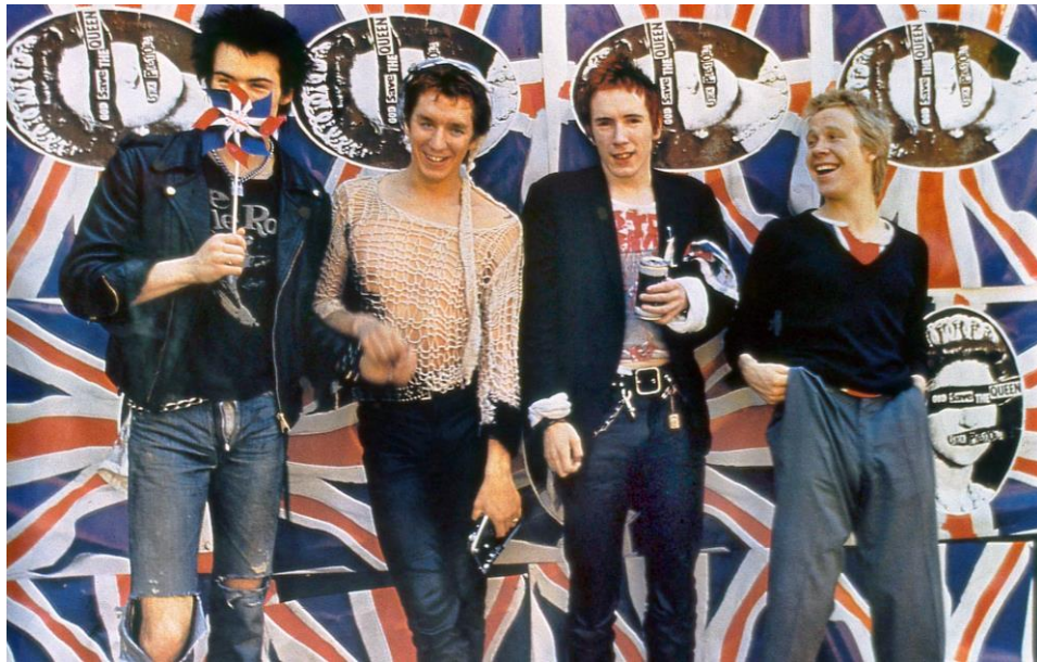
Prilog 1. Sex Pistols

Iako su djelovali od 1974. godine dvadesetog stoljeća, američki punk sastav Ramones nije bio taj koji je doveo punk među jedan od najpoznatijih glazbenih žanrova, zbog toga što tekstovi pjesama nisu usredotočeni na političke teme. Popularnost punka eksplodirala je probojem britanskog sastava Sex Pistols. Oni su opisani kao mladići koji su „svojim prostačkim, destruktivnim i provokativnim nastupom do te mjere iziritirali britansku javnost da su bili podvrgnuti cenzuri.“ (Strongman, 2007: 203) Njihov singl God Save The Queen bio je zakonski zabranjen i nije uvršten među najprodavanije singlove.