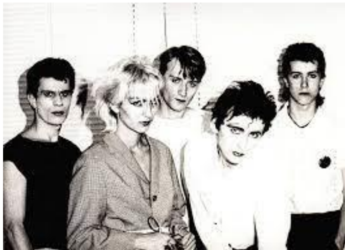
Prilog 3. Paraf (u drugoj postavi)

Tek su 1977. godine u Rijeci Parafi održali svoj prvi punk nastup koji se smatra prvim punk rock koncertom u Jugoslaviji, a pjesme koje su Parafi izveli prve su punk skladbe s područja Jugoslavije.