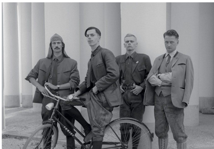
Prilog 8. Laibach

Osamdesetih godina, nakon smrti Tita, u Jugoslaviji je vladala kriza i atmosfera u državi je bila osjetno negativna te je nacionalizam jugoslavenskih republika sve više jačao, što nije za svakoga bilo pozitivno. Tako je i odnos prema novom valu od strane države bio sve gori. Posebno se isticao slovenski bend Laibach zbog svog korištenja nacističkih simbola u spotovima i nastupima te zbog njihove najveće inspiracije, Adolfa Hitlera. Svojim su pjesmama toliko izazivali vlast i društvo da je i alternativna publika bila zgrožena. Jedna od najvećih provokacija benda bio je plakat koji su osmislili zajedno sa ostalim članovima njihove NSK države. Plakat iz 1987. godine bio je izrađen povodom Dana mladosti, a inspiracije je bio plakat njemačkog umjetnika Richarda Kleina. Na njemu su umjesto originalnih nacističkih simbola kukastog križa i njemačkog orla, NSK-ovci stavili komunističke simbole: srp i čekić te crvene zvijezde. Također, zbog svog televizijskog nastupa u kojem su izložili svoje svjetonazore i stajališta koji je izazvao zgražanja, upotreba imena Laibach bila je nekoliko godina zabranjena te su njihovi nastupi u Jugoslaviji bili spriječeni. Te su zabrane Laibachu pomogle da ostvari karijeru na globalnoj razini.