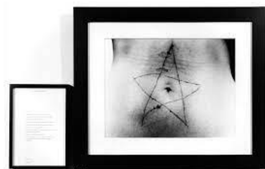
Prilog 2. Motiv petokrake zvijezde u jednom od performansa Marine Abramović

koje država nanosi individui i upisuje se u njezino tijelo.“(Memić, 2019: 47) Još neki od važnih umjetnika performansa su grupa Bosch + Bosch, Crveni Peristil, Vlasta Delimar, Tomislav Gotovac, itd.