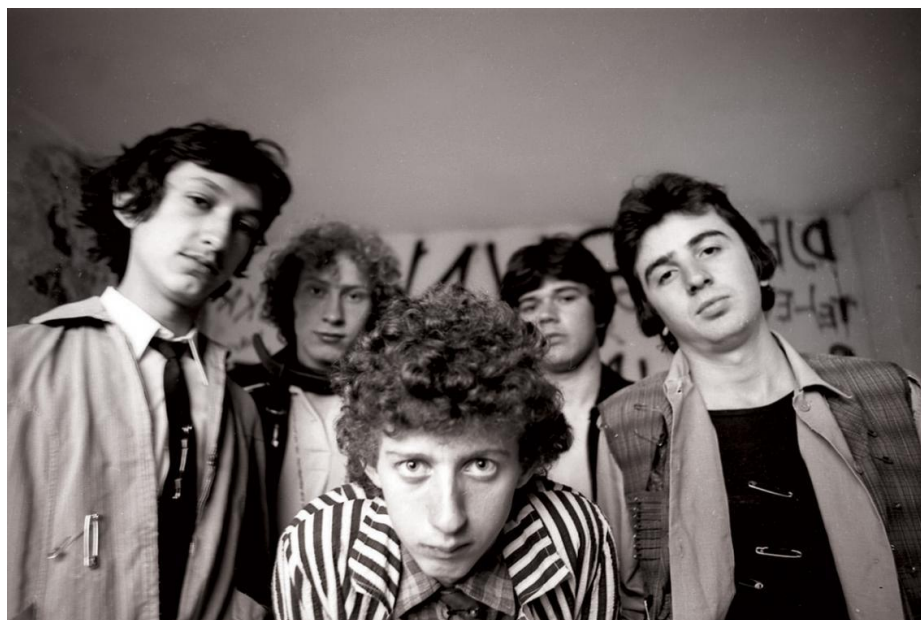
Prilog 4. Prljavo Kazalište

drugu singlicu Moj je otac bio u ratu/Noć , a svojom produkcijom i sviranjem pomaže im novovalni glazbenik Ivan Piko Stančić. Godine 1979., izdali su istoimeni album koji je doživio velik uspjeh, a na taj se album plaćao i tzv. porez na šund (koji je određivala šund komisija). Ovaj je album prepun društvenih kritika i provokativnih tema, npr. u jednoj od pjesama govori se o homoseksualnosti. Album su dodatno promovirali kad su na Tašmajdanu u Beogradu nastupili kao predgrupa Bijelom Dugmetu. Krajem 1979., bend se okreće novom pravcu, novom valu, u kojemu u fokus stavljaju svoje glazbeno stvaralaštvo. Mijenjaju i modni izričaj te nastupaju pred sve većom publikom. Krajem 1980. godine, izdaju album Crno bijeli svijet , kojeg je obilježio ska zvuk. Prodan je u 180 000 primjeraka, što je dotad najveći komercijalni uspjeh novog vala u Jugoslaviji. Bend postaje sve popularniji, što teško podnosi pjevač Davorin Bogović, koji zbog toga napušta bend, a ulogu pjevača na trećem albumu Heroj ulice iz 1981. godine, preuzima Jasenko Houra. Prljavci su na ovom albumu više okrenuti standardnom rocku.