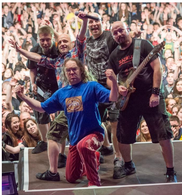
Prilog 9. Hladno pivo

Jedan od najpoznatijih i najdugovječnijih hrvatskih punk rock bendova je Psihomodo pop, koji od 1983. godine nastupa diljem regije. Izdali su jedanaest studijskih albuma te otpjevali velik broj pjesama uz koje su odrasle mnoge generacije. Neke od najpoznatijih pjesama su: Ja volim samo sebe , Mila , Sexy magazin , Ramona , Osjećam se haj i mnoge druge. Bend i dalje nastupa po Hrvatskoj i susjednim zemljama, a privlači i mlađu (alternativnu) publiku.