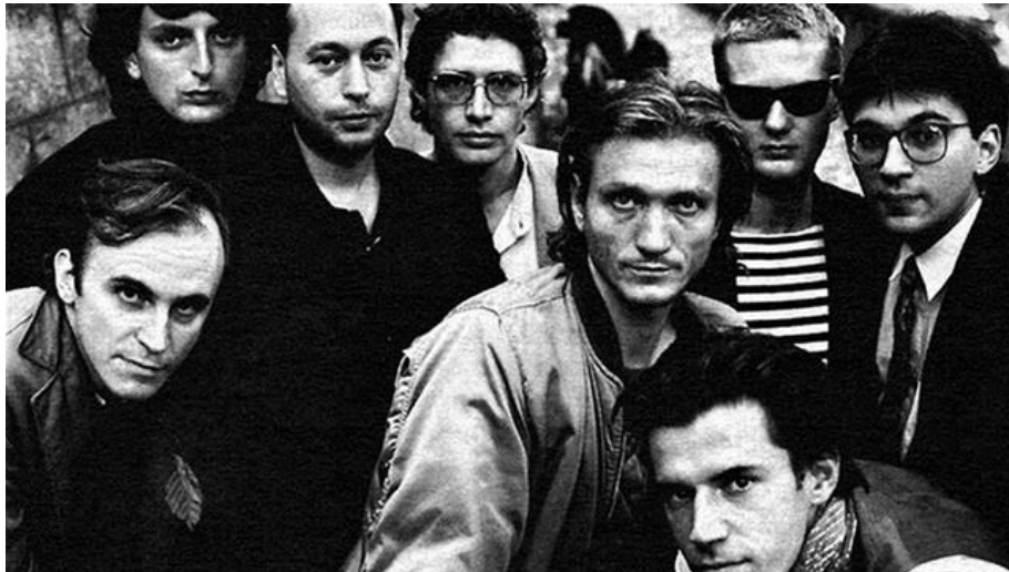
Prilog 7. Haustor