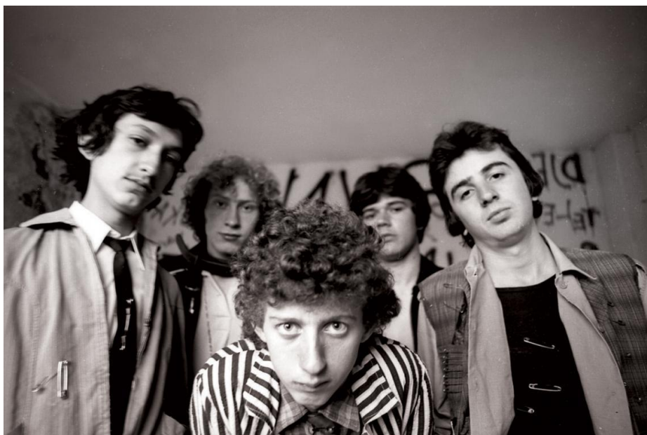
Prilog 4. Prljavo Kazalište