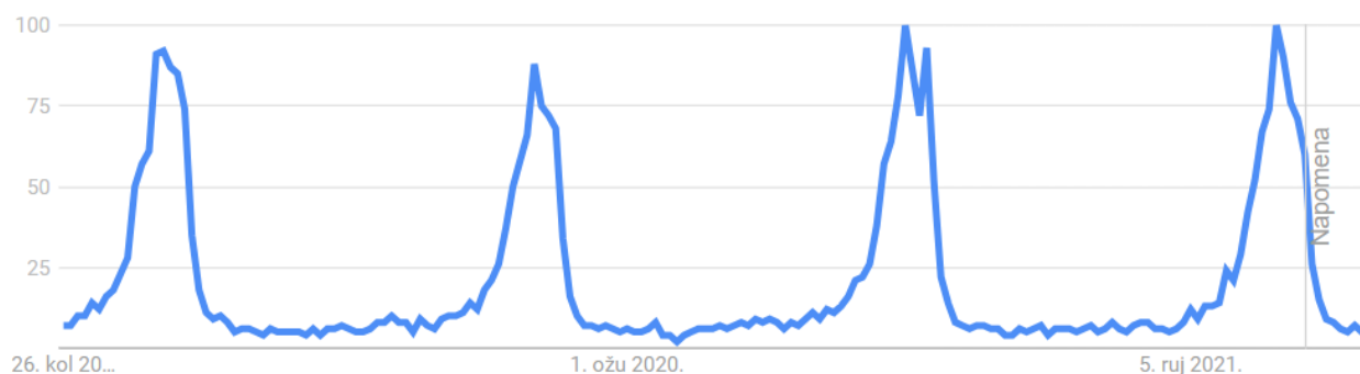
Tablica 1: : interes za pretraživanje pojma Nutcracker u tražilici tijekom 5 godina

Prema Google trendsu, na grafu možemo vidjeti rastući interes pretraživanja pojma Nutcracker (Orašar) u tražilici. Od zimskih mjeseci 2018. do zimskih mjeseci 2022. kada traje sezona Orašara , primijećen je kontinuirani porast pretraživanja. Zbog koronavirusa 2020. taj je interes bio smanjen, ali već je iduće godine nastavljen trend rasta. Najveći interes u pretraživanju bilježe Sjedinjene Američke Države, zatim Ujedinjeno Kraljevstvo, Kanada, Irska i Australija.