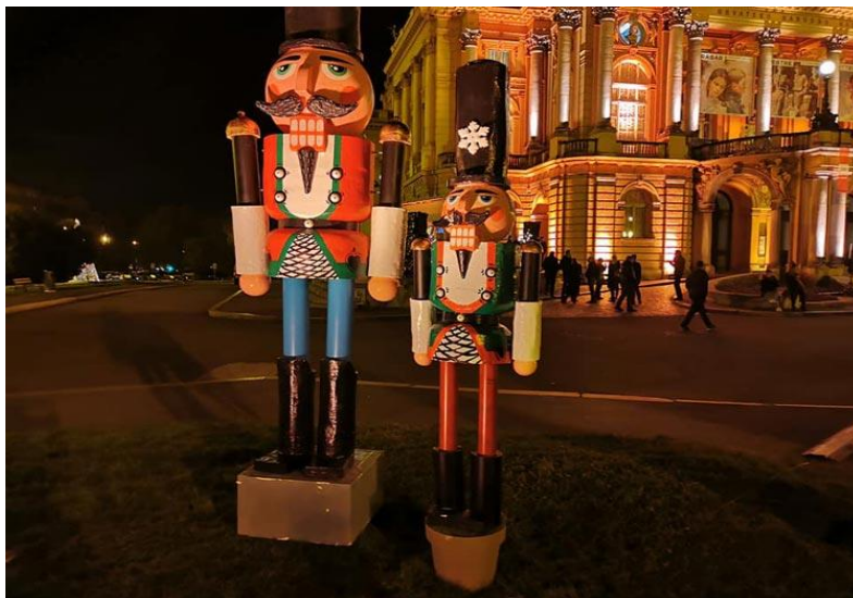
Slika 2: Orašari na zagrebačkom trgu, Advent 2019.