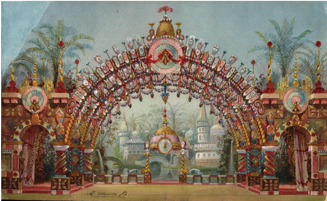
Slika 1: K.M.Ivanov, Nacrt scenografije baleta Ščelkunčik, II čin – Dvorac slatkiša, Rusija, Sankt Peterburg, 1892

Orašar je premijerno izveden u Rusiji 1892. godine. Kako piše Fisher (2003), Orašar je nastao za vrijeme ruske kraljevske obitelji kada su baleti i opere privlačili kraljevstvo i elitu u kazališta. Već je spomenuto kako publika u početku nije dobro primila balet Orašar .