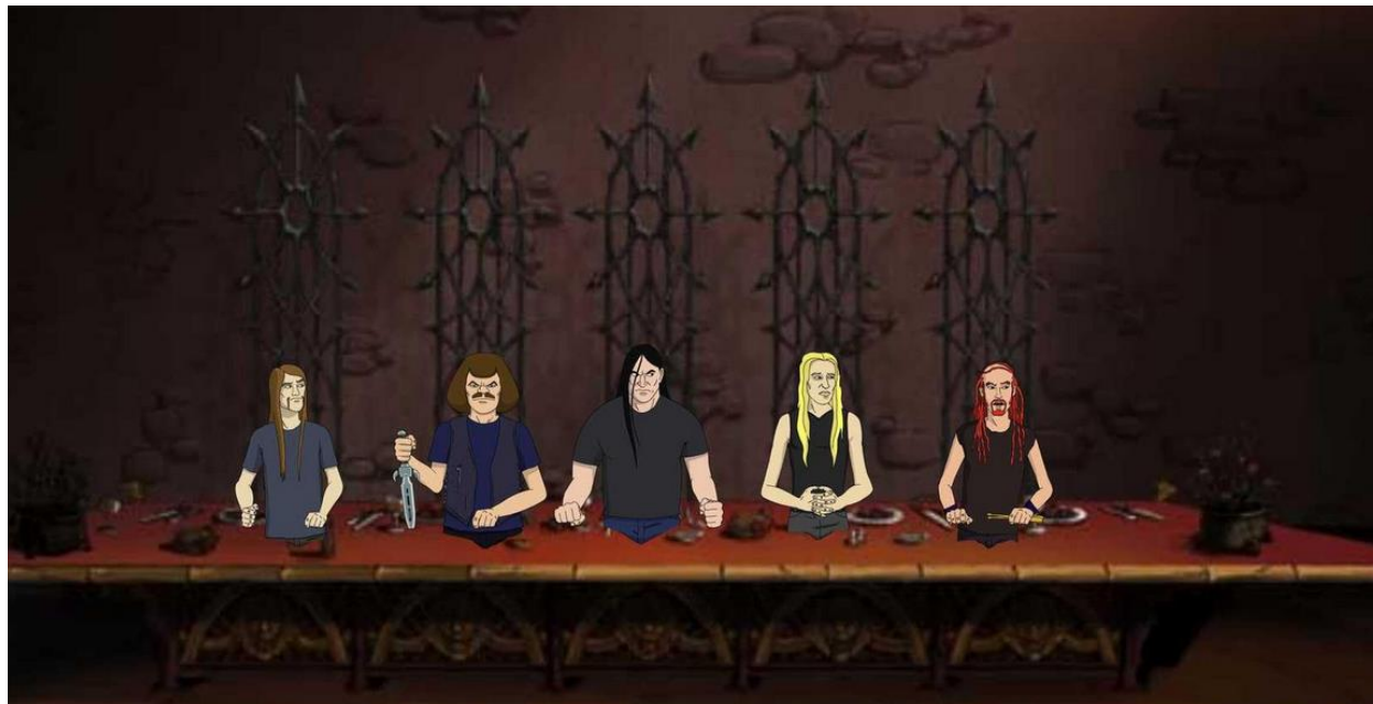
Slike br. 12 „Fiktivni bend iz serije – Dethklok“

ekstremne osobnosti i pretjerane osobine, odražavajući pretjeranu prirodu metal žanra. Serija na duhovit način istražuje živote i avanture članova benda, satirizirajući različite aspekte glazbene industrije i heavy metal kulture.