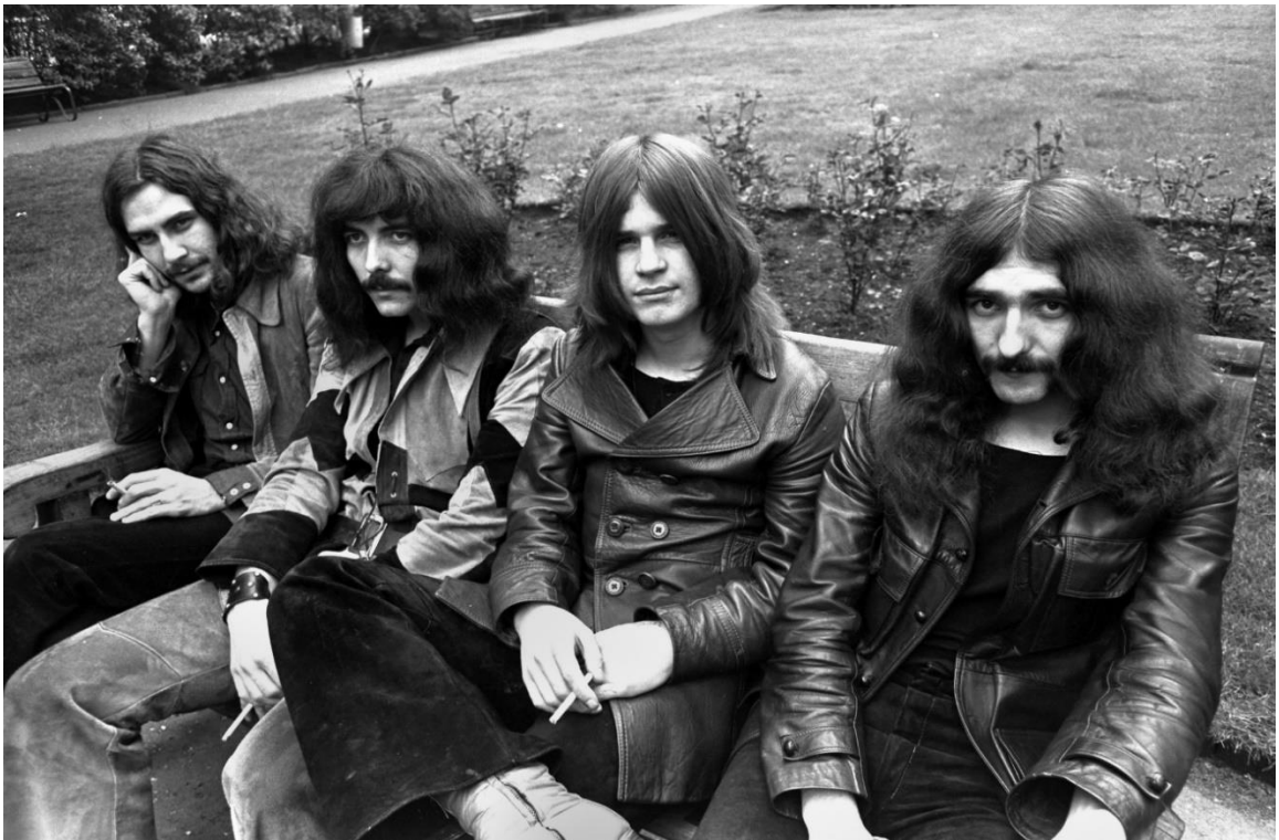
Slika br. 4: „Black Sabbath“

Iz Birminghama je došao Black Sabbath, prvi metal bend ikada. Heavy metal odražavao je raspoloženje obespravljene mladeži na marginama društva. Poput punk scene koja je nastala gotovo paralelno, heavy metal izričajem ustajalo se protiv establišmenta, ali odvojeno od punka , razvio se u svoj žanr koji prihvaća bijeg od stvarnosti u fantaziju na način na koji punk to nije imao namjeru učiniti. Raspoloženje i zvuk metal glazbe duboko su ukorijenjeni u hard rocku 1960-ih, crpe inspiraciju iz grupa kao što su Led Zeppelin i Cream (Pearlin, 2014). Tvornički život nije utjecao samo na teme heavy metal glazbe nego i na opći ton. Gitarist Black Sabbath, Toni Iommi izgubio je vrhove prstiju u tvorničkoj nesreći te kako bi lakše svirao, morao je olabaviti žice. To je dovelo do tamnijeg, mutnog zvuka.