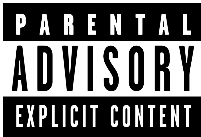
Slika br. 7: „Naljepnica PMRC-a“

„Današnja heavy metal glazba kategorički se razlikuje od prijašnjih oblika popularne glazbe. Sadrži element mržnje, podlosti duha. Glavne teme su joj ekstremno nasilje, ekstremna pobuna, zlouporaba supstanci, seksualni promiskuitet te perverzija i sotonizam. Ne znam osobno nijedan oblik popularne glazbe prije koji je kao jedan od svojih središnjih elemenata imao element mržnje. Martin Luther je rekao: „Glazba je jedan od najvećih darova koje nam je Bog dao; ono je božansko i stoga je Sotona njegov neprijatelj. Jer uz njegovu pomoć, mnoga se strašna iskušenja svladavaju; vrag ne ostaje gdje je glazba” (Weinstein, 2000: 2).