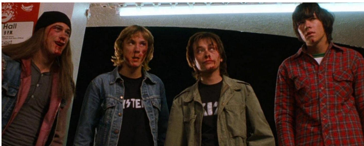
Slika br. 8 „Scena iz filma Detroit Rock City“

ali zbog njegove povezanosti s rock and roll glazbom i automobilizmom jednostavno se bolje uklopio u pjesmu. Sama pjesma bila je veliki odmak od dotadašnjeg KISS-ovog opusa zbog odmaka od pjesama posvećenih zabavi i glazbi, dionizijske teme, kako bi ih Weinstein opisala. Sam film nije ni približno mračne tematike kao i istoimena pjesma. Većina filma posvećena je lovu na ulaznice za koncert, koje junaci filma svako malo dobiju pa izgube. Naravno, jedan od problema im je i kako prijeći put od Clevelanda do Detroita. Lokacije sigurno nisu izabrane nasumično. Prvo, zbog relativne blizine od 200-tinjak kilometara udaljenosti, moguće je da četiri tinejdžera prijeđe taj put samostalno u relativno kratkom vremenu. Nadalje, u Clevelandu se nalazi Rock and Roll kuća slavnih, koja je otvorila svoja vrata još 1983. godine. Detroit, s druge strane, također ima glazbenu pozadinu i to ne samo s rock and rollom , nego i s gotovo svim popularnim žanrovima glazbe, od soula , jazza , gospela , techna do rapa . Zaplet filma počinje osvajanjem ulaznica za koncert, koji im roditelji naravno brane. Odnos roditelja prema glazbi vrlo je sličan stvarnim događajima i kontroverzama povezanim s PMRC-om. Glazba, ponašanje i stil oblačenja dovodi se u vezu s divljaštvom, poganošću i čistim zlom.