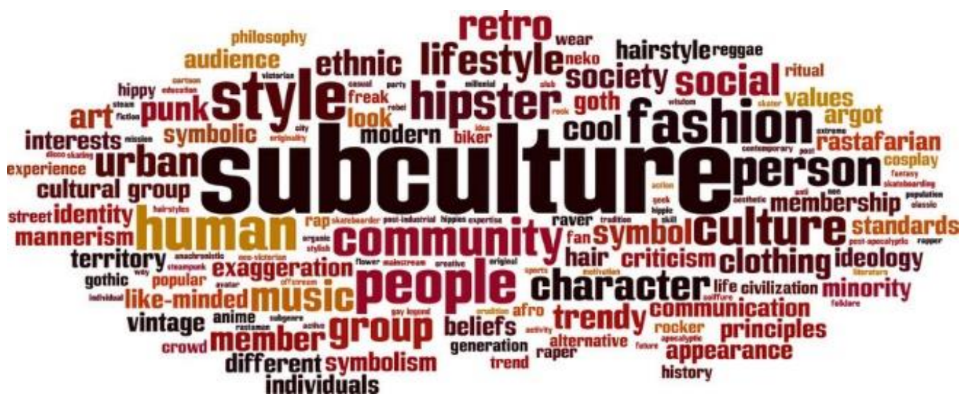
Slika br. 3 „Pojmovi vezani uz supkulturu“

Hebdigeov rad legitimizirao je akademsko proučavanje supkultura temeljenih na glazbi i dotaknuo se onoga što je postalo glavna tema u supkulturnim studijama: formiranje grupnog identiteta kroz razlike, te važnost i stvaranje supkulturnog stila metodom „uradi sam“, prisvajanje mainstream stilova za služenje subverzivnim svrhama te putanja supkultura koje neizbježno postaju uključene u mainstream . Kritika i analiza supkulture sastavni je dio suvremenih supkulturnih istraživanja.