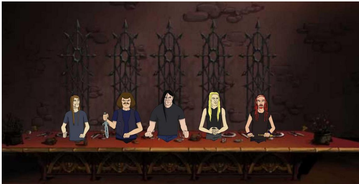
Slike br. 12 „Fiktivni bend iz serije – Dethklok“

ekstremne osobnosti i pretjerane osobine, odražavajući pretjeranu prirodu metal žanra. Serija na duhovit način istražuje živote i avanture članova benda, satirizirajući različite aspekte glazbene industrije i heavy metal kulture.