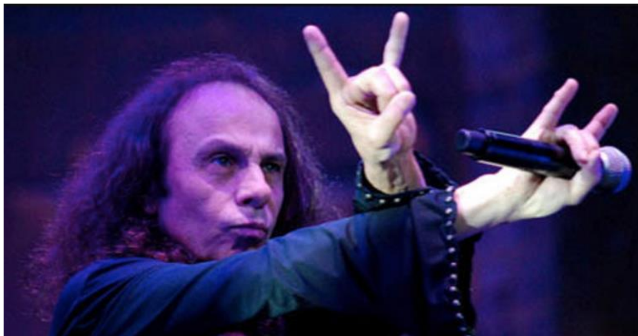
Slika br. 6: „Dio i znak rogova“

sam prvi to učinio. Kažem jer sam to radio toliko da je to postalo nekakav simbol rock and rolla “ (Trapp, 2021).