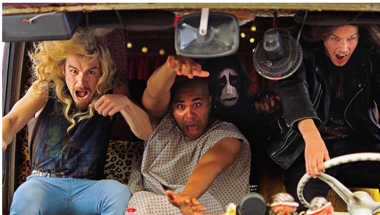
Slika br. 10 „, Scena iz filma Metalci na putovanju“

s estetikom heavy metala . To uključuje dugu kosu članova benda, kožne jakne ukrašene prišivcima i nitnama, majice benda s tamnim i provokativnim slikama te korištenje logotipa i simbola heavy metala . Sve u svemu, Metalci na putovanju prikazuje heavy metal supkulturu s ljubavlju i humorom, ističući njezinu glazbu, estetiku i snažne veze iskovane među njenim entuzijastima. Predstavlja heavy metal kao izvor strasti, identiteta i jedinstva.