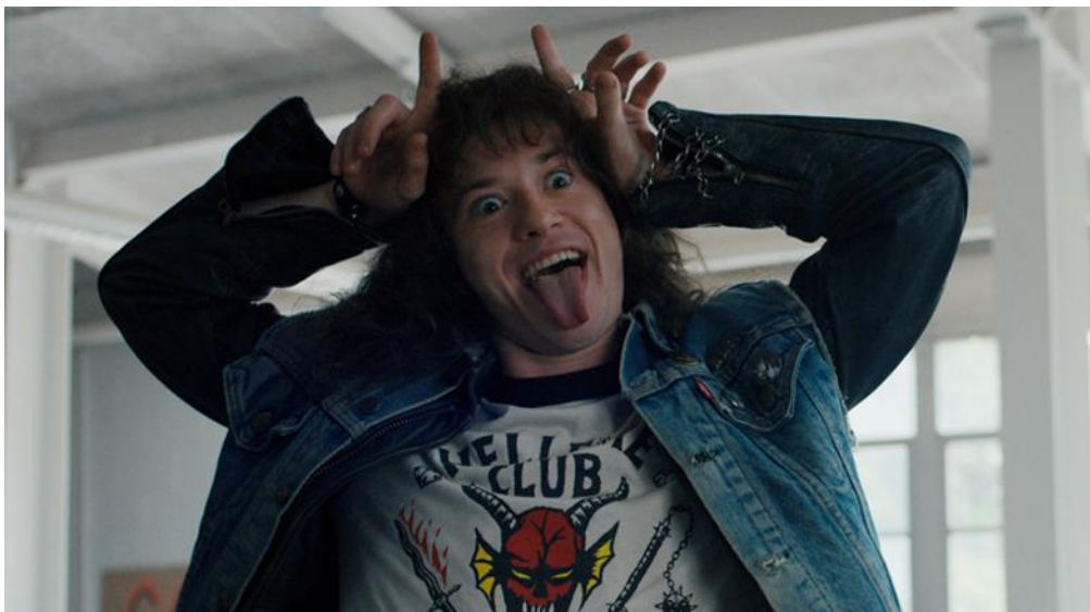
Slika br. 13 „Eddie Munson“

od najvećih metal pjevača svih vremena, bio je zagriženi fan upravo igre Dungeons & Dragons , a članovi Led Zeppelina pisali su pjesme o svijetu Gospodara prstenova J. R. R. Tolkiena. Eddie je prikazan kao maskota koju zadirkuju pa im se on belji glumeći rogove na glavi. U početku je odbačen od strane većine učenika, pogotovo članova košarkaškog kluba. Prvi je osumnjičen za sva ubojstva u gradu i sve oko njega asocira na loše. Život mu je težak i postaje bjeGUNAC zbog lažnih optužbi. Klasična je žrtva neprihvatanja drugoga i drugačijeg u suvremenom društvu.