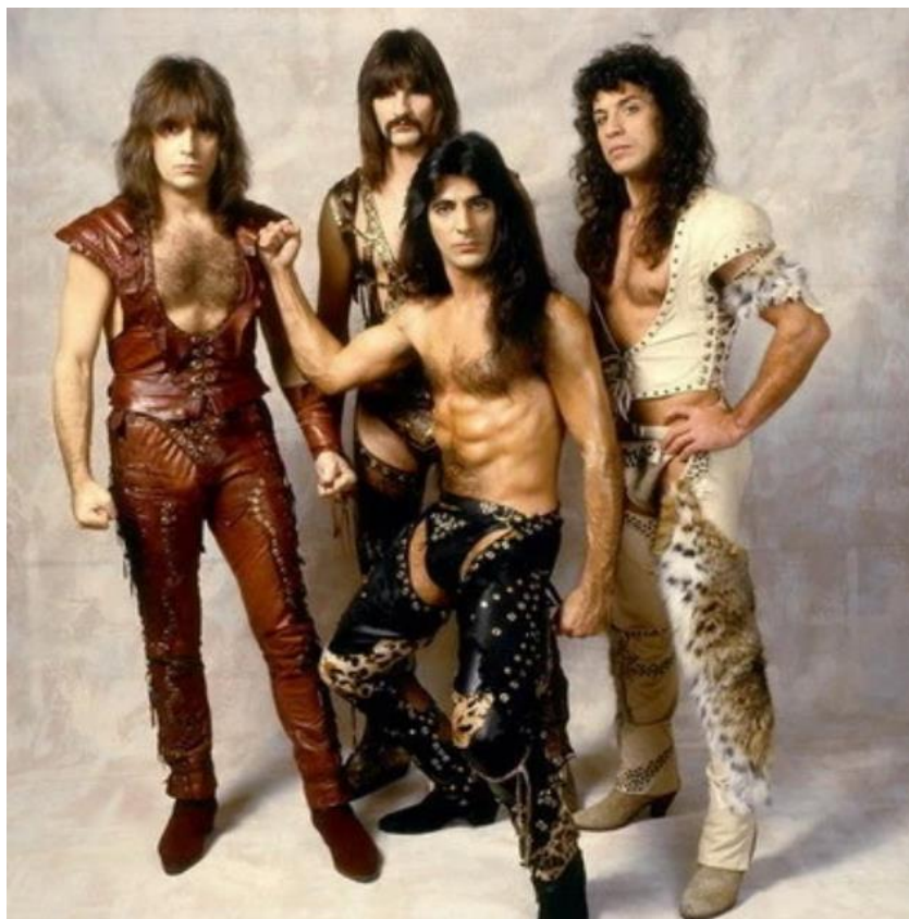
Slika br. 5: „Manowar – primjer hipemaskulinizma“