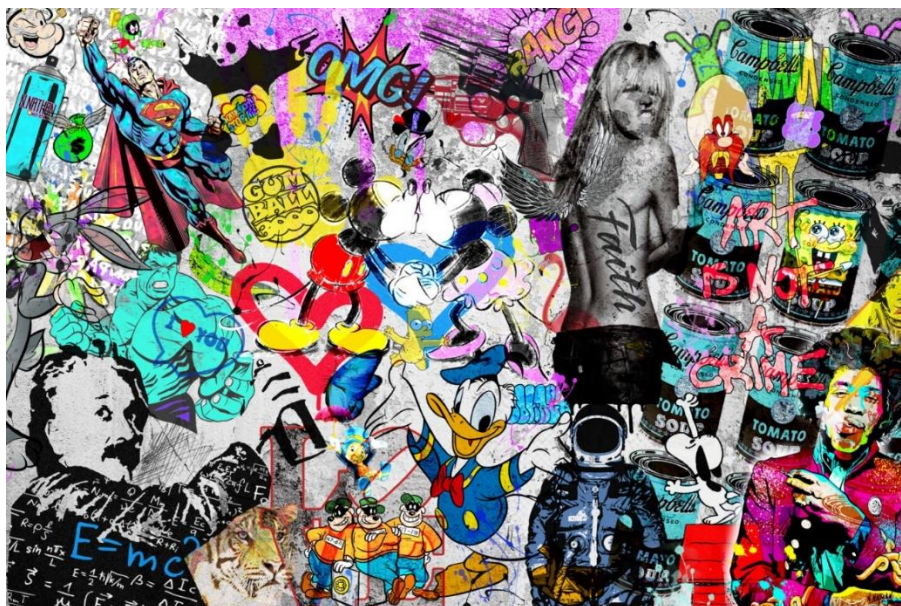
Slika br. 1: „Popularna kultura“

Jasno je da će nas bilo koja definicija popularne kulture uvesti u kompleksnu kombinaciju različitih značenja pojma „kultura“ s različitim značenjima pojma „popularno“. Očito je polazište u bilo kojem pokušaju definiranja popularne kulture da je popularna kultura jednostavno kultura koja je široko omiljena ili koja se sviđa velikom broju ljudi.