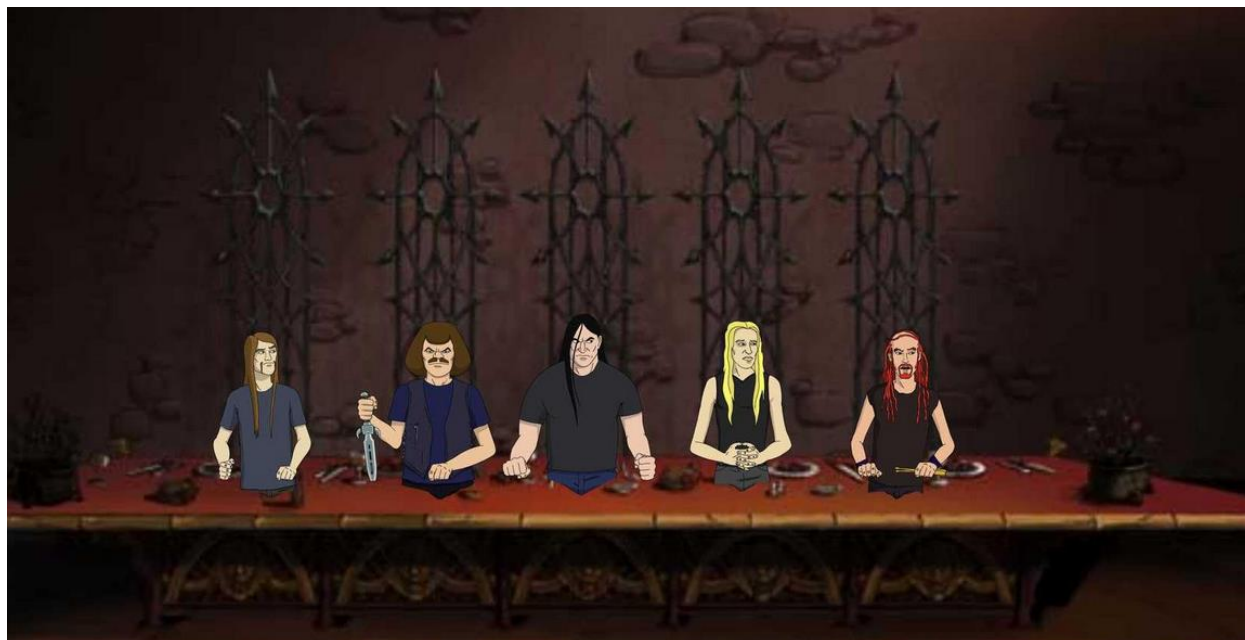
Slike br. 12 „Fiktivni bend iz serije – Dethklok“

ekstremne osobnosti i pretjerane osobine, odražavajući pretjeranu prirodu metal žanra. Serija na duhovit način istražuje živote i avanture članova benda, satirizirajući različite aspekte glazbene industrije i heavy metal kulture.