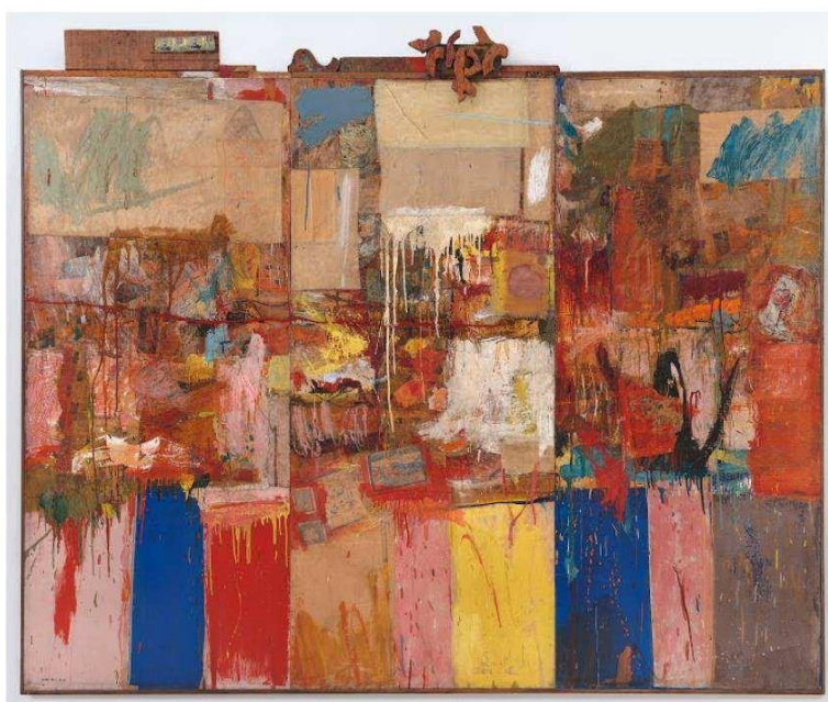
Prilog 14. Robert Rauschenberg, Kolekcija, 1954/1955 god.

Preuzeto sa Internet stranice URL: https://www.artsy.net/artwork/robert-rauschenberg-collection (Pristup 21.06.2023.)