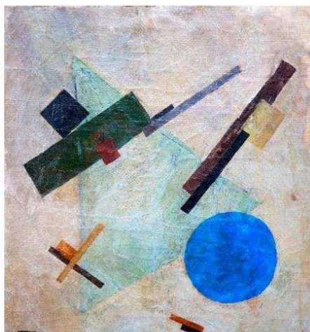
Prilog 6. Kazimir Maljevič, Suprematistička kompozicija, 1916

Preuzeto sa Internet stranice. URL: https://artsandculture.google.com/asset/suprematist-composition-kazimir-malevich/3gEa_AWAHpuU9A Pristup: (23.6. 2023)