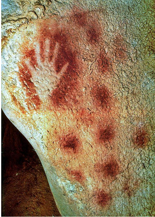
Slika 1: Otisak ruke iz špilje Pech Merle u Francuskoj, oko 35000 pr. Kr.