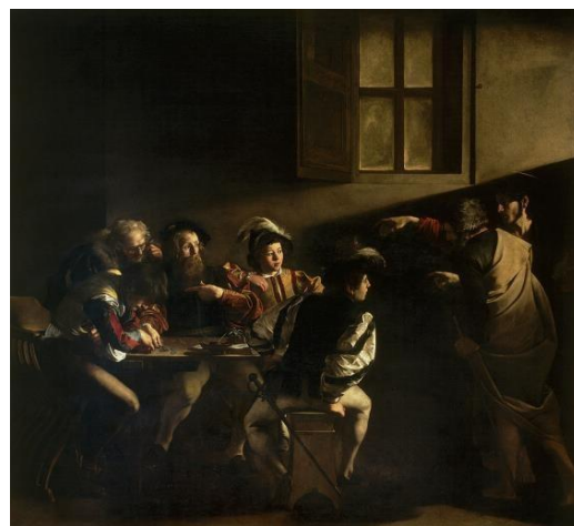
Slika 10: Caravaggio, Poziv Svetom Mateju , 1600.

U radu se, također, pojavljuje indirektni autoportret na kojega se autor slike baš i ne ponosi. Razlog tomu je pretjerana konzumacija alkohola (naime, pronašla se rakija u boci od pelinkovca). Pognuo je glavu prema dolje da mu se ne vidi lice. Valja istaknuti kako se autor srami svoga stanja te ne želi odati izgled svoga lica javnosti. S druge strane, Niko je odlučio biti modelom za akt. Portreti većine drugih likova jasno su prikazani, osim djevojke u lijevom kutu. Vidimo kako se igra s noćtima, nije konzumirala alkohol i nije htjela odati svoj identitet. Likovi