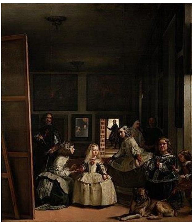
Slika 4: Diego Velásquez, Male dvorske dame , 1656.