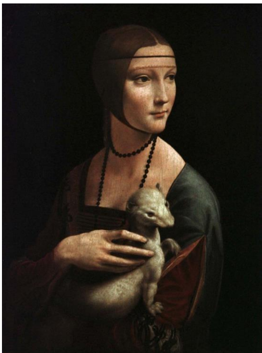
Slika 2: Leonardo Da Vinci, Dama s hermelinom , 1489.