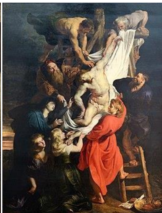
Slika 5: Peter Paul Rubens, Skidanje s križa , 1612.