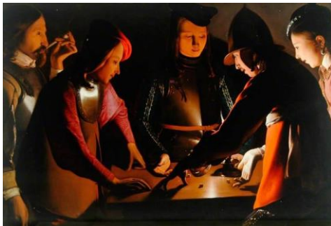
Slika 9: Georges de La Tour, Igrači kocke 1650.

Prostor slike je riješen planovima, točnije riječ je o njih četiri. Srđana (djevojka u naslonjaču, lijevo) i Niko (mladić u donjem rublju, desno) nalaze se u prvome planu. S druge strane, Ivan (mladić koji je drijemao), Vedran (mladić duge kose), Laura (djevojka plave kose) i ja smo u drugom planu. U trećem je prijatelj Juraj, poznatiji kao Žika, koji pomalo vreba iz sjene direktnim pogledom prema promatraču. Djeluje pomalo demonski i jezivo, kao da bdije iznad Ivanove i moje glave. Njegov portret je utišan, ugašen blagom sjenom. U četvrtom planu je blago osvijetljeni zid koji se proteže u širinu, okružen s nekoliko jedva primjetnih elemenata. Izvor svjetlosti širi se kompozicijom iz jedne točke, kao što je to prikazano na slikama Georgesa de La Toura. Svjetlost, koja pada odozgo direktno na lica likova, podsjeća na Caravaggiovo znamenito djelo Pozivanje Svetoga Mateja . Na prvi pogled, slika podsjeća na prikaz posljednje večere, radi zajedništva i okupljanja oko stola. No, na stolu se nalazi sve drugo, samo ne hrana. PISOAR, koji je imao funkciju pepeljare, sasvim je slučajno završio na stolu u samome centru kompozicije. Aluzija na dobro poznatoga Marcela Duchampa i njegovu fontanu, odnosno pisoar izložen u konceptu ready-madea (gotovog, izloženog predmeta).