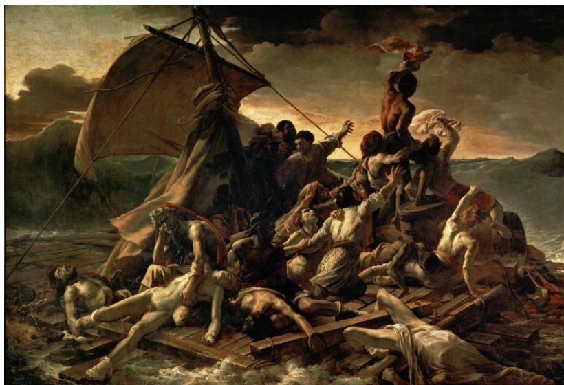
Slika 6: Théodore Géricault, Splav meduza , 1818.

Narativnost je u slikarstvu 20. stoljeća gotovo potpuno iščezla. Slikari su koristili realistične scene pa čak i fotografske predloške u svojim slikarskim realizacijama (fotorealizam primjerice), no to je uglavnom bilo bavljenje slikarstvom kao metajezikom pri čemu je usporedba između figurativnog i apstraktnog aspekta slike postala suvišnom.