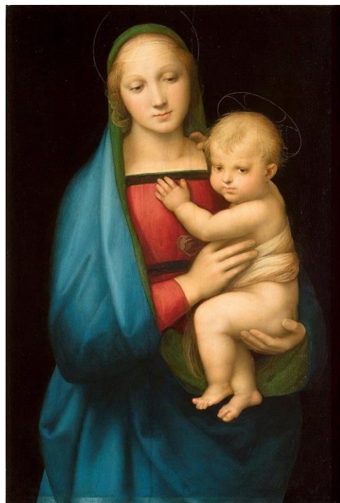
Slika 3: Raffaello Sanzio, Bogorodica , 1505.