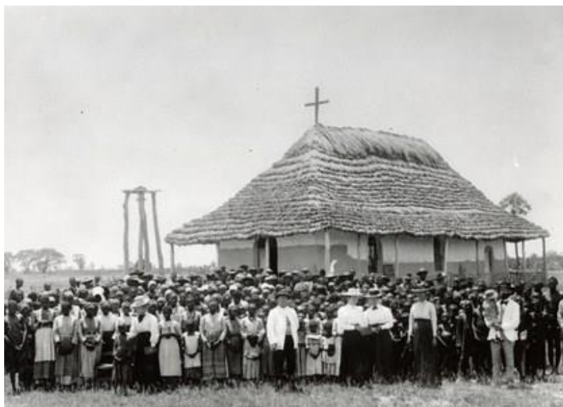
Slika 1: Misionarske u Africi

https://www.google.com/search?q=missionaries+in+africa&source=lnms&tbm=isch&sa=X&ved=0ahUKEwjii7KWypviAhUTwMQBHdy2ABsQ_AUIDigB&biw=1366&bih=657#imgrc=wgbNjXseOGlNVM : [pristup 14.05.2019]