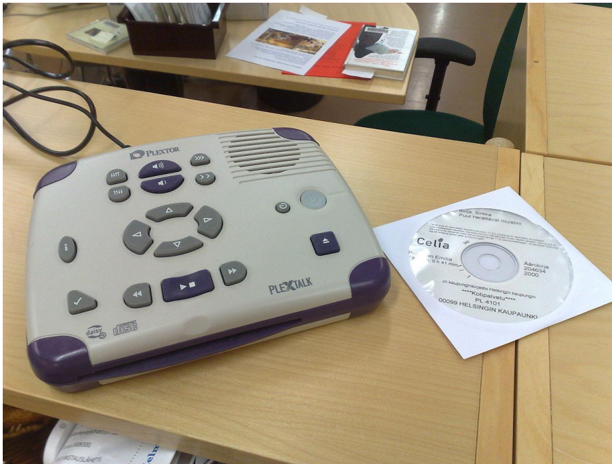
Slika 2: DAISY konzorcij

stanju čitati, bolje razvijaju čitateljske vještine. Studije također pokazuju da slijepa djeca vole odabirati knjige po vlastitom izboru i da će koristiti različite formate za čitanje.“ (IFLA, 2006:34) Stoga djeca i mladi s oštećenim vidom moraju imati širok izbor građe koji uključuje brajicu, uvećani tisak i zvučne knjige. Suradnja i zajedničko korištenje zbirke je vrlo važno. U zajedničkom korištenju pomažu Konzorcij DAISY (Digital Audio-Based Information System ili Digitalni dostupni informacijski sustav) koji pomaže u lakom pregledavanju sadržaja na zvučnim zapisima i među knjižnična posudba.