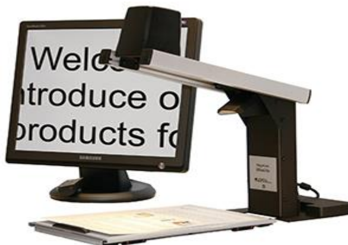
Slika 5: Elektroničko povećalo

Kod elektroničkog povećala "Mira" kamera se nalazi na stalku i spaja se s monitorom, a o monitoru ovisi i povećanje koje može biti do 60x. Elektroničko povećalo "Student" je prenosivo elektroničko povećalo male težine. Također mu se kamera nalazi na stalku. Pomoću USB-a spaja se na bilo koju vrstu monitora, a o monitoru ovisi povećanje koje može biti do 50x. Postoji podešavanje boja (6 kombinacija), kontrasta i svjetlosti. Najviše služi učenicima i studentima jer ima mogućnost povećanja nečega šta se nalazi u daljini (npr. školska ploča) i ima mogućnost slikanja. Elektroničko povećalo "Mlx" je stolno elektroničko povećalo i dolazi s ugrađenim monitorom. Može podešavati boje, veličine i kontrast. Elektroničko povećalo "Mlzip" je sklopivo elektroničko povećalo u boji i dolazi s ugrađenim monitorom te kamerom s ugrađenim autofokusom. Također može podešavati boje, veličine i kontrast. Elektroničko povećalo "Sensview" je prenosivo elektroničko povećalo u boji i dolazi sa ugrađenim monitorom i kamerom. Kao i prethodni modeli, može podešavati boje, svjetlost i kontrast. Svi ovi modeli imaju više podvrsta, a cijene im se kreću od 5.000,00 do 25.000,00 kn.