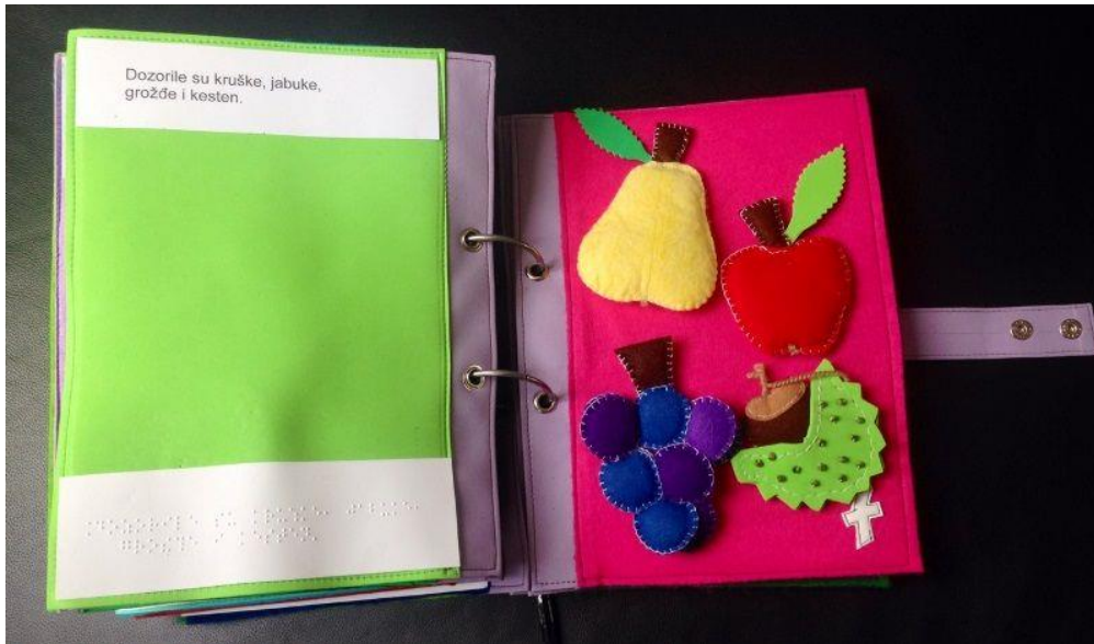
Slika 4. Taktilna slikovnica

https://www.google.com/search?q=taktilna+slikovnica&source=lnms&tbn=isch&sa=X&ved=0ahUK EwjS7-Ws0pviAhVPz6YKHVaeBcwQ_AUIDigB&biw=1366&bih=657#imgsrc=g_doDSegRxqKOM: [preuzeto 14.05.2019]