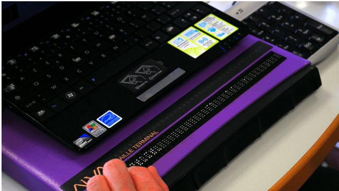
Slika 4: Čitač ekrana

https://www.google.com/search?q=screen+reader+for+blind&source=lnms&tbm=isch&sa=X&ved=0ahUKEwjR-NjX2ZviAhWRIIsKHacmBAQQ_AUIDigB&biw=1366&bih=657#imgrc=x0h8pO-tKtt_mM : [pristup 14.05.2019]