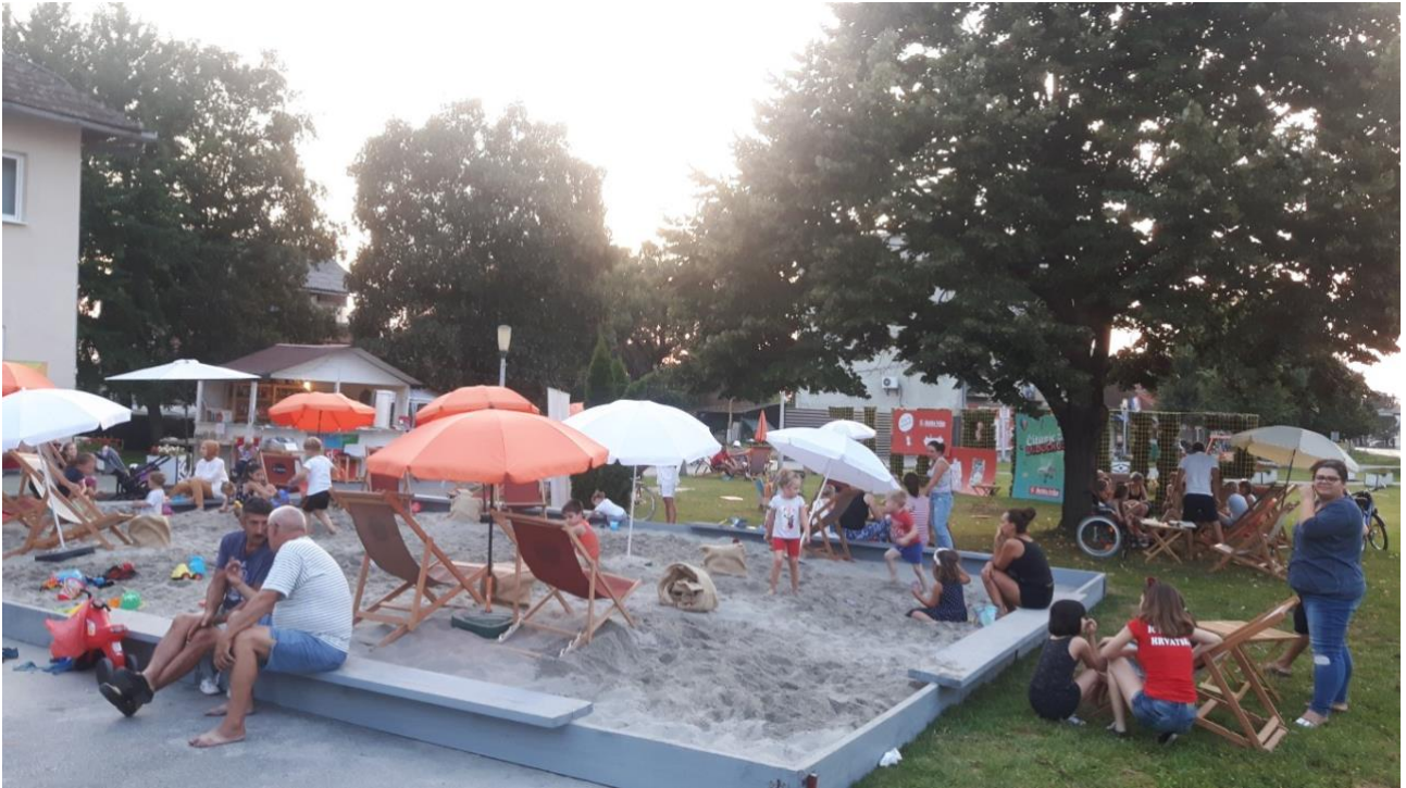
Slika 6: Suhopoljska KUL. plaža

Legenda o Andriji Jankoviću ispričana je tada kroz cijelu medijsku kampanju, na društvenim mrežama, web portalima, na lokalnoj radio postaji i televiziji. Privukla je velik broj posjetitelja, a zahvaljujući njima, Suhopoljska KUL. plaža danas, pet godina kasnije, postala je jedna od najposjećenijih ljetnih manifestacija u Virovitičko – podravskoj županiji, a osim lokalnih posjetitelja, privlači i turiste iz okolnih županija i susjednih država.