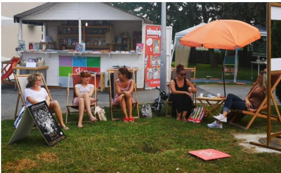
Od legende do Suhopoljske KUL. plaže

2016. godine, kada je ova manifestacija u Suhopolju organizirana po prvi puta, organizatori su posebnu pažnju pridali načinu oglašavanja i marketingu, kako bi se privukao što veći broj posjetitelja. Udruga, kao neprofitna organizacija, nerijetko se priklanja raznim nekonvencionalnim i financijski pristupačnim načinima oglašavanja koji iziskuju kreativnost i inovativnost, kako bi se istakli u masi. Isti se princip iskoristio i za Suhopoljsku KUL. plažu, čiji se marketing utemeljio na legendi o grofu Jankoviću, čiji je sin poželio imati plažu.