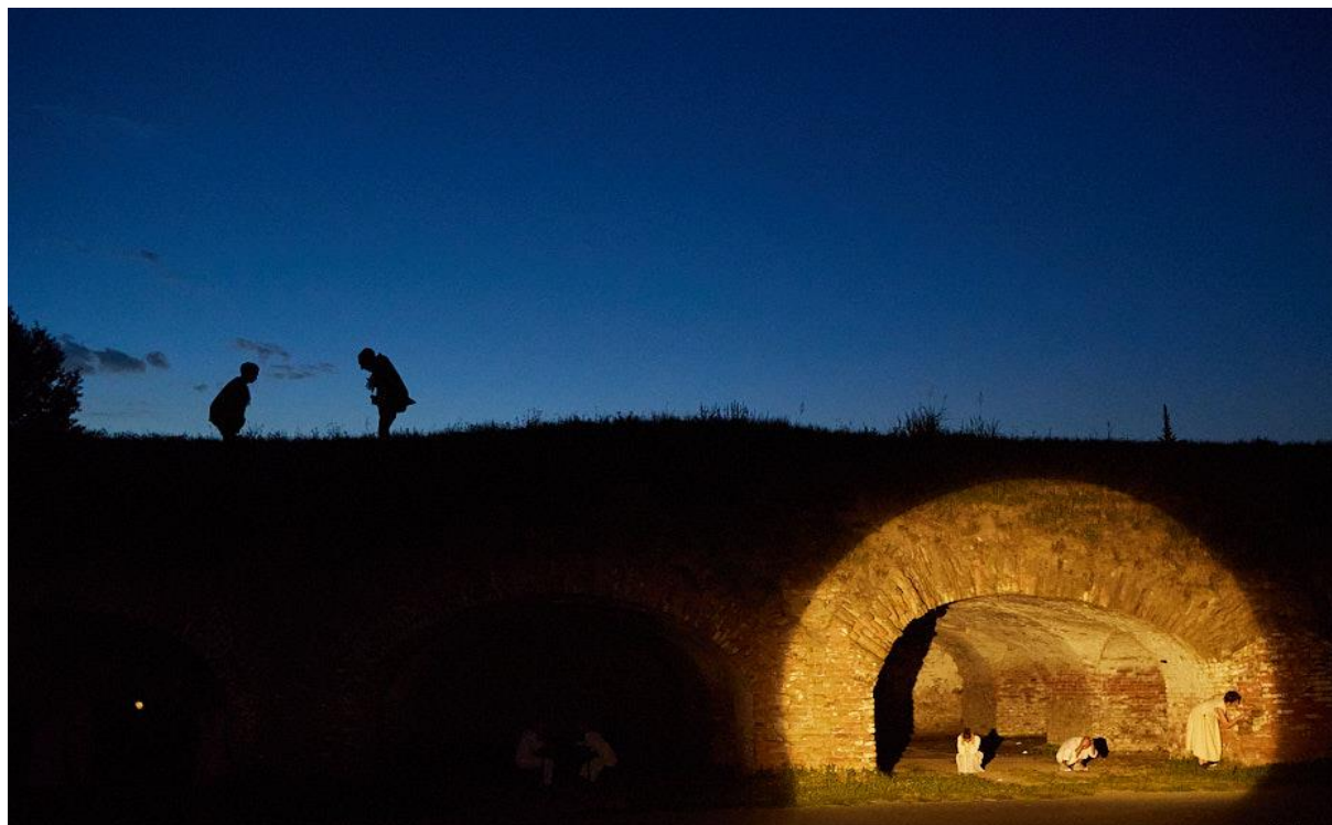
(Slika 2. Prva scena)

koje vide na sceni, što nam je bilo izuzetno važno s obzirom na temu i poruku koju želimo prenijeti.