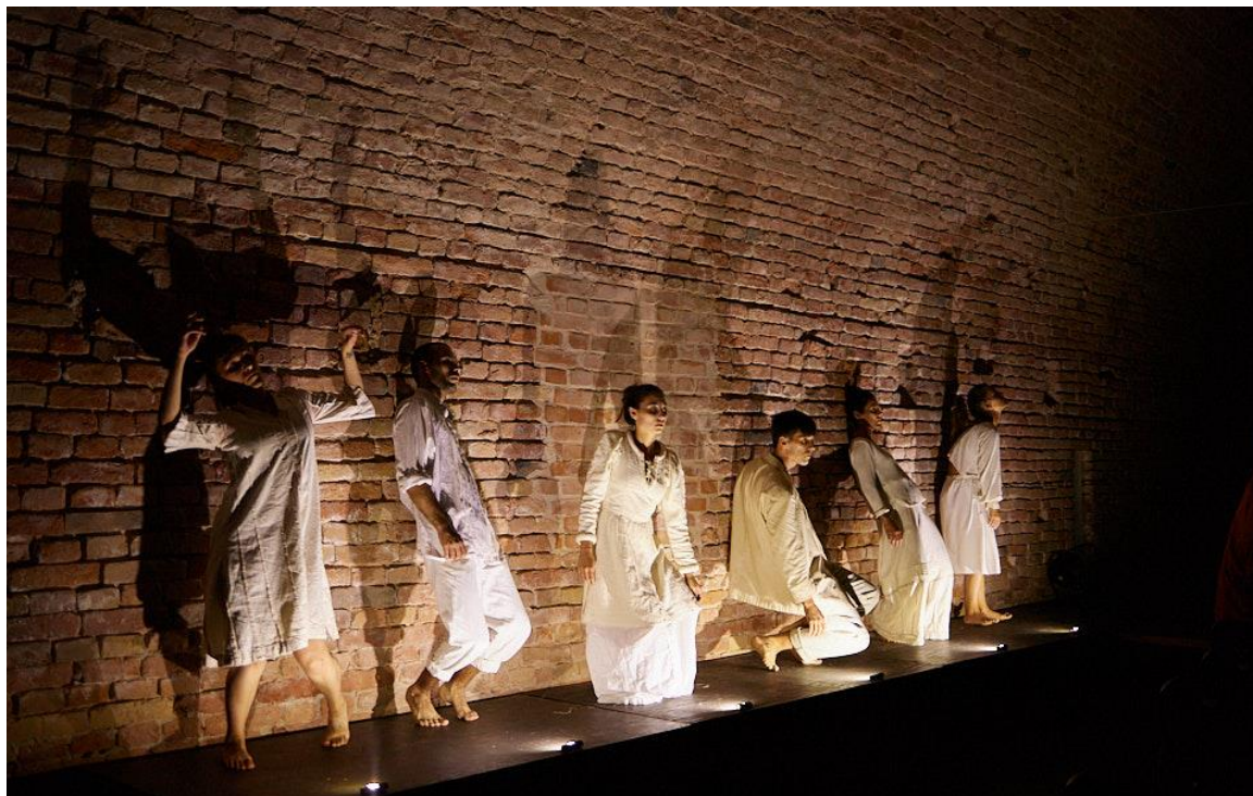
(Slika 4. Treća scena)