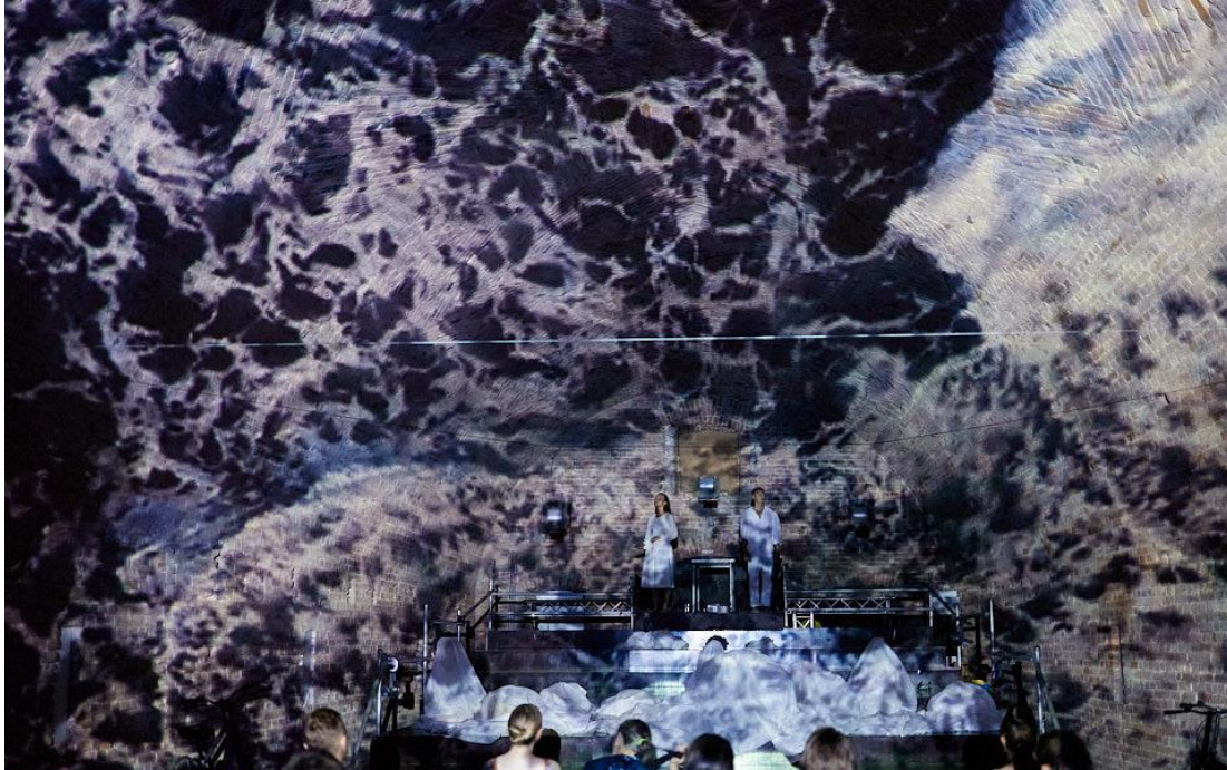
(Slika 3. Druga scena)

dan, a pokretima smo prikazivali svakodnevne radnje. Pošto smo kod sebe i dalje imali plahte odlučili smo se poigrati maštom i u svakodnevne radnje opredmetiti te plahte. Neki su ih koristili doslovno kao plahte i pokrivali se s njima, neki su ih koristili kao mokri veš koji bi kasnije stavljali da se suši na vjetru, nekima su plahte bile novine... Time smo se dotaknuli teme prolaznosti. Koliko god rat ružan bio, ljudima ne preostaje ništa drugo nego pri sjetiti se svojih voljenih i nastaviti život dalje.