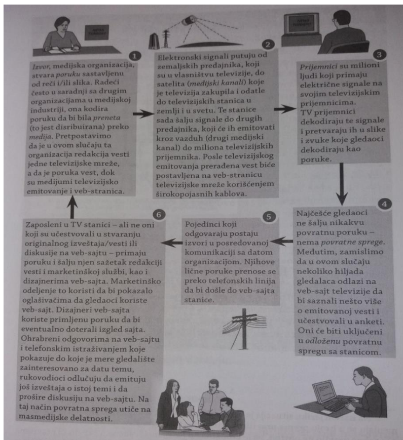
Slika 1. Model masovnih komunikacija ( Turow, 2009: 49 )

Božilović Nikola (Božilović, Petković; 184 ) smatra da masovna komunikacija je istinski posredna komunikacija u kojoj se mediji (tisak, radio, televizija, kompjuteri, internet i razne elektronske mreže) nalažu ulozu posrednika prenošenja poruka između komunikatora (koga čine specijalne društvene grupe) i komunikanta. Televizija je sveprisutna, a radio je integralni dio svakodnevnice. Promjene su dovele do toga da današnji novinari svoje intervjuje i dogovore sklapaju telefonom, elektroničkom poštom ili internetom. A feedback (povratna sprega) može biti odgođen i posredan. On se u novije doba može pratiti na sveprisutnim društvenim mrežama koje imaju mogućnost javne rasprave.