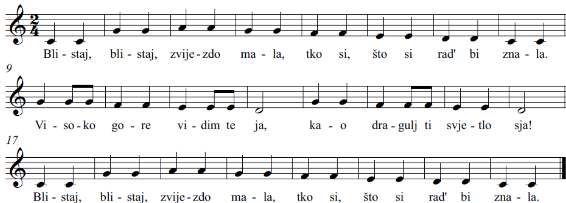
6. Notni zapis pjesme „Blistaj, blistaj, zvijezdo mala“

„Blistaj, blistaj, zvijezdo mala, tko si, što si rad' bi znala. Visoko gore vidim te ja, kao dragulj ti svjetlo sja! Blistaj, blistaj, zvijezdo mala, tko si, što si rad' bi znala.“