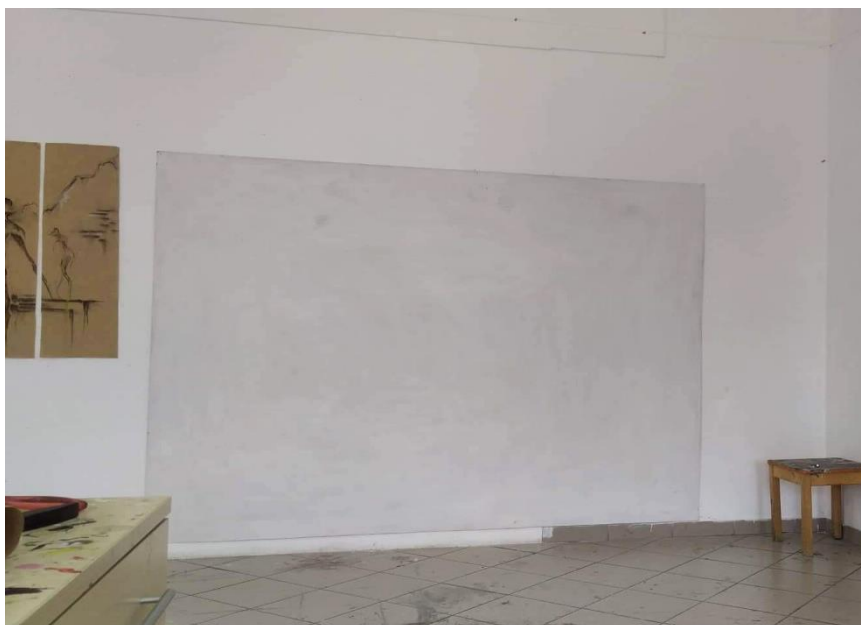
Prilog 2: Pripremljena MDF ploča

Na početku rada zamiješala sam željene boje na paleti te kistom naslikala motive. Poslije postavljenih motiva na slici radila sam krugove. Izradila sam seriju slika. Moj završni rad sastoji se od četiri slike koje variraju veličinom.