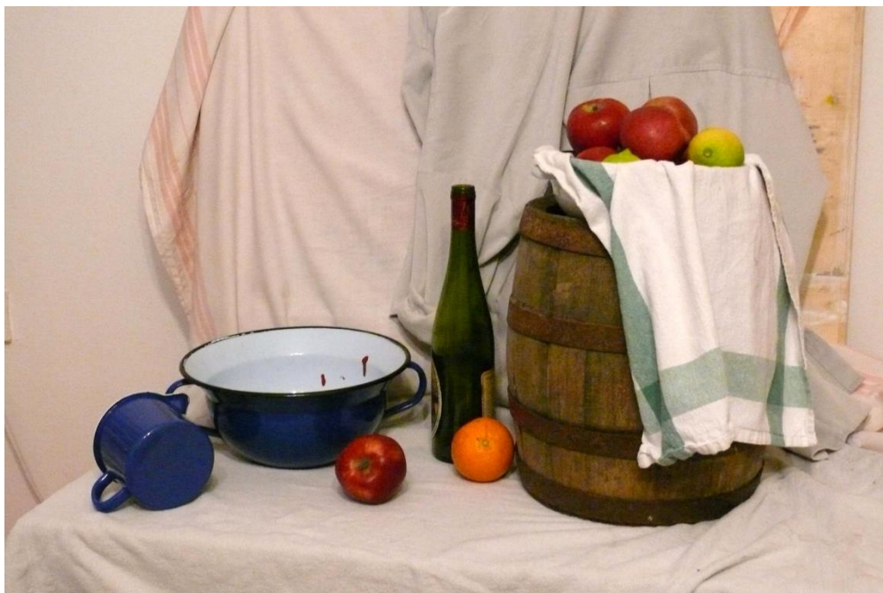
Prilog 1: Postav

Prije izrade rada prikupljala sam motive mrtve prirode kako bih složila željenu kompoziciju. Skupljala sam većinom staro posuđe zbog zanimljivih uzoraka. Riječ je o emajliranom posuđu, koje je intenzivnijih boja, što mi je poslužilo u radu. Koristila sam se i voćem poput jabuka, naranči i limuna, a od predmeta staklenom bocom od vina, starim buretom i tkaninama koje su bile idealne za postav. Nakon prikupljanja motiva složila sam ih u željeni postav te ih fotografirala.