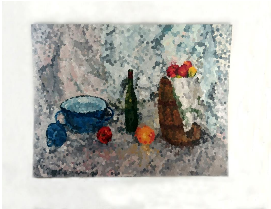
Prilog 5: Mrtva priroda 104,7 cm × 144,5 cm