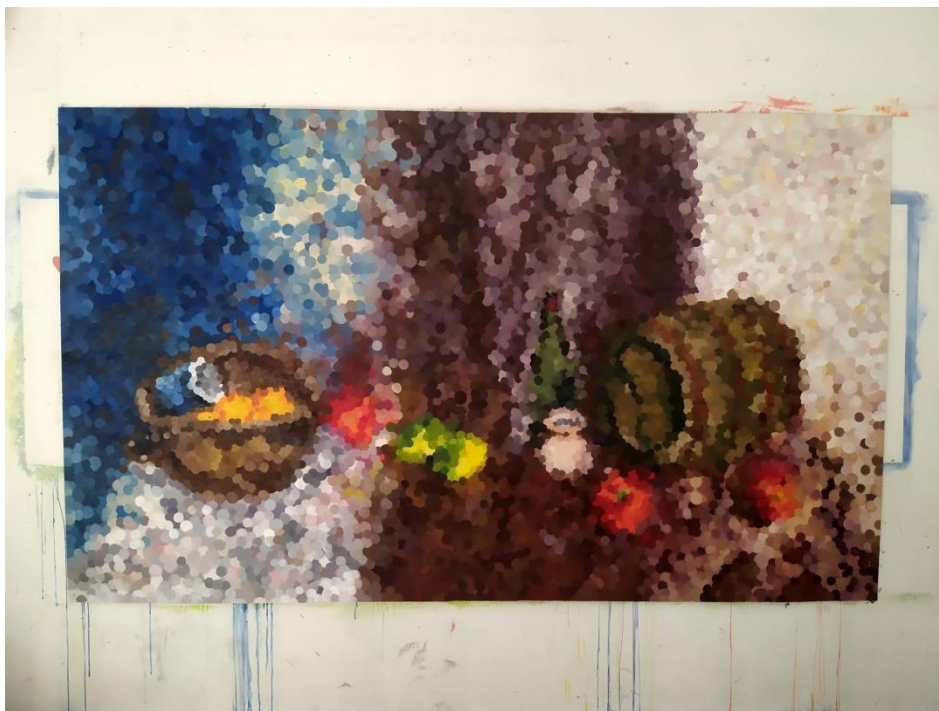
Prilog 6: Mrtva priroda 131,2 cm × 220,5 cm