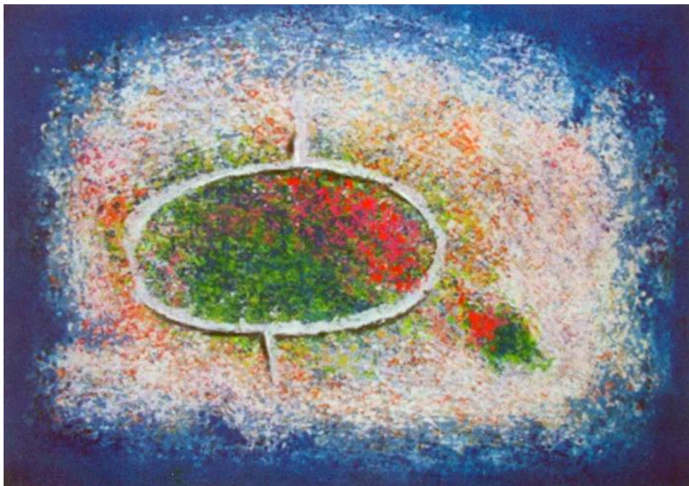
Prilog 8: Terra magica , autor Ivan Kuduz (14)

Ivan Kuduz bio je hrvatski akademski slikar, rođen je 1943. godine u Brezovcu kod Bjelovara. Diplomirao je na Akademiji likovnih umjetnosti u Zagrebu 1968. godine u klasi profesora Alberta Kinerta (13). Za svoja djela dobio je nekoliko nagrada i priznanja. Ovaj umjetnik bio je moja inspiracija za završni rad, a najviše njegova djela Terra magica , koja je naslikao 2003. godine. Željela sam naslikati nešto zanimljivo i drugačije, a čim sam ugledala njegova djela, shvatila sam da želim pokušati isto. Budući da volim slikati mrtvu prirodu, odlučila sam je prikazati na apstraktan način. Ivan Kuduz gradio je svoju poetiku dosljedno i konceptijski prepoznatljivo (14). Njegov se rukopis nadovezuje na temelje i iskustva apstraktnog slikarstva, a svoje iskustvo produbljuje kontinuiranom realizacijom konceptualnih i prostornih otkrića koja nisu uvijek diktirana apstraktnom estetikom (14). Kuduz probija još jednu novu granicu u svom slikarskom procesu. Svoje iskustvo vješto ubacuje u novi ciklus, gdje se koristi sve snažnijim i intenzivnijim kolorističkim prodorima (13).