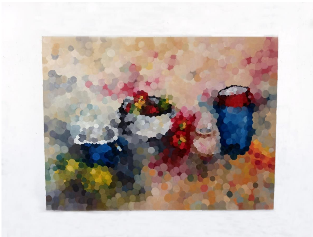
Prilog 7: Mrtva priroda 195,5 cm × 263 cm