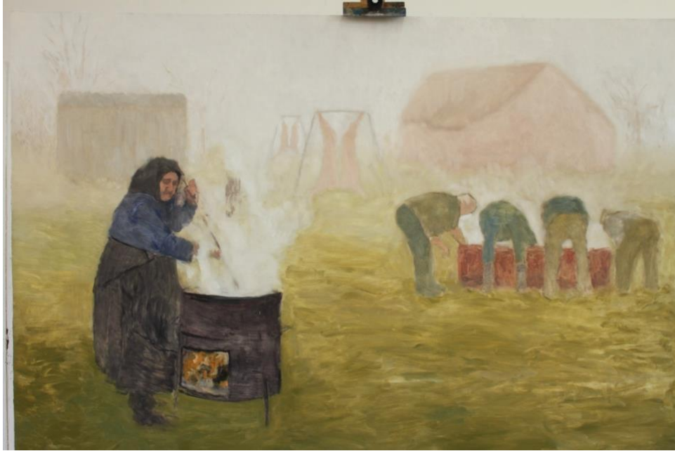
Slika 15. Slika nakon podslivanja