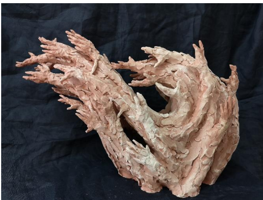
Slika 13: Konačna verzija, Strah , terakota