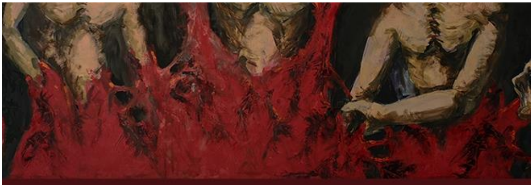
Slika 1: Nikša Borovac, Prikaz ruke kao motiva

Početna je ideja rada Negativno kroz pozitiv želja prikaza tri negativne emocije kroz medij skulpture, tj. seriju od tri skulpture. Ideja se rada razvila iz serije crteža i slika gdje je fokus rada bio više na prikazu lika u patnji i ljutnji, a ruke su predstavljane kao motiv ili manifestacija negativne emocije (slike 1, 2 i 3). Fokus se izradom skulptura usmjerio na ruke, njihovo kretanje, položaj i oblik.