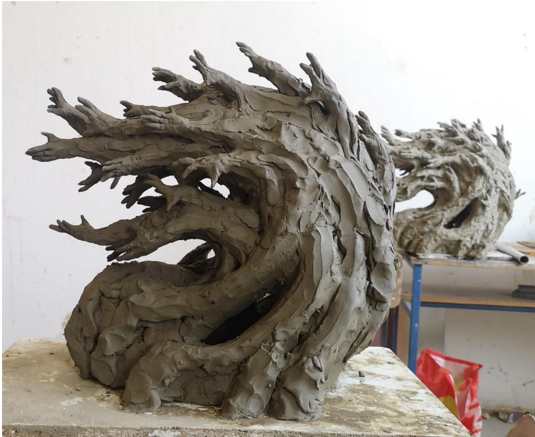
Slika 9: Izrada konačne verzije skulpture Ljutnja , nepečena glina