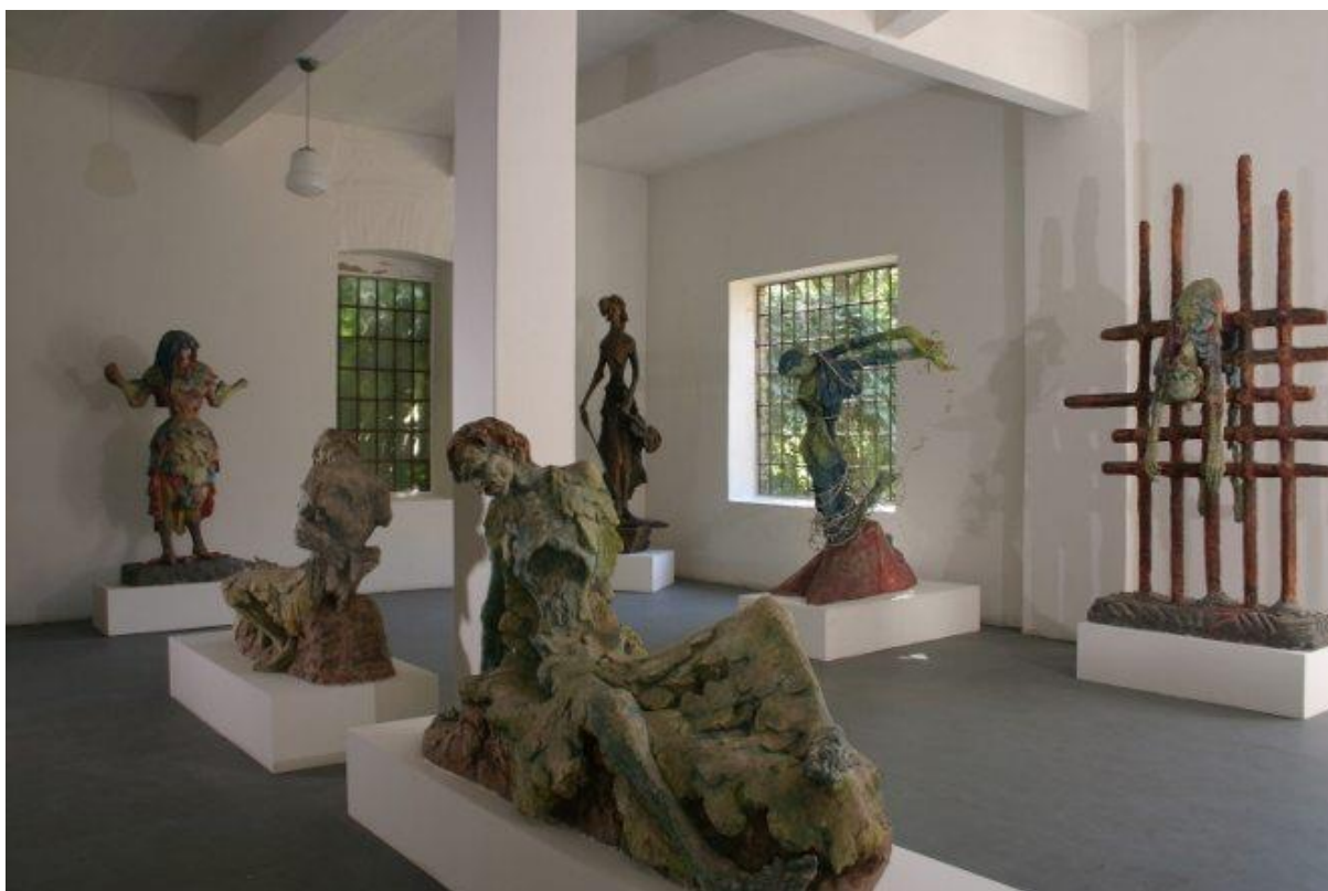
Slika 6: Vanja Radauš, Retrospektiva, Gliptoteka HAZU, Zagreb, 2011.