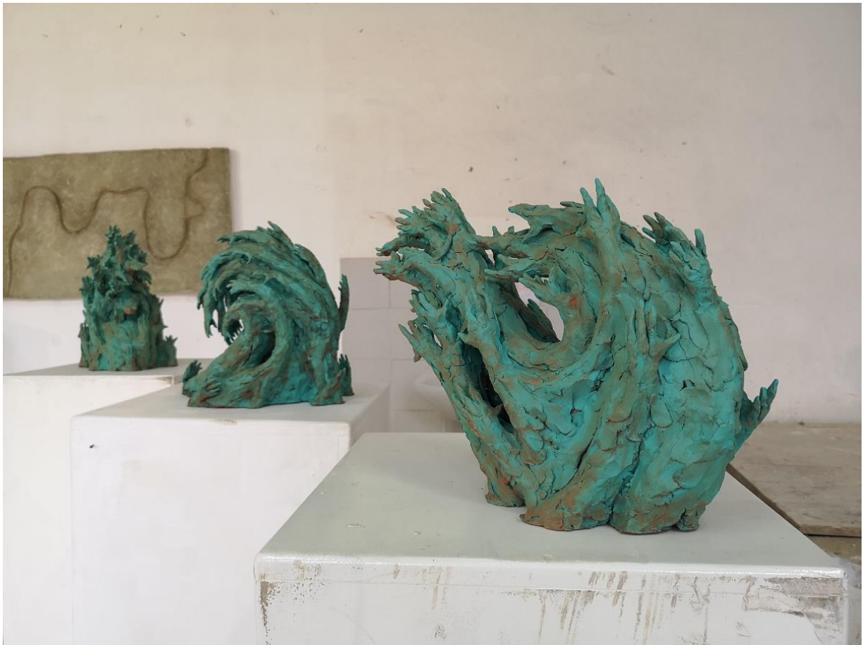
Slika 16: Prikaz oksidirane bronce

Kada se prvi sloj boje osuši, na rad se nanosi drugi sloj, imitacija oksidacije, mješavina narančaste i crne akrilne boje razrijeđene vodom. Laganim potezima, tehnikom „dry brusha“, tj. „suhoga kista“, kist se s bojom lagano obriše o neku drugu površinu, npr. krpu, kako bi se skinuo višak boje prije nanosa na rad. Boja se nanosi na određene dijelove pojedinoga rada kako bi se imitirala oksidacija bronce, tj. kemijska reakcija vlage na površini brončanog predmeta, gdje se stvori zatamnjeni ili, u ovom slučaju, narančasti sloj čestica koji štiti površinu bronce od daljnje reakcije s vlagom.