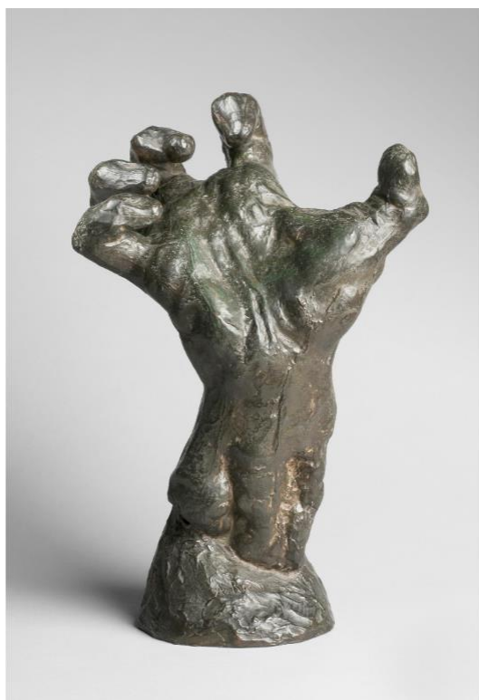
Slika 7: Auguste Rodin, Stisnuta ruka, bronca, 1885.