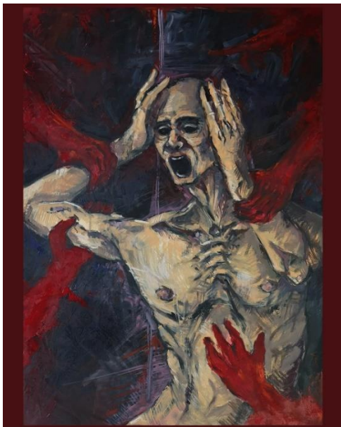
Slika 2: Nikša Borovac, Prikaz ruke kao motiva