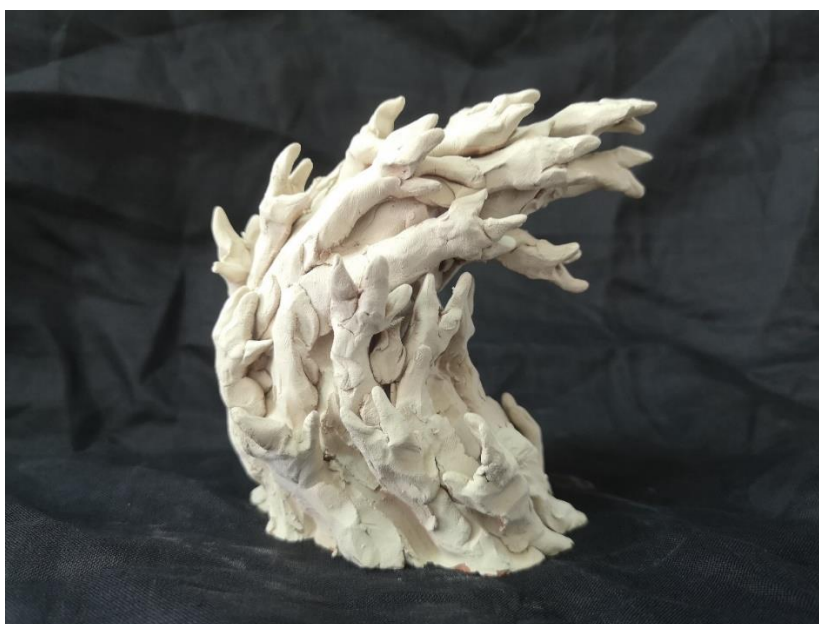
Slika 10.: Skica, bojana terakota

Prva je skica skulpture u glini nastala uzorom na prije spomenute i prikazane slike nastale tehnikom ulja na platnu. Manja je verzija skice u glini bila izrađena kao eksperiment u materijalu i kao test forme i kretanje ruku (slika 12). Razlog blijedoga izgleda pečene terakote na ovom primjeru, rezultat je bojanja pečene gline bojom koja će, na kraju, poslužiti kao temeljna boja za patinu. Zatim je pečena glina s bojom stavljena u peć te se procesom zagrijavanja otopila i ostavila iza sebe više bijelu, nego narančastu boju. Nakon izrade zadovoljavajuće umanjene skice, izrađen je veći rad pod nazivom Ljutnja (slika 13). Rad nije bio prošupljen i zbog veličine ga nije bilo moguće ispeći u keramičkoj peći na Akademiji. Zbog nemogućnosti pečenja, premazan je višeslojnim nanosom ljepila za drvo, kako bi mu se površina, do neke mjere, zaštitila od vanjskih utjecaja poput vlage ili ogrebotina. Gotov je rad korišten kao predložak za izradu manje, konačne verzije, prikaza Ljutnje koja je prošupljena te ispečena (slika 14). Strah je druga po redu skulptura, realizirana kao skica u manjim dimenzijama u glini, koja je izrađena po predlošku na papiru. Skica u glini je zatim korištena za izradu rada većih dimenzija, za završnu, složeniju i veću verziju (slika 15). Tuga je treća po redu te je jedina u seriji rađena bez manje verzije ili crteža kao skice (slika 16).