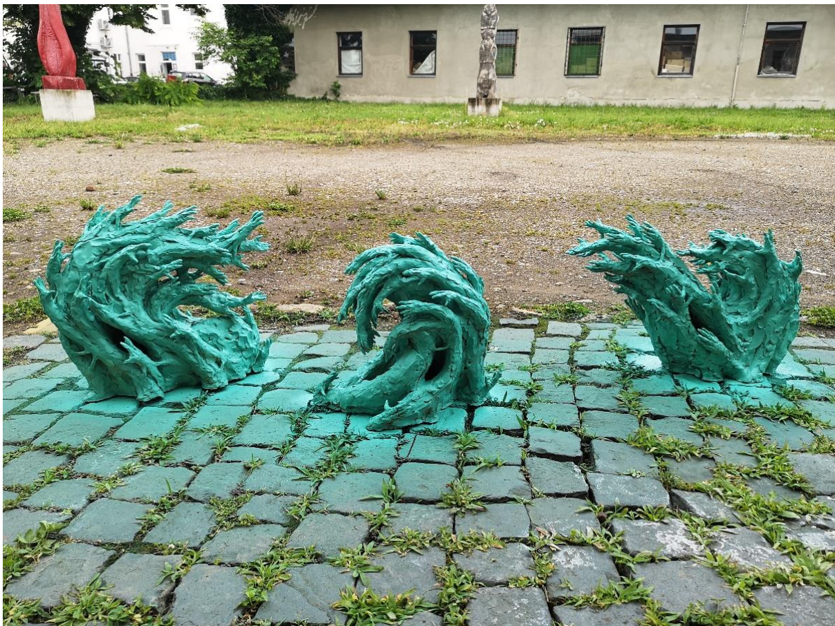
Slika 15: Nanos temeljne boje patine

...pretjerana uporaba plave može se činiti hladnom i bezličnom, čak i neprijateljskom. (...) Plava također može stvoriti osjećaj tuge ili usamljenosti. Razmislite kako slika koja je pretežito plava, poput radova iz Picassovog „plavog perioda“, djeluju usamljeno, tužno ili napušteno.“ 9