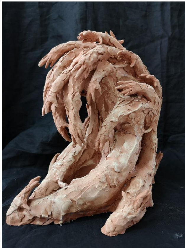
Slika 14: Konačna verzija, Tuga , terakota