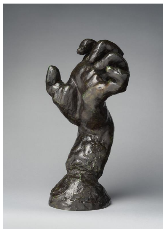
Slika 8: Auguste Rodin, Stisnuta lijeva ruka, bronca, 1885.