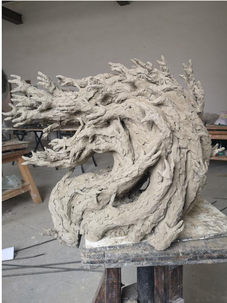
Slika 11: Prva verzija, Ljutnja , suha glina