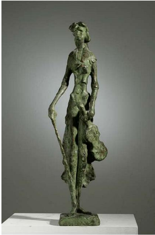
Slika 4: Vanja Radauš, Franjo Krežma (model), bronca, 1967.