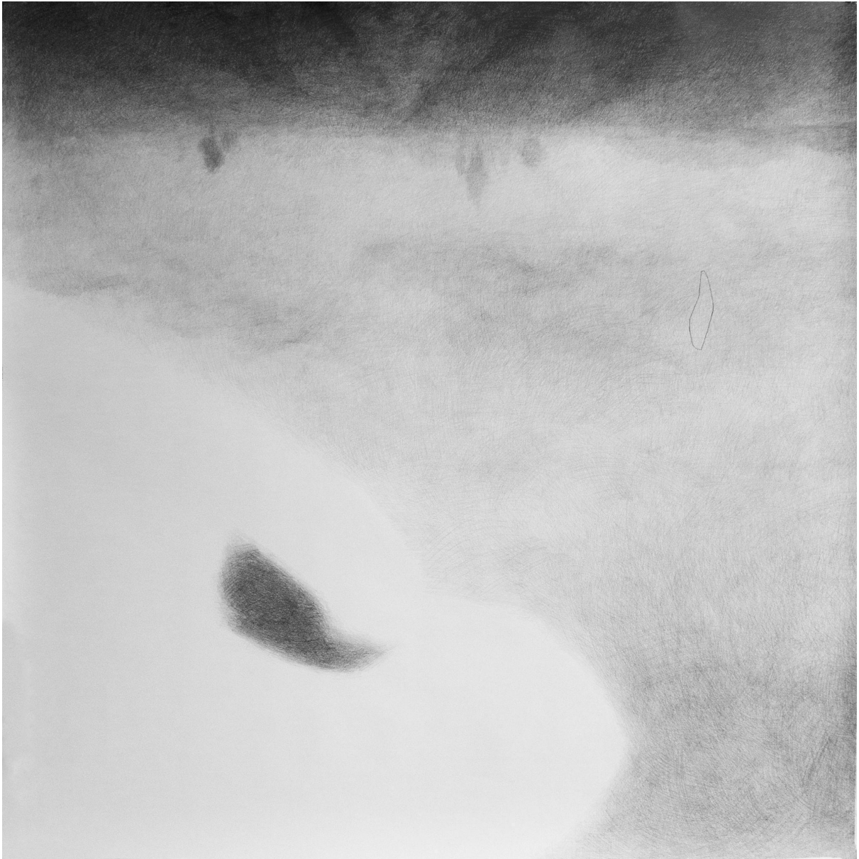
Slika 11. Četvrti crtež u seriji (četvrta faza sna)