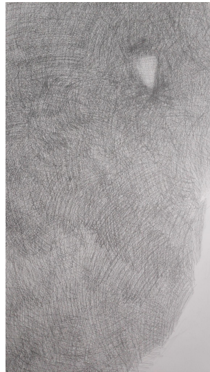
Slika 3. i 4. Postavljanje osnovnih tonova i kompozicijskih elemenata