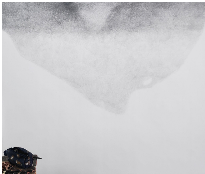
Slika 5. i 6. Postavljanje osnovnih tonova i kompozicijskih elemenata