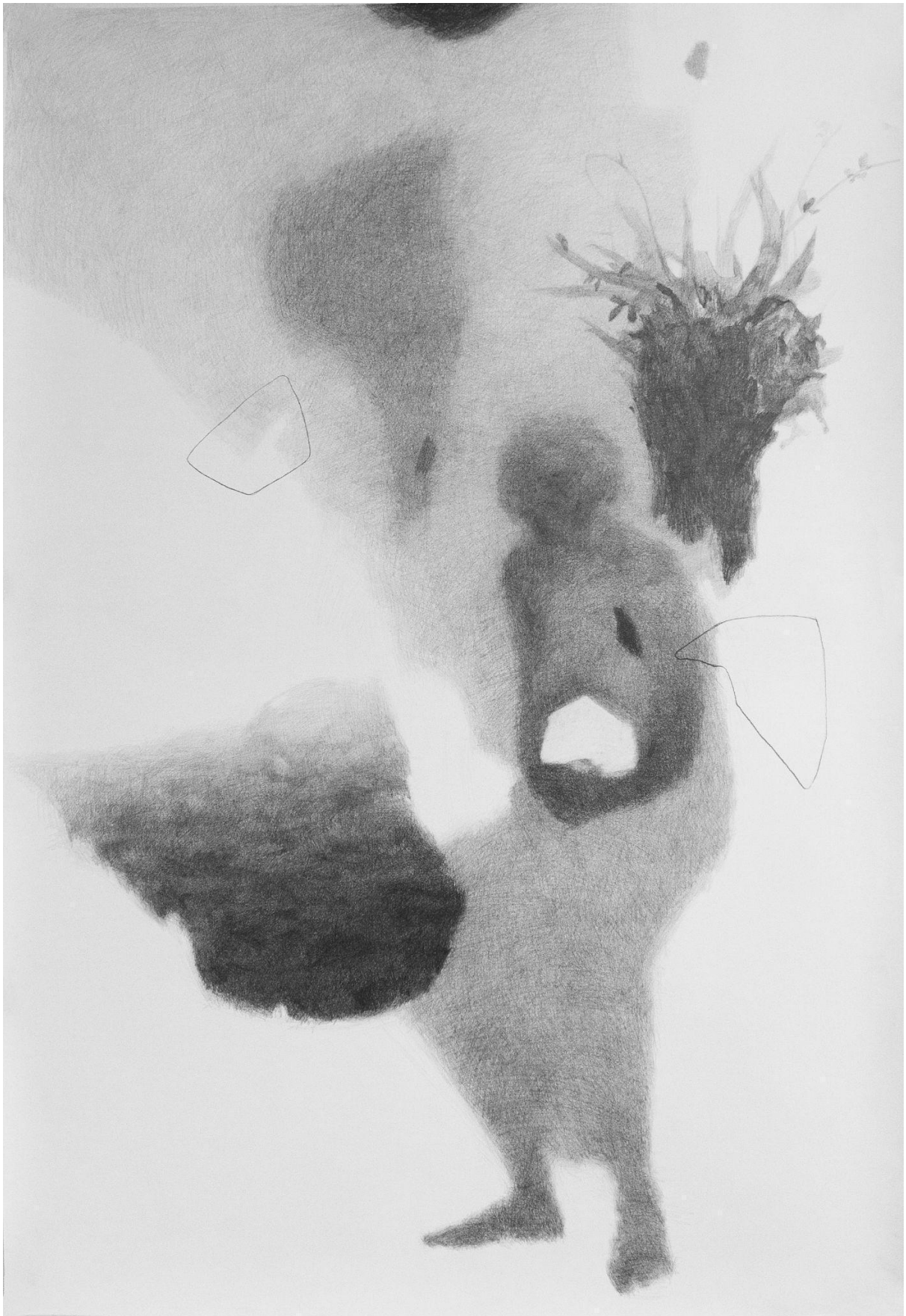
Slika 10. Treći crtež u seriji (treća faza sna)