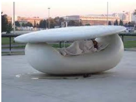
Slika 2. Kata Mijatović, Sleeping between the Sky and the Earth . 2010.