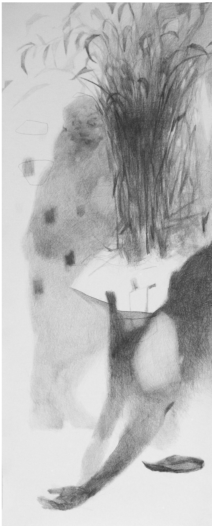
Slika 8. Prvi crtež u seriji (prva faza sna)