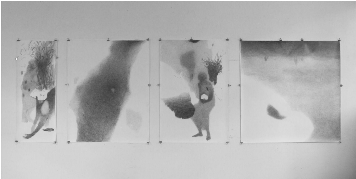
Slika 7. Serija radova „Međuprostor“

Radovi su realizirani tonskim pristupom crtežu s minimalnim linearnim elementima. Nakon prve faze postavljanja osnovnih tonova (slike 3., 4., 5. i 6.) slijedi zatamnjenje određenih fragmenata crteža u svrhu naglašavanja prostornih planova.