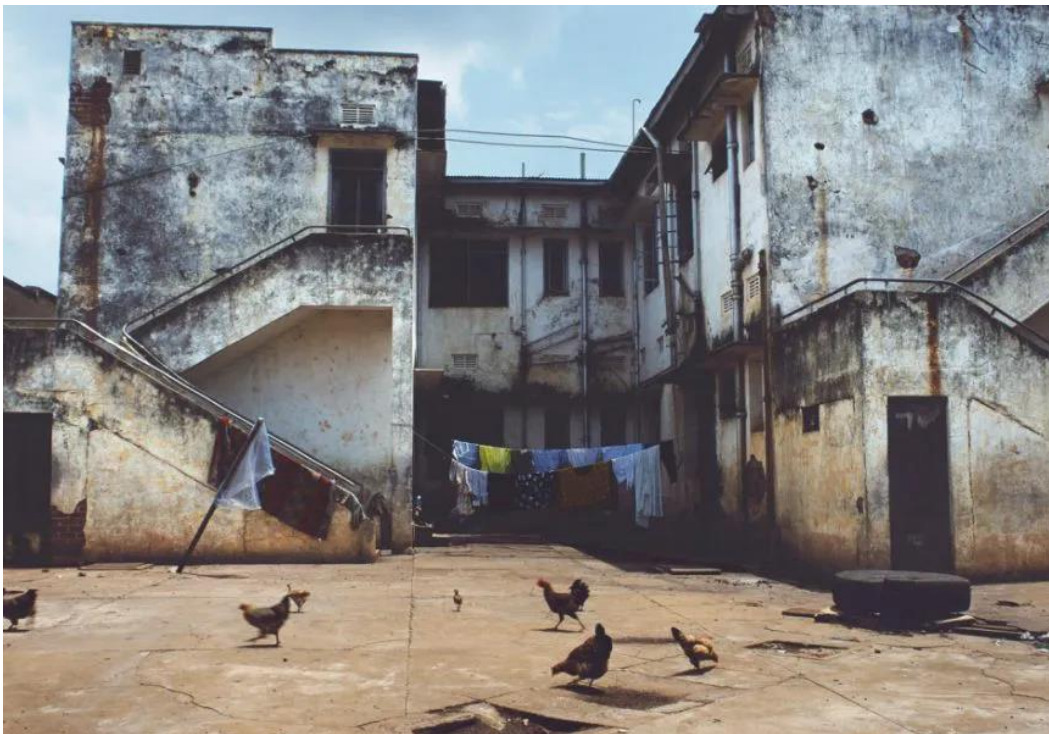
Zarina Bhimji – Your Sadness is Drunk (2001. – 2006.)

Zarina Bhimji suvremena je vizualna umjetnica čiji su radovi 2007. uvršteni u uži izbor za nagradu Turner. Teme koje njezine fotografije i filmovi istražuju jesu napuštenost, propadanje, raseljeni životi i napuštene nade. Često bez figura, fotografije emitiraju ljudsku prisutnost, ali onu koja je bila, a ne onu koja još uvijek jest. Radovi su usredotočeni na Indiju i istočnu Afriku predstavljajući kolonijalne urede u luci Mumbai, napuštene Haveli palače, propadajuće domove onih koji su bili prisiljeni napustiti ih. Slojeviti u svojoj povijesti, ti krajolici i građevine evociraju ne tako sretnu prošlost (Frederic Godward, 2016, https://www.widewalls.ch/magazine/decay-art-artists-photographers ).