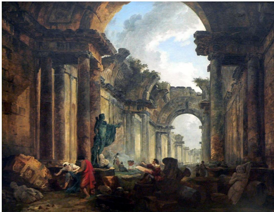
Robert Hubert, Zamišljeni pogled na Galeriju Louvrea kao ruševinu 1796. (Louvre)

Jedan od najpoznatijih slikara ruševina jest Robert Hubert iz razdoblja romantizma. On na svojim slikama radeći brzo u tehnici „alla prima“ prikazuje romantičarske scene ruševina u Italiji i Francuskoj koje odlikuje velika živost i preciznost u obradi teme. Jedna od njegovih najpoznatijih slika jest prikaz Pariške galerije Louvre u ruševinama. Ovdje on prikazuje Louvre kako ga on vidi u budućnosti, referirajući se kroz to na samu moguću propasti Pariza ( https://www.bbc.com/culture/article/20180112-the-timeless-allure-of-ruins ).