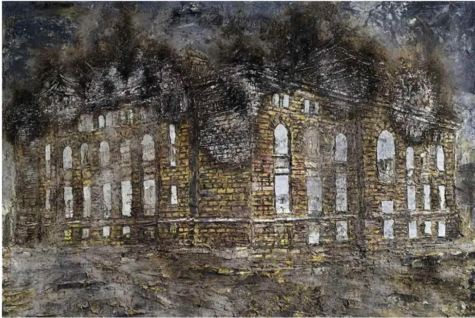
Anselm Kiefer, Athanos: ulje, pijesak, pepel, zlatni listići, olovna folija na platnu (1991.)

odbija dopustiti zakopavanje povijesti ili da zlo oko njega ostane skriveno. U radovima prikazuje relevantne zgrade koje izgledaju spaljene i uništene, koje oponašaju gubitak, ali i priznaju veze između propasti židovske kulture, njemačke povijesti i fizičkog okoliša (Sasha Savenko, 2020, https://www.thecollector.com/anselm-kiefer-third-reich-architecture-approach/ ).