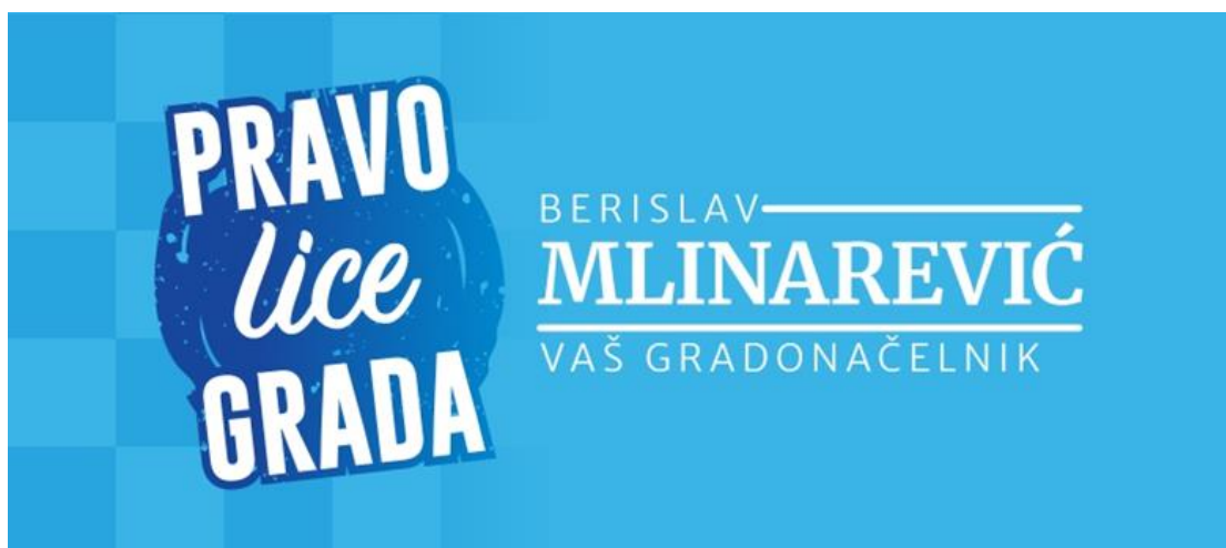
Slika 2 Plakat Pravo lice grada