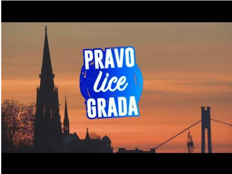
Video zapis 2. Pjesma pravo lice grada, izvor - https://www.youtube.com/watch?v=vm900hjHTc (pristupljeno 22.06.2022.)