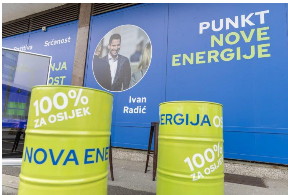
Slika 4 Punkt Nove energije, izvor: https://hdz-obz.com/www/?p=15555