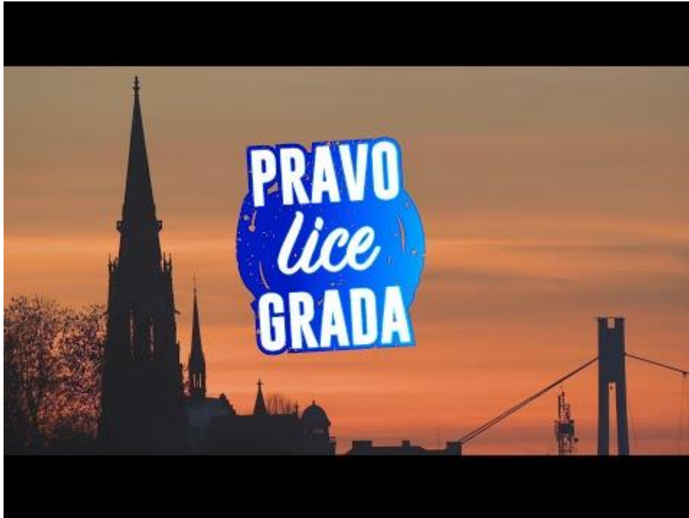
Video zapis 2. Pjesma pravo lice grada, izvor - https://www.youtube.com/watch?v=vm90OhjHTc (pristupljeno 22.06.2022.)