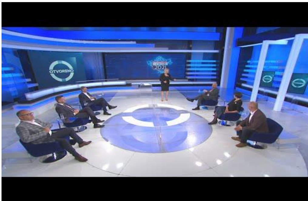
Video zapis 1. Emisija Otvoreno,

izvor - https://www.youtube.com/watch?v=8PiNKBxOxKo (pristupljeno 12.06.2022.)