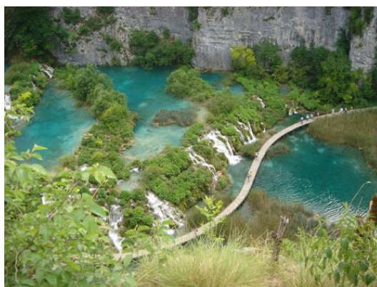
Slika 1. Nacionalni park Plitvička jezera