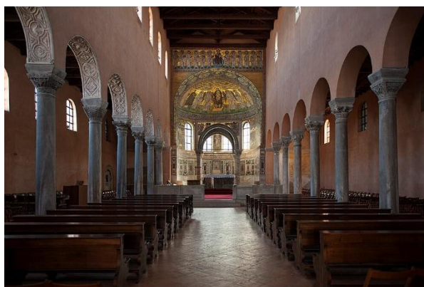
Slika 2. Kompleks Eufrazijeve bazilike u povijesnom središtu Poreča