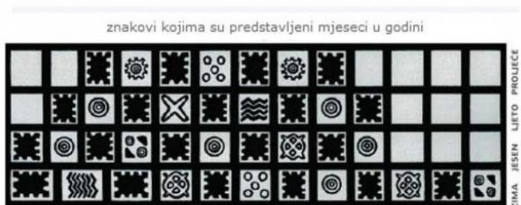
Slika 4. Prilog 2 Simboli s posude za keramičku radionicu