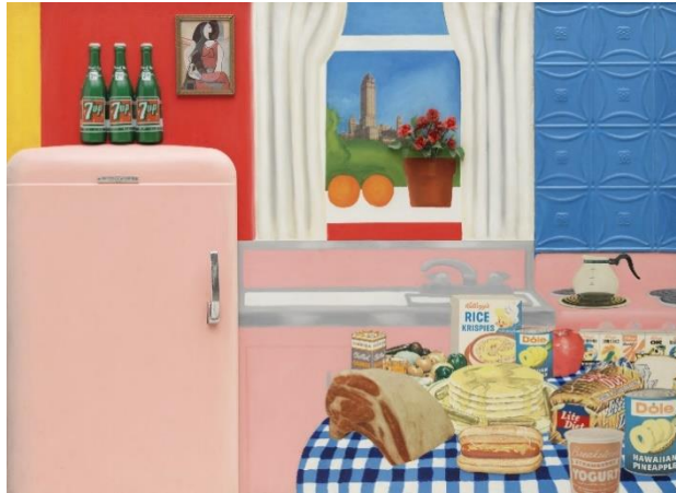
Slika 3, Tom Wesselmann, Mrtva priroda #30 (Still Life #30) 1963, ulje, emajl i akril na ploči s kolažom tiskanih oglasa, plastično cvijeće, vrata hladnjaka, plastične replike 7-Up boca, ostakljena i uokvirena reprodukcija boja i metal sa žigom, dar Philipa Johnsona

kristalnoj zdjeli . Umjetnik se u svome radu koristi tehnikama i estetikom tadašnjih reklamnih plakata također ističući snagu medija i njihovu promociju stereotipnih načina življenja. (MoMa, n.d.)