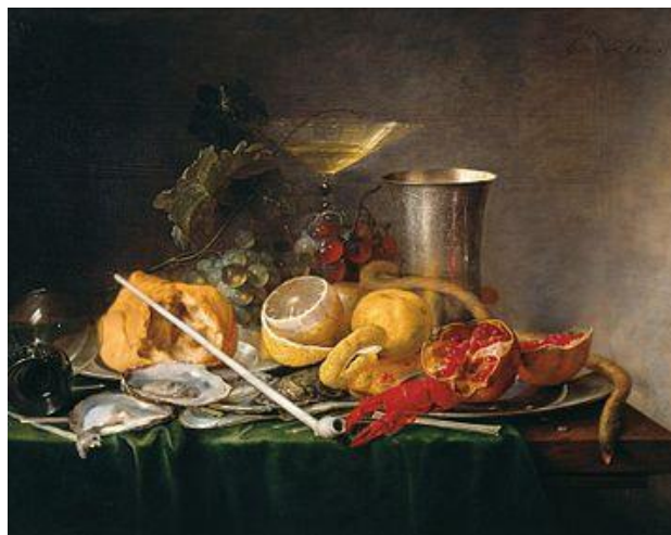
Slika 4, Jan Davidsz. de Heem, Mrtva priroda, Doručak sa čašom šampanjca i lulom 1642, ulje na hrastu, Residenzgalerie Salzburg