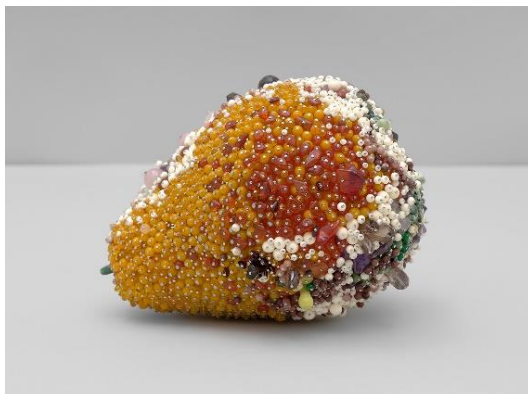
Slika 7, Kathleen Ryan, Slaba točka (Soft Spot) 2019, jantar, ametist, rodonit, ružičasti kvarc, serpentina, ahata drveća, jaspis iz džungle, dimni kvarc, granat, ahata, tirkiz, maslin od žada, kost, ružičasti lepidonit, staklo, čelične igle na premazanom polistirenu, 6 x 8 x 6 in., Credit: All images Courtesy the artist and Josh Lilley, London, photography Lance Brewer

„Logika kasnog kapitalizma koji kontrolira naše vrijeme jest sublimirati svaku potencijalnu pobunu i pretvoriti je u vrlo suprotnu. U svjetlu ove teorije, svako umjetničko djelo, nakon što je izloženo i prodano, postaje proizvod namijenjen konzumaciji, kao i svaki drugi predmet masovne proizvodnje. Kao što je Walter Benjamin istaknuo, umjetnost i kultura postale su kooptirane i namjeravale su odgovarati kapitalističkim interesima gdje joj uvjeti masovne proizvodnje i reprodukcije umjetnosti oduzimaju funkciju pojedinačne cjeline. Čini se da je sama umjetnost postala roba za kupnju i prodaju, što znači da je konzumerizam uspio progutati, proždrijeti i ispljunuti upravo ono što ga je kritiziralo." (Martinović, 2016)