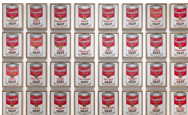
Slika 1, Andy Warhol, Limenke Campbellove juhe (Campbell's Soup Cans) 1962, akril sa emajliranom bojom na platnu, 32 ploče, MoMA, Floor 4, 412, © 2021 Andy Warhol Foundation / ARS, NY / TM, Licensed by Campbell's Soup Co.