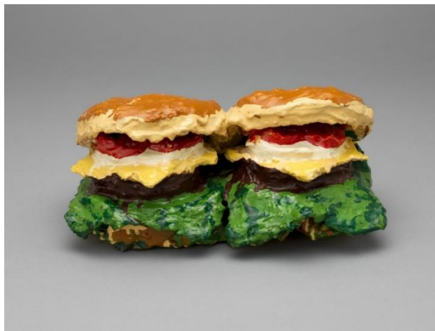
Slika 2, Claes Oldenburg, Dva cheeseburgera (Two Cheeseburgers, with Everything/Dual Hamburgers) 1962, burlap natopljen gipsom, obojen emajlom, MoMA, Floor 4, 408, Philip Johnson Fund, © 2021 Claes Oldenburg

Claes Oldenburg u svome radu Dva Hamburgera (Two Cheeseburgers, with Everything) iz 1962. godine (vidi sliku 2), prikazuje dva hamburgera smještena jedan do drugog naslagana visoko sa svim mogućim dodacima prezentirajući predmet za jelo, a oblikom podsjećaju i na otvorena usta spremna za zalogaj. U prosincu 1961. Oldenburg je iznajmio mali izlog u East Second Street u New Yorku i napunio ga ručno izrađenim, oslikanim predmetima koji su podsjećali na proizvode - košulje, satove, kobasice, kriške pite - uobičajene predmete dostupne za kupnju u trgovinama, a to je označilo početak višegodišnjeg projekta Trgovina . Još neki od radova su i tri predimenzionirane mekane skulpture koje je sašila njegova supruga Patty Mucha, a Oldenburg ih oslikao: kornet sladoled, komad kolača i hamburger. Dva Cheeseburgera su tek nešto veća od stvarnih. (MoMa, n.d.)