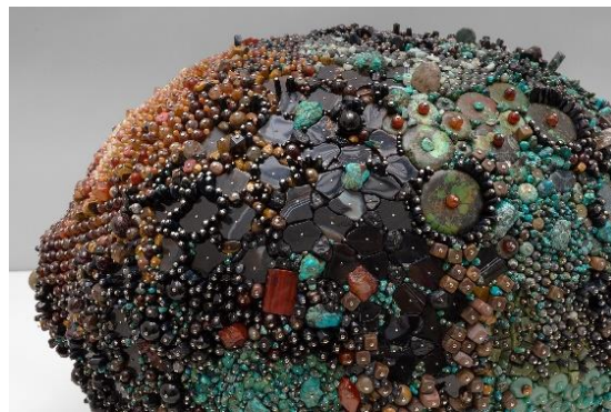
Slika 5, Kathleen Ryan, Crni limun (Black Lemon) 2019, opsidijan, crni oniks, ahata, tirkiz, pirit, tigrovo oko, jaspis, zadimljeni kvarc, tektit, lapis lazuli, aventurin i drugo drago kamenje premazano polistirenom, 19 x 18 x 27 inča, Credits: Courtesy of the artist and Josh Lilley, London, photography Lance Brewer

„Pleasures Known“, predstavljaju predimenzionirano pljesnivo voće. Skulpture su od pjene i obložene perlama poludragog kamenja. Poludrago kamenje je svjetlucavo i čvrsto, vizualna senzacija, a gradi koloniju mekane plijesni (vidi sliku 5, sliku 6 i sliku 7). Kako umjetnica sama kaže: „Skulpture su lijepe i ugodne, ali s njima dolazi ružnoća i nemir“ (Maddox, 2019) Skulpture podsjećaju na djelomično konzumirano voće nizozemskih vanitas slika iz 17. stoljeća umjetnika poput Jana Davidsza de Heema i Willema Claesza Hede, te isto tako komentiraju svjetovne ekscese. (Maddox, 2019; Karma, n.d.)